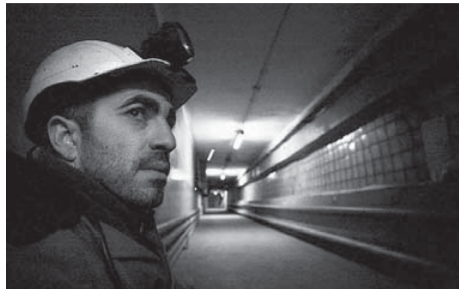
Из фотостории "Крайняя смена"