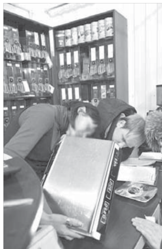
В некоторых случаях найти имущество должника не так просто

Человек несет ответственность за свои поступки. Взял в банке кредит – плати. Выступил поручителем – будь готов в случае форс-мажора отвечать за другого. А как быть с теми, для кого закон не писан? Мы продолжаем рассказывать про аферы с банковскими кредитами.