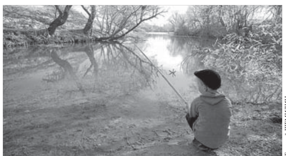
Из серии "Пацаны с хутора Лазного".

Другие работы можно увидеть на сайте http://fotoclub-taimyr.ru