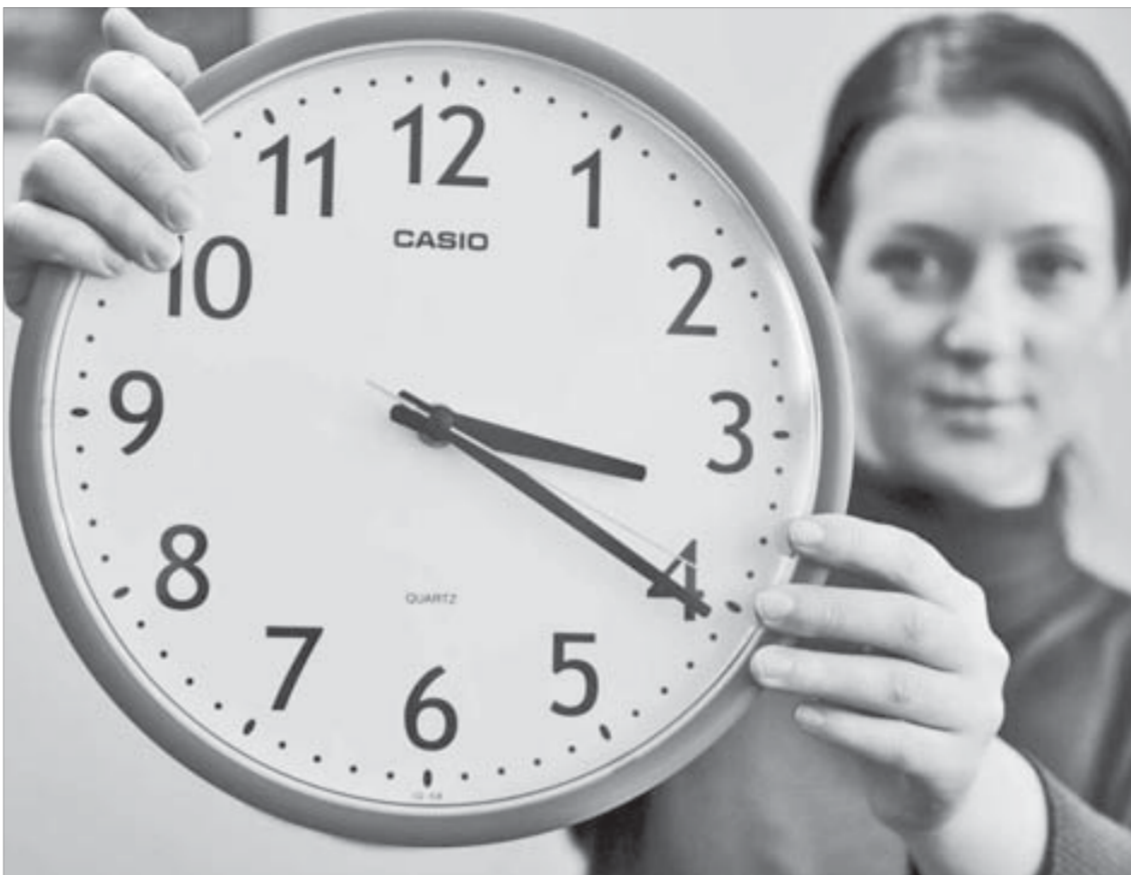
Часы мы переведем в марте

"Я принял решение об отмене перехода на зимнее время начиная с осени текущего года и даю соответствующее поручение правительству", – сказал Дмитрий Медведев на встрече с молодыми учеными и лауреатами премии президента РФ в области науки и инноваций за 2010 год.