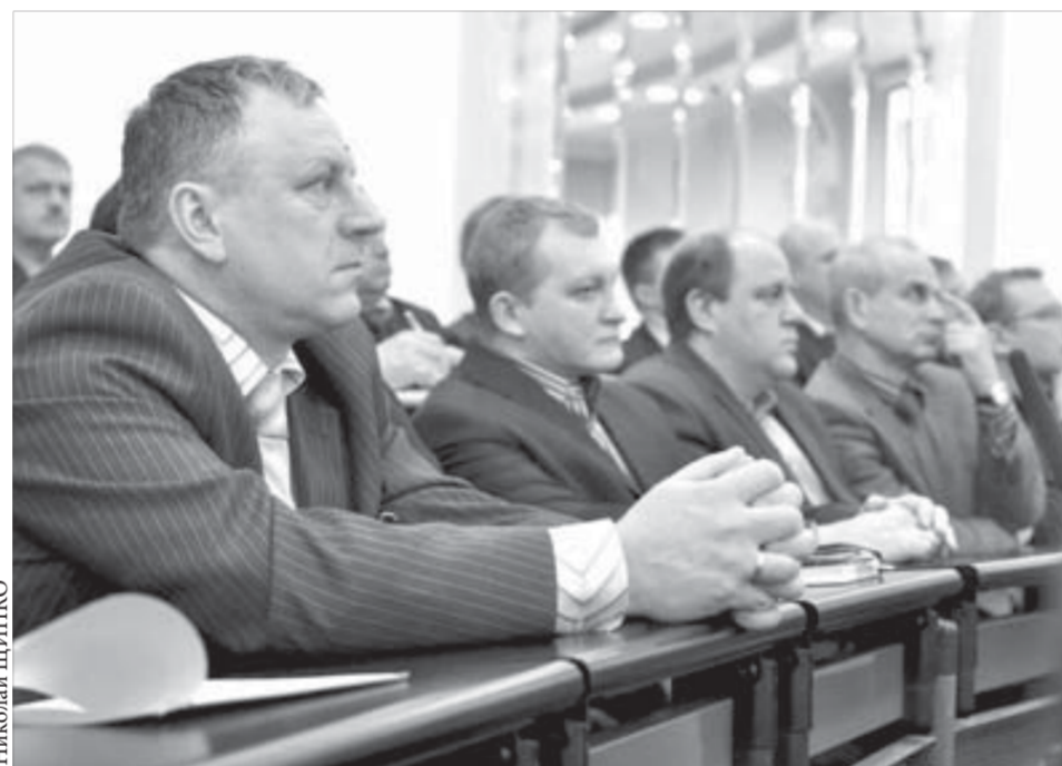
Кадры компании пополнятся за счет выпускников СФУ