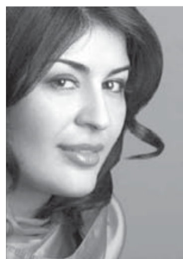
Вероника Джиоева вдохновила на оперу

К этому празднику готовится постановка оперы Бизе «Кармен». Идея показать этот спектакль возникла после прошлогоднего фестиваля, когда город познакомился с солисткой Большого театра и Новосибирского театра оперы и балета, мировой оперной звездой Вероникой Джиоевой.