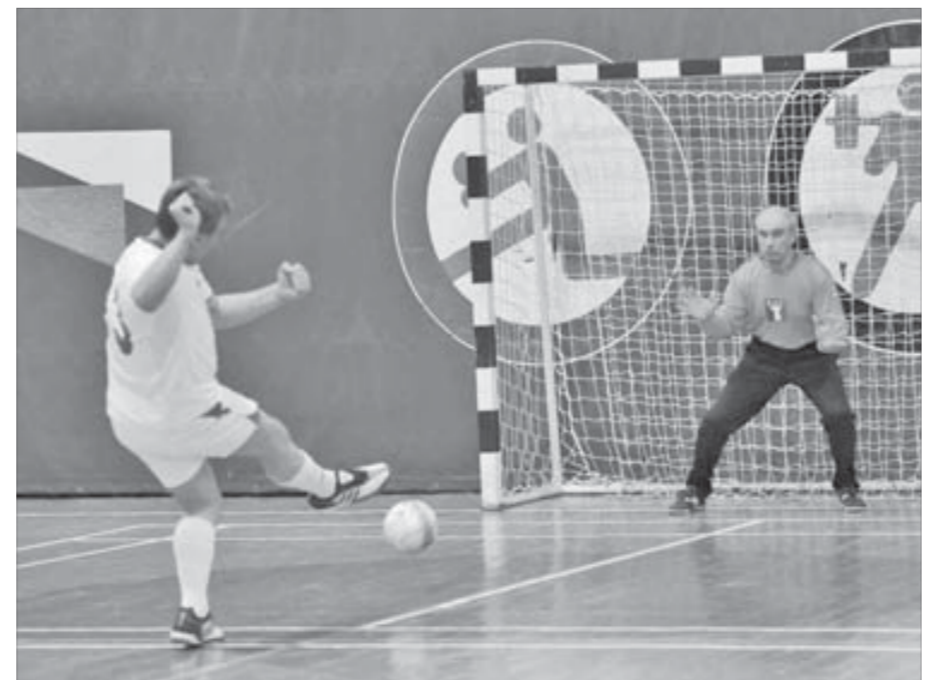
То ли пас, то ли пас