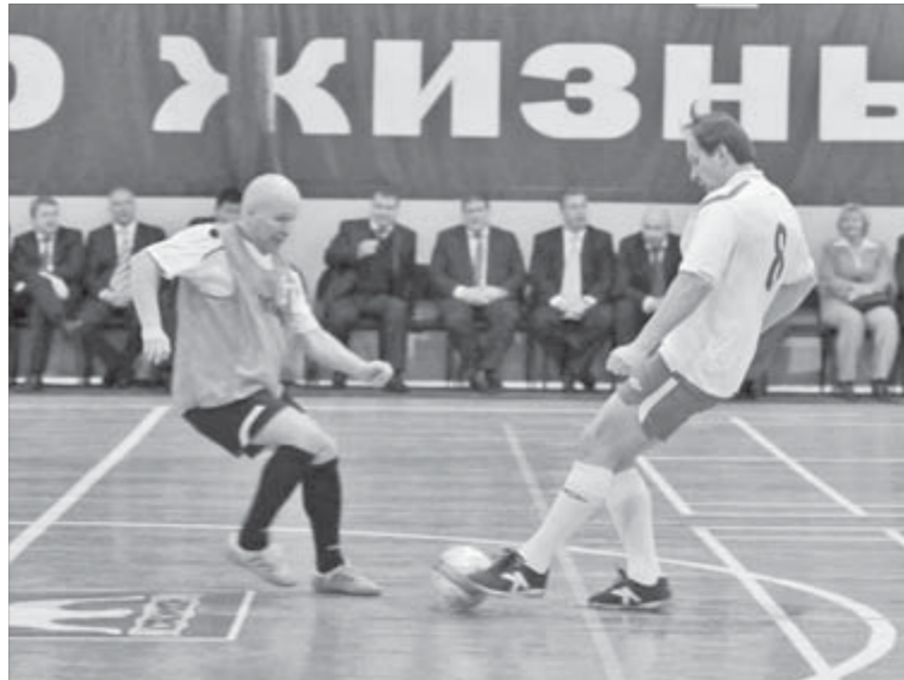
На кону – победа!

Еще не один раз впоследствии игроки сборной севера Красноярья