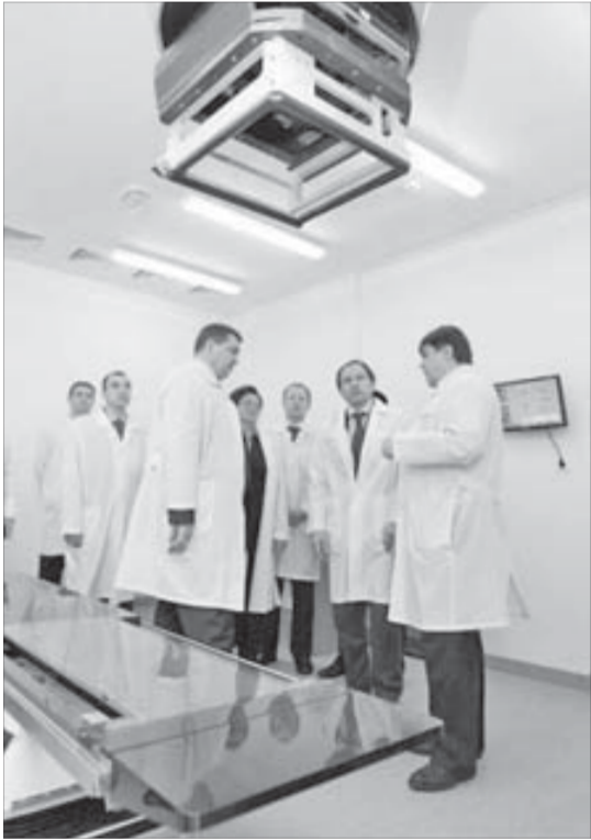
Оборудование смонтировано и работает