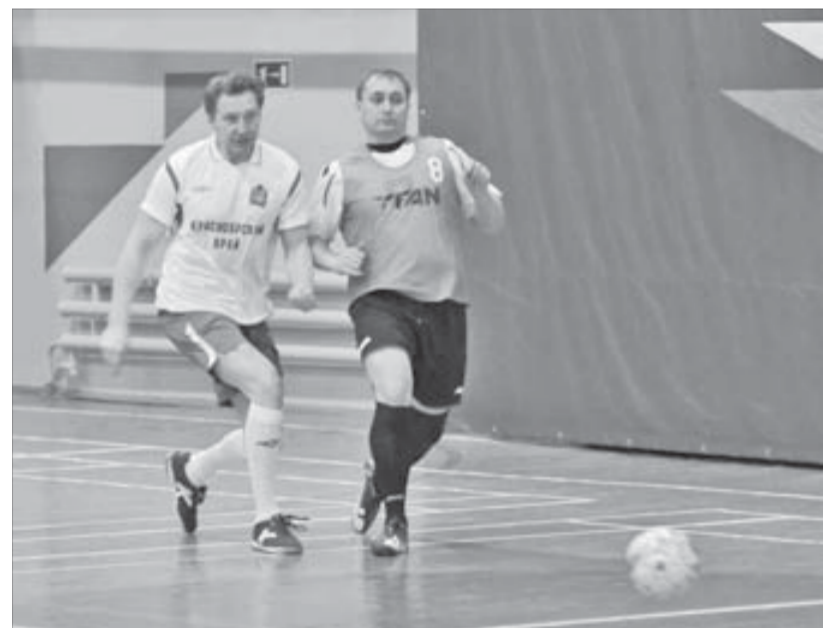
С изяществом руководителей

Основное время товарищеского матча закончилось по всем правилам субординации и гостеприимства – со счетом 5:5. Два гола забил глава Таймыра, два – губернатор. Но для спортивных состязаний этого было недостаточно, и судья назначил серию пенальти. Несколько раз вратари обеих команд становились в ворота, несколько раз счет сравнивался. Однако в решающий момент вратарь норильчан сумел сказать последнее слово и отбил удар Льва Кузнецова – северяне все-таки оставили правительство края позади. Все по-честному – счет 7:6 в пользу севера.