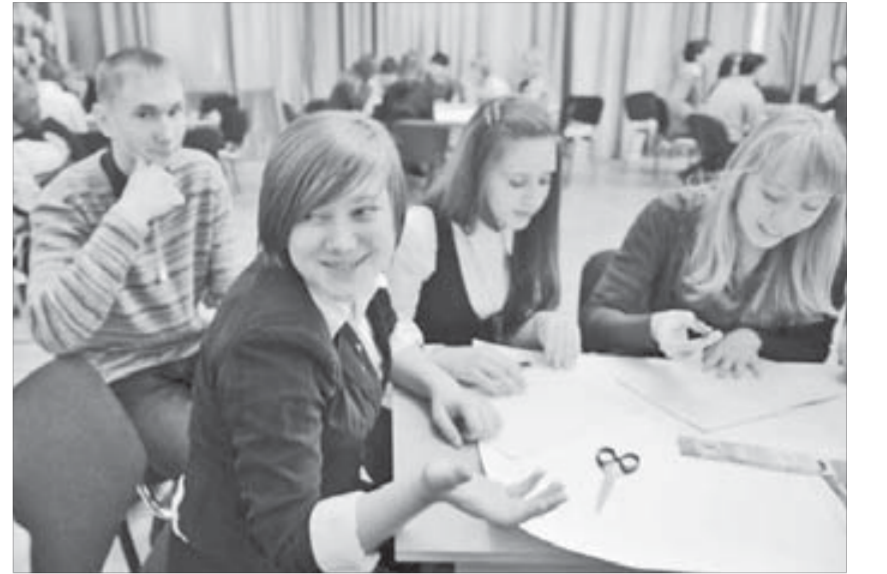
Идеи у нас есть

Мероприятие включает традиционную выставку молодежных общественных организаций, семинары по проектной грамотности и молодежному предпринимательству. Впервые на форуме будет работать профориентационная площадка «Ярмарка профессий» с презентацией средних специальных и высших учебных заведений. Предусмотрена организация детской комнаты временного пребывания, а также творческая мастерская, где каждый желающий сможет получить мастер-класс по брейк-дансу, капоэйре, графическому рисунку, макияжу и плетению афрокосичек.