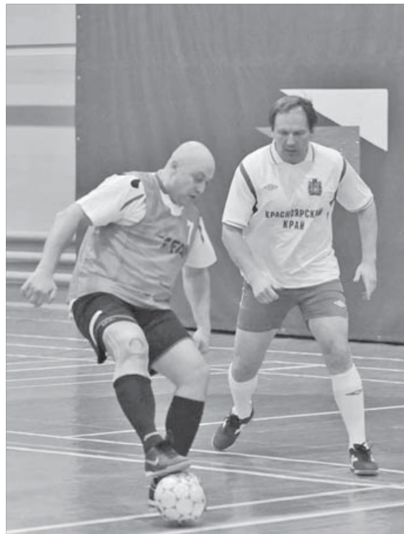
Борьба хозяйствующих субъектов – за мяч