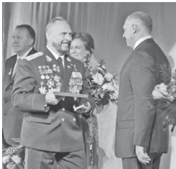
Звание почетного гражданина Норильска певец принимал в мундире генерал-майора запаса

Если продолжать разговор о планах юбиляра, то у норильчан, собирающихся отдохнуть в санатории "Заполярье" в мае, есть шанс увидеть бывшего земляка в "Парфюмере". Рок-опера Игоря Демарина по роману Патрика Зюскинда 10 мая будет показана в Краснодаре, следующее выступление должно состояться в Сочи. Выступят ли московские артисты в Норильске, доподлинно неизвестно. Но привозил же Пьявко "Парад теноров" в 2003-м и 2005 годах. И наверняка не зря три года назад он хотел показать городу демоверсию рок-оперы. Надежда увидеть певца с новым проектом – предположим, на сцене Заполярной драмы – все же есть. Тем более что зрители, побывавшие на премьере, называют музыкальную версию романа блистательным зрелищем, прекрасно исполненным как музыкантами, так и актерами.