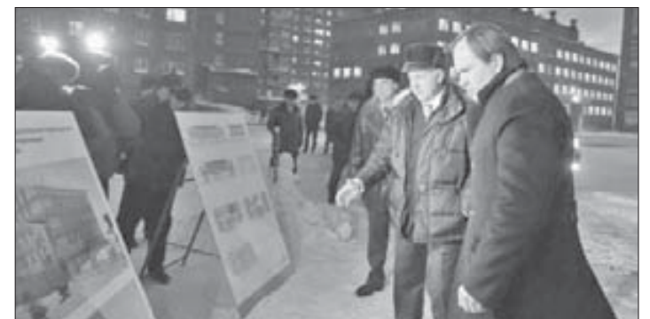
Губернатор оценил будущий детсад

торый «вырастет» здесь за счет консолидированного бюджета Красноярского края. Такие же красивые современные детские сады появятся на улицах Дзержинского и Орджоникидзе. Эти два дошкольных учреждения город получит за счет инвестиций Заполярного филиала «Норильского никеля». Предварительная стоимость каждого детсада – 460 миллионов рублей. Финансирование проектных работ осуществляется за счет средств Заполярного филиала. В настоящее время уточняется сметная стоимость проекта с учетом подключения объектов к городским