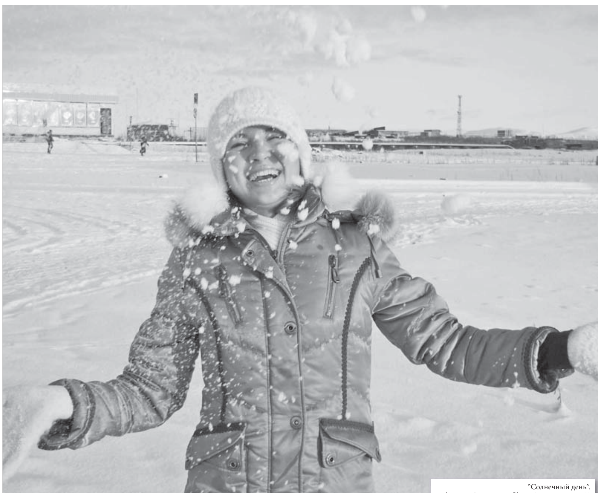
“Солнечный день”. Автор – Александра Каня, 8 лет, школа №41