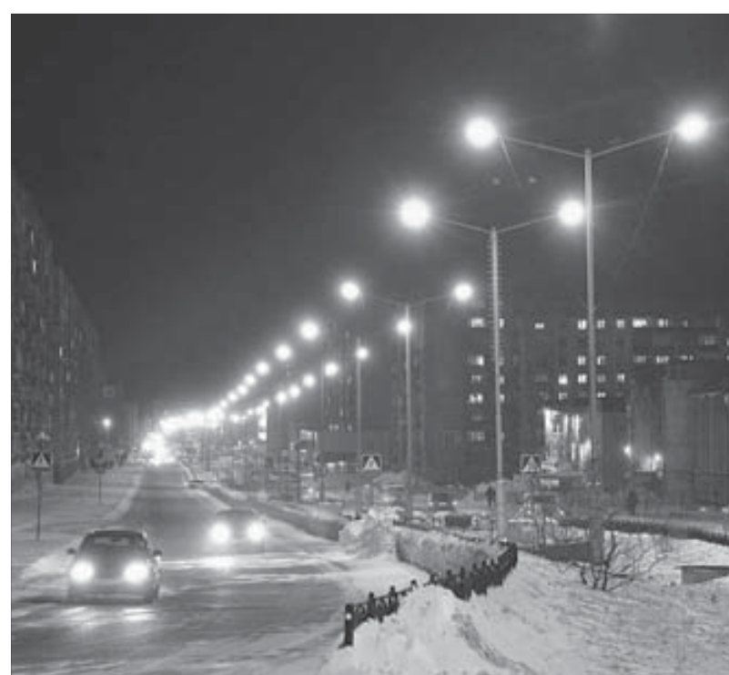
Мощность ламп в уличных фонарях – 400 ватт

Производство меди ожидается на уровне 360–365 тысяч тонн в России и 20–25 тысяч тонн на предприятиях Norilsk Nickel International. Также в 2011 г. планируется произвести 2,7–2,715 млн тройских унций палладия на российских предприятиях и 150–155 тысяч тройских унций – на зарубежных. Производство платины планируется на уровне 665–675 тысяч тройских унций в России и 40–45 тысяч на предприятиях Norilsk Nickel International.