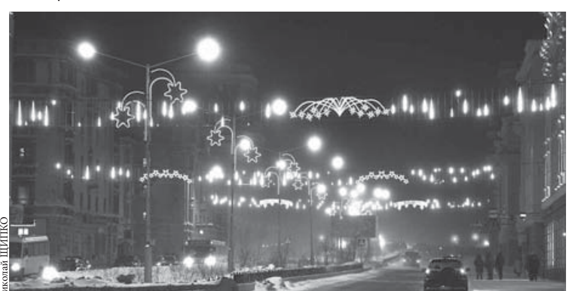
Сегодня улицы города освещают полторы тысячи фонарей, в которых горят три тысячи ламп

— Сколько опор уличного освещения «Норильскавтодор» заменил в прошлом году? Может быть, появились фонари на ранее не освещенных участках?