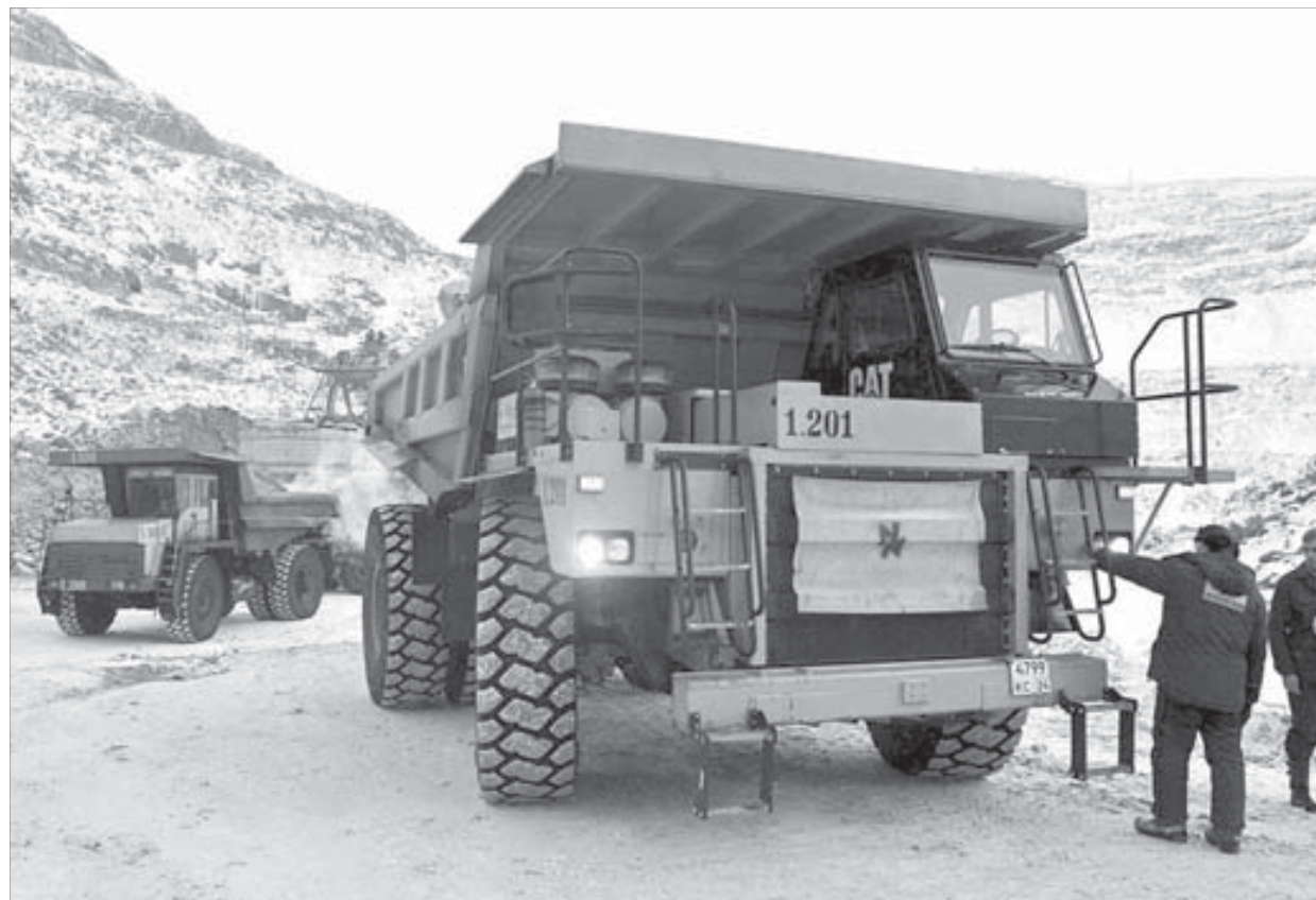
За руль этих уникальных машин может сесть не каждый