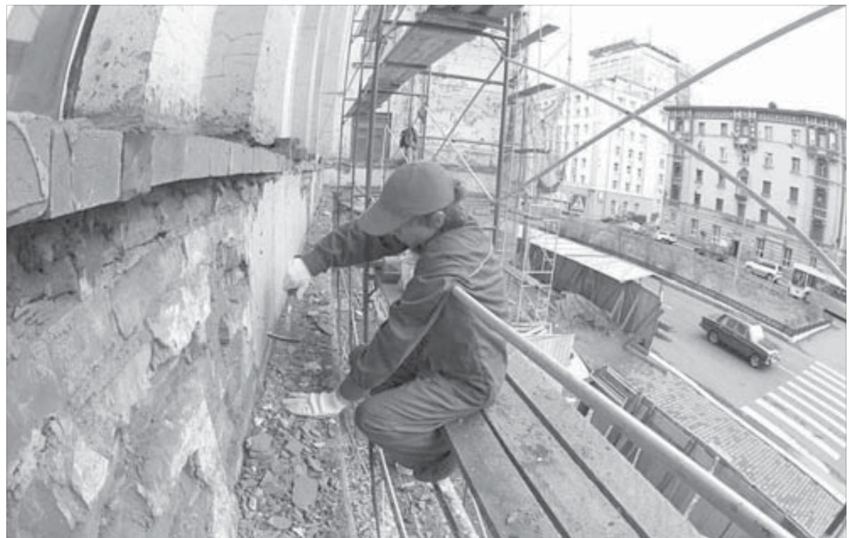
Ремонты фасадов на Ленинском проспекте продолжатся