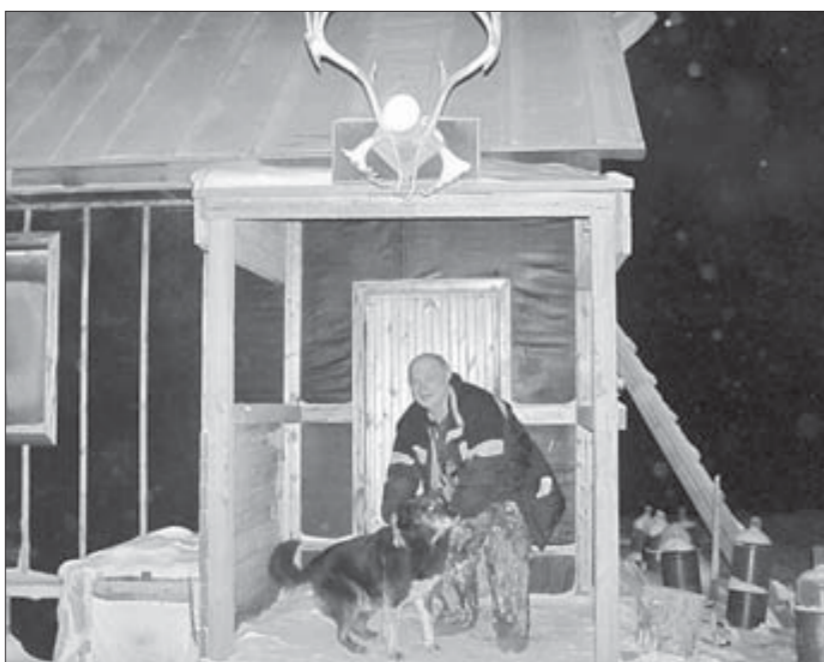
В гостеприимном доме и собаки ласковые

Около тысячи километров по выстуженной тундре прошел на вездеходе вместе с опергруппой журналист «Заполярного вестника», участвовавший в рейде милиции и госохотнадзора по предупреждению на Таймыре браконьерства, изъятию нелегального охотничьего и боевого оружия, выявлению находящихся в розыске лиц и незаконных мигрантов.