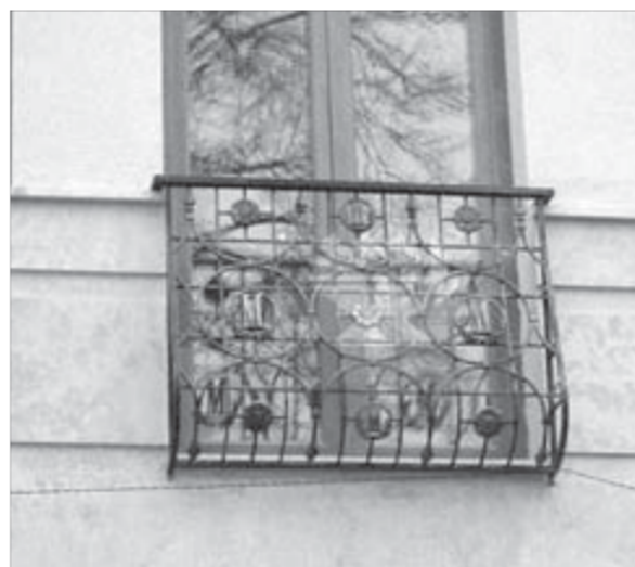
В Норильске могут появиться такие балкончики