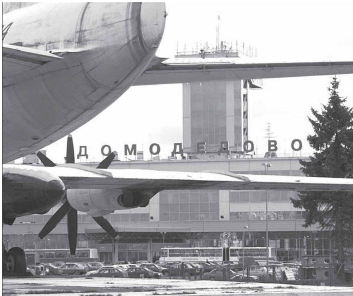
Аэропорт работает в обычном режиме, но меры безопасности усилены

По одной из версий, террористы организовали взрыв в аэропорту Домодедово со второй попытки. Первая не удалась по причине незапланированного самоподрыва готовящейся смертницы – уроженки Чечни. Это сообщение распространило агентство Интерфакс со ссылкой на источник в правоохранительных органах.