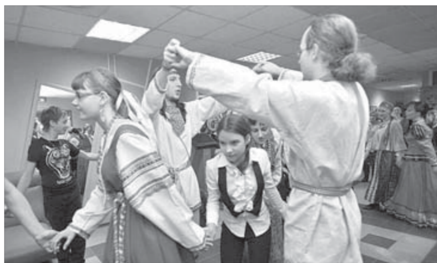
Оказывается, хоровод нечто большее, чем простое хождение по кругу

Ну а в холле библиотеки уже готовили горячий чай с булками, чтобы отогреть набегавших гостей. Эта своевременная мера вернула участникам встречи прежний задор, поэтому желающих поучаствовать в битве подлущикам нашлось немало. Забравшись на скамейку, игроки увлеченно молотили друг друга по бокам, пока один из них не терял равновесие и не спрыгивал на пол. Бой продолжался, все желающие попробовали свои силы. Ну а в завершение праздника участники, вновь выбравшись на улицу, отпустили в небо нарисованное солнышко, привязанное к связке воздушных шаров. Понаблюдав за его полетом, встречающие тоже стали расходиться по домам. Вернулись на свои рабочие места и библиотечари, чтобы планировать новые праздники для своих читателей.