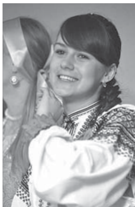
С песнями и прибаутками

Когда все участники вдоволь наплясались, им предложили порадовать солнышко, поиграв на свежем воздухе. Эта идея была встречена всеобщим одобрением, и ребята высыпали во двор. Встречающие солнце разделились на две команды и продемонстрировали свою ловкость, возродив забытое искусство бега в мешках. Совершая отчаянные прыжки, ребята добивались до финиша, а затем столь же поспешно прыгали обратно к своей команде,