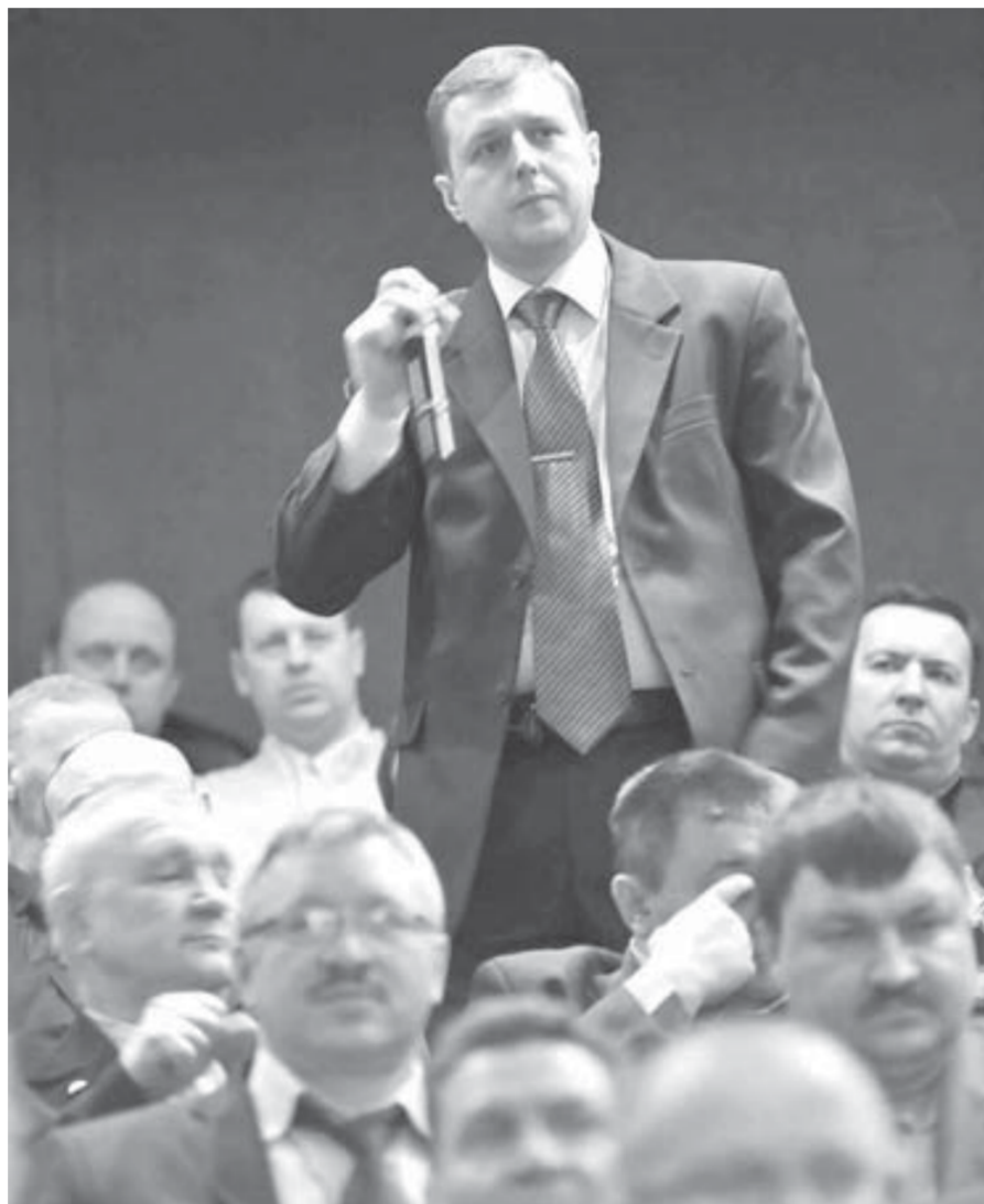
Характер вопросов ремонтников изменился

Говоря о социальной ответственности компании, директор Заполярного филиала привел в пример и программу "Наш дом", особенно востребованную работниками "Норильского никеля". Вначале она была адресована труженникам ЗФ и Заполярного транспортного филиала. Компания выделила 4 миллиарда рублей на покупку тысячи квартир в Московской области и Краснодарском крае. Однако благоприятная для нас конъюнктура цен позволила сэкономить определенную сумму и таким образом увеличить в этом году количество участников программы. В их число могут войти труженники "Норильск-никельремонта" и других дочерних и зависимых обществ. По этому вопросу должен принять решение совет директоров ГМК "Норильский никель".