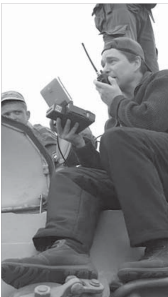
Кадр из фильма "Тихая застава"

— Фильм не претендует на историческую достоверность в деталях, — отметил он. — Это определенно художественный жанр. Но я голосую за то, чтобы "Тихую заставу" показывали молодежи, потому что фильм формирует правильное настроение. Мужчина должен быть мужественным.