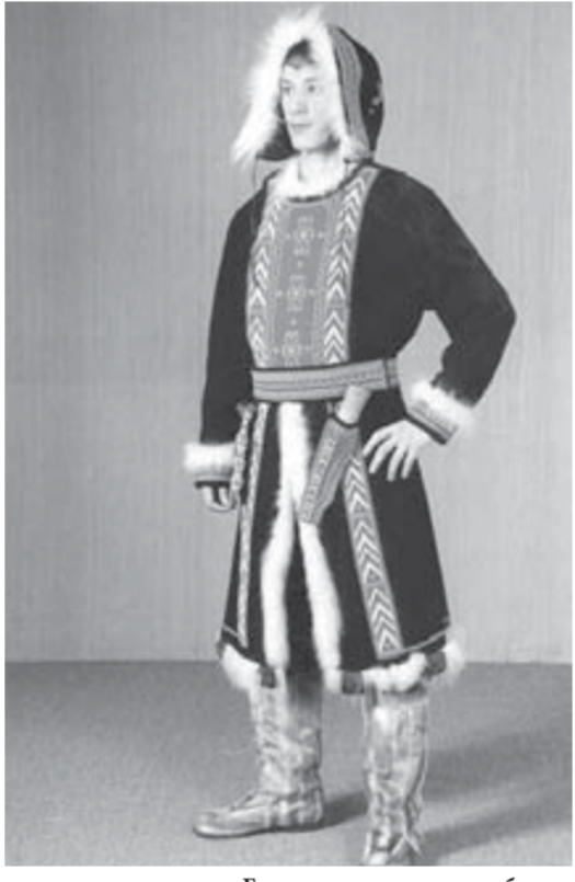
Еще одна дипломная работа – мужская долганская одежда

простая вот эта работа и насколько сложная та, что рядом. Но у простой – прекрасное, безукоризненное исполнение.