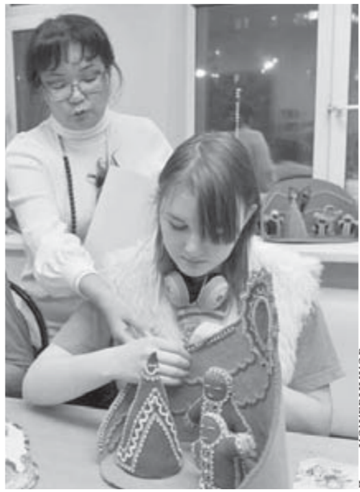
На занятиях по мастерству