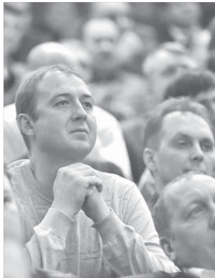
Встречи помогают понять, какие проблемы волнуют людей