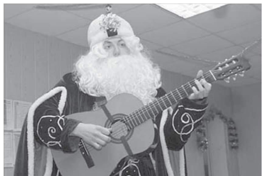
Дед Мороз – настоящий виртуоз!

– Ну и что же, очень хорошо, что пришли к нам в наш праздник, – от-