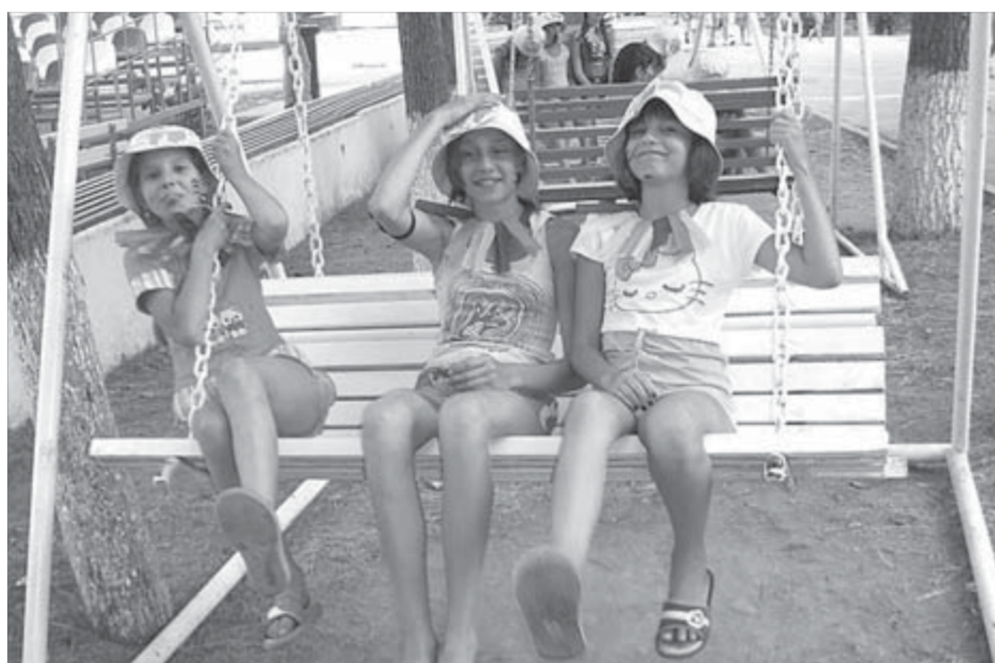
Если лето не кончалось

Следующее заседание межведомственной комиссии, анализирующей ценовую ситуацию на продовольственном рынке Норильска, состоится в середине февраля.