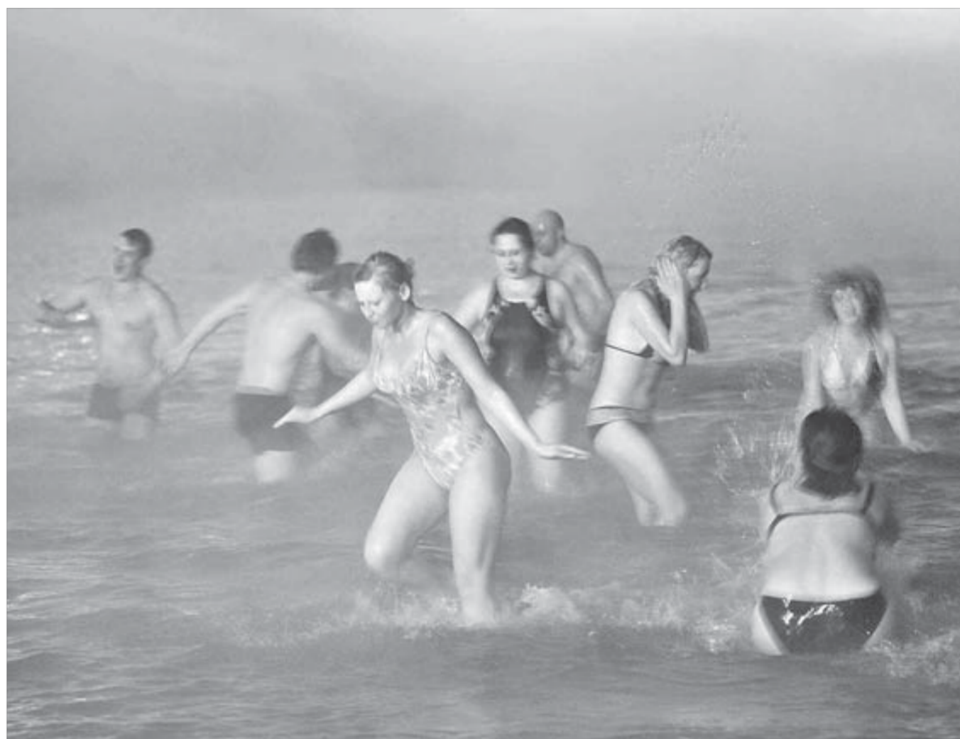
Так много людей на Долгом в Крещение еще не собиралось