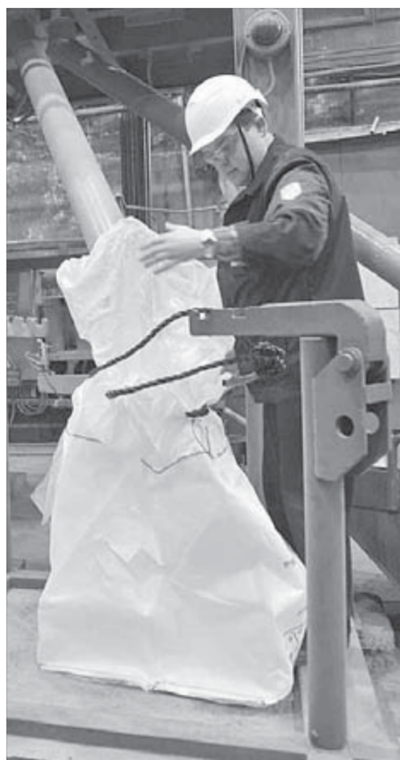
Гранулированный никель сразу попадает в мягкие контейнеры