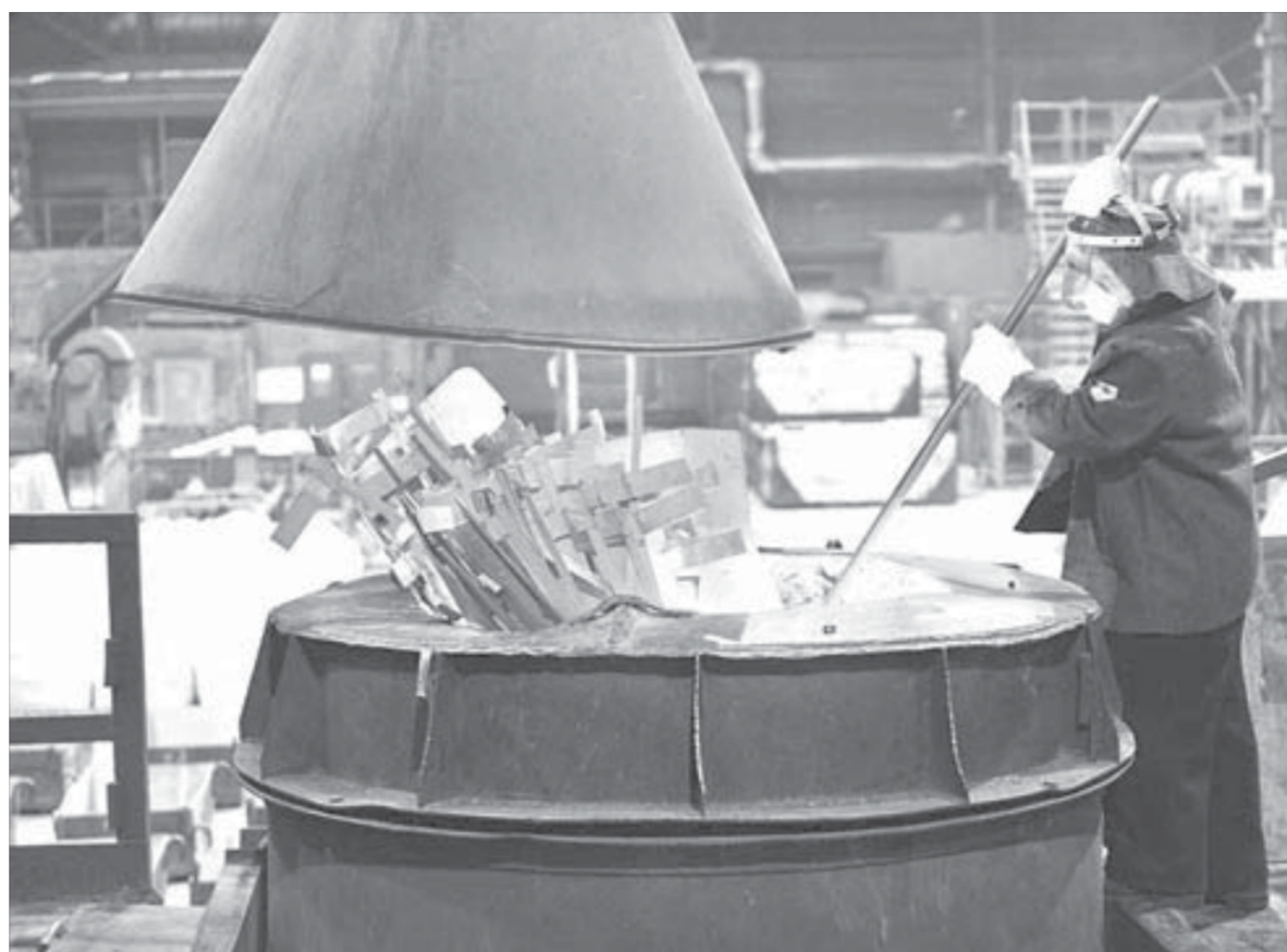
Сейчас обрезки катодов начнут плавиться

– Это направление, в котором мы будем двигаться в наступившем году, – говорит наш экскурсовод о ближайших планах цеха. Через пару минут мы разглядываем мягкую тару big bag – позитивный итог года минувшего.