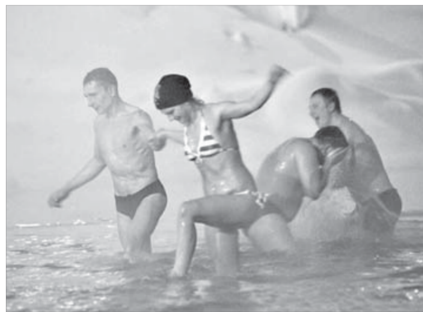
Колкое дно не помеха отважным

Собственно, прочла я все это и подумала: ничего нового. И в советские времена Россия выживала на картошке. "Щи да каша – пища наша" – поговорка древняя. Норильск и тогда, и сейчас – исключение из правила. Так что еще можно поспорить, где лучше жить: на Севере или в местах с благоприятным климатом.