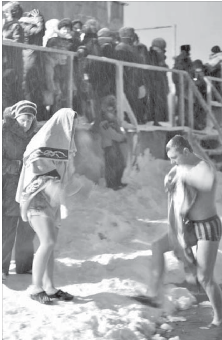
...кто-то шел в озеро, раздевшись прямо на снегу