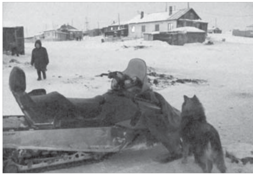
Рассветает в декабре всего на два часа

даже если их нет на хлеб" верен для тундры так же, как и для любой городской "гостинки". А вот относительно зажиточные, почувствовавшие твердую почву под ногами люди тундры не пьют. Сумевшие вырваться из нищеты, какой бы национальности они ни были, стараются больше не упасть в беспробудность. Вот только как из этой нищеты выбраться?