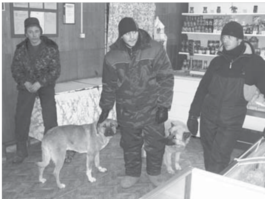
Собаки, зашедших погреться, в Усть-Аваме из магазина не выгоняют