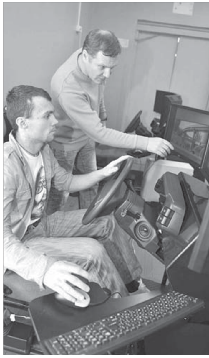
Учебный автоинструктор – первый шаг к практическим занятиям