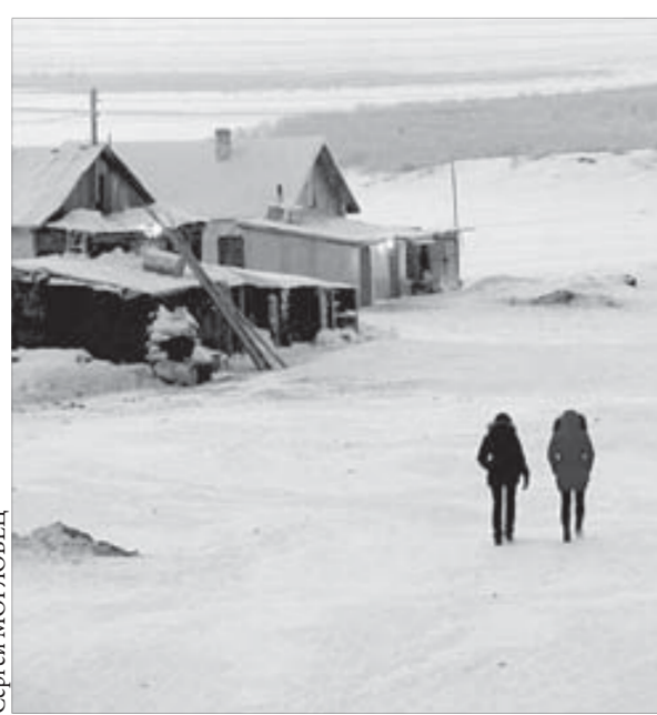
Сергей МОГЛОВЕЦ За селом – снежная бесконечность

Курс акций ОАО "ГМК "Норильский никель" – 7556 рублей. ОАО "Полос Золото" – 1925 рублей.