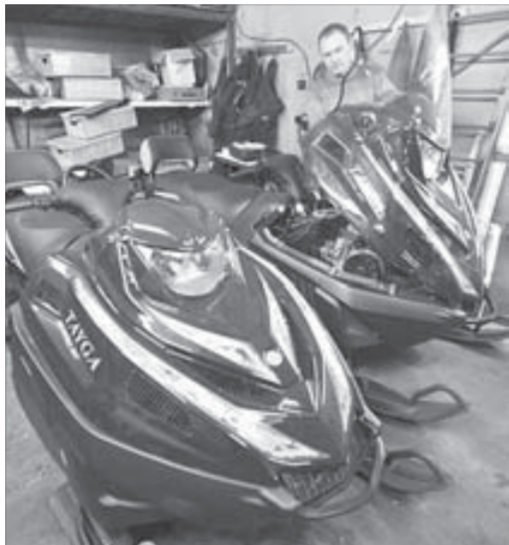
Автопарк пополнился снегоходами

Автомобильный парк Норильской школы безопасности дорожного движения пополнили два снегохода "Тайга-550" и учебный автобус "ПАЗ". В этом году планируется увеличить выпуск водителей категории D, а также возобновить подготовку водителей снегоходов.