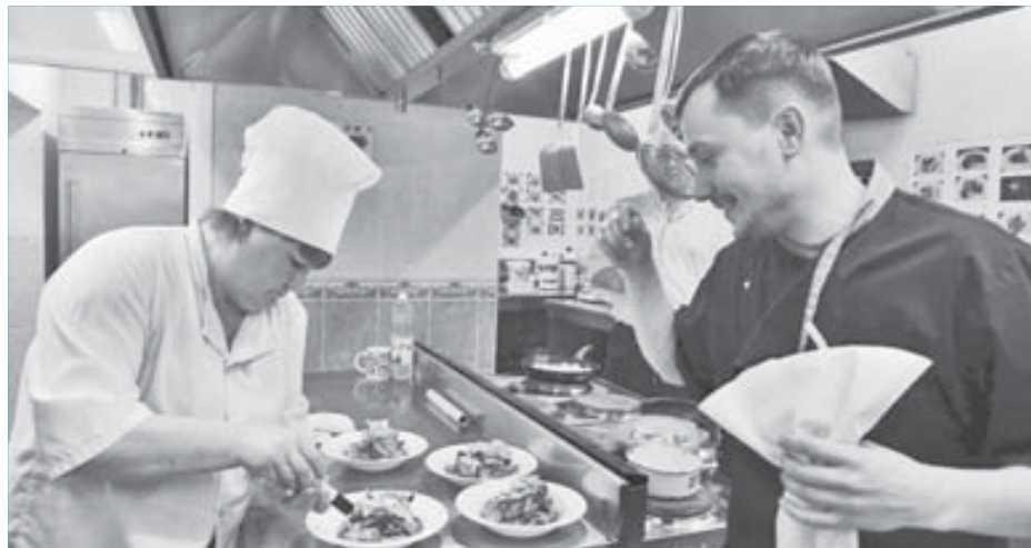
Почерк повара видно по тому, как разложено блюдо, как разлит соус

– В “Академии гостеприимства”, насколько я знаю, вам удалось продемонстрировать хорошую подготовку.