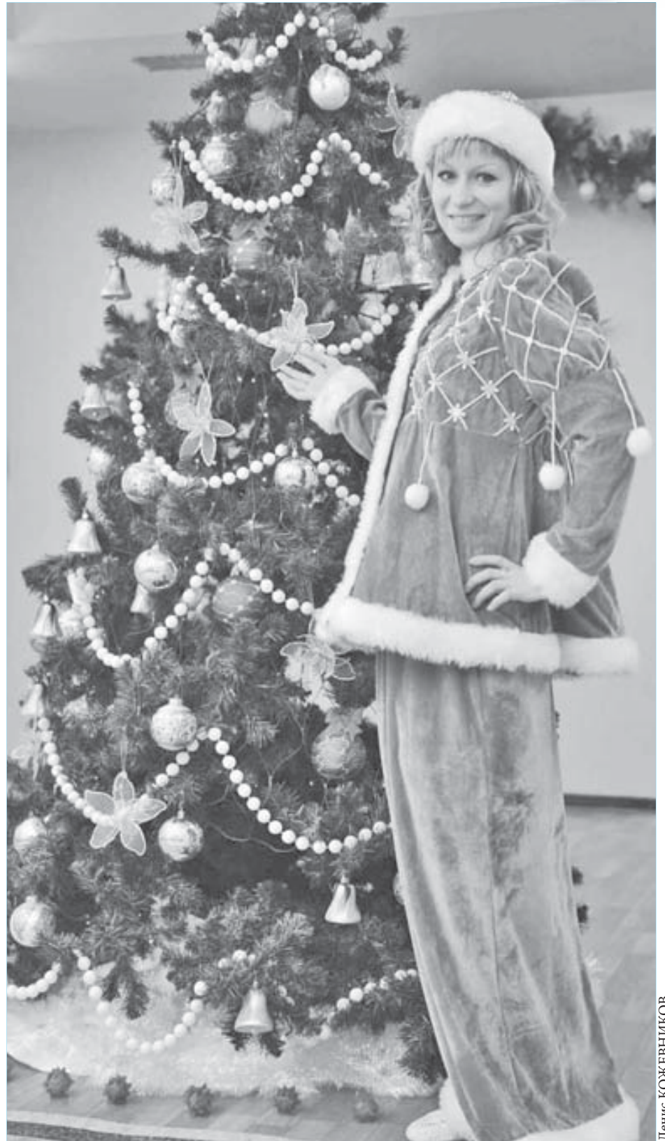
Дед Мороз улетит. Зато Снегурочка всегда рядом