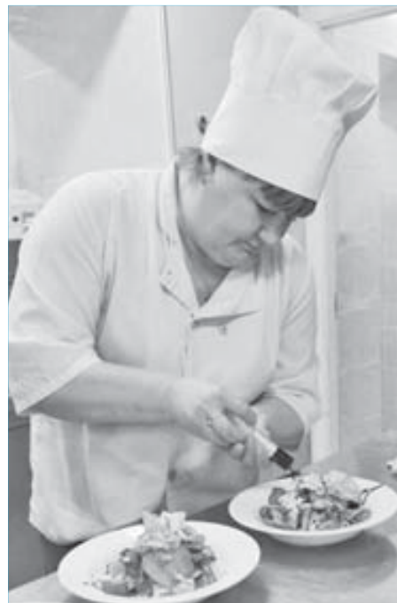
Такое впрыскивание придает блюду особый вкус

Вегетарианское блюдо готово, можно встречать год Кролика.