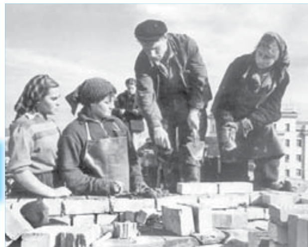
55 лет назад к строительству новых зданий приступили участники комсомольского десанта

Одна из важных дат: 90 лет исполнится Первому дому Норильска, построенному экспедицией Николая Урванцева летом 1921 года на Нулевом пикете и затем несколько раз переезжавшему на новое место. Зимовщики, отмечавшие в этих стенах новый, 1922 год, сомневались даже в том, что в будущем в голой тундре будет построен большой город-завод. И уж тем более никому в голову не приходило, что когда-нибудь в нем будут отмечать китайский Новый год.