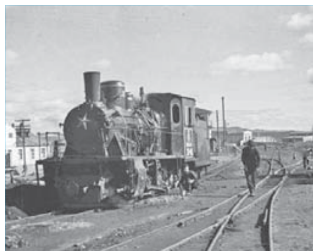
75 лет назад в НПр возникло железнодорожное сообщение