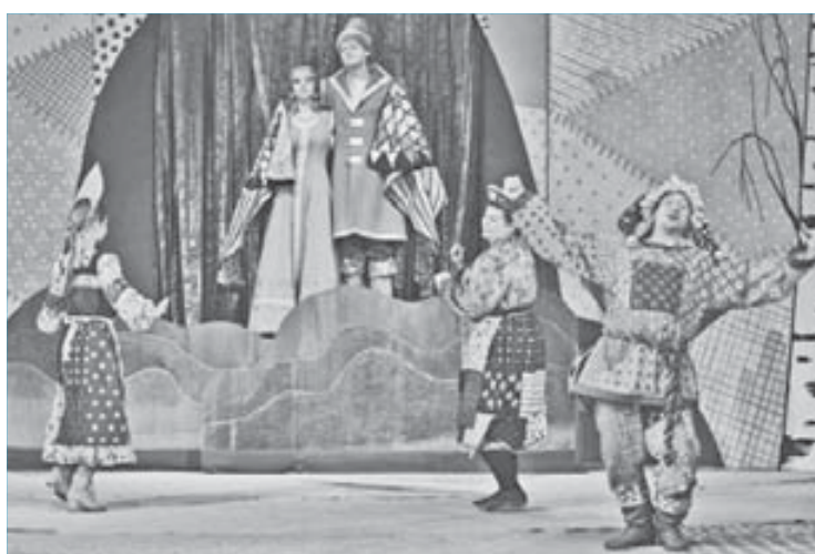
Тут и сказочке конец

рождалось в процессе обсуждения. Вообще, версия автора пьесы Юрия Сушко мне ближе, чем русская народная сказка про Емелю-дурачка. Нам оставалось только перенести на сцену и развить версию автора. Конечно, вместе с актерами мы сочинили и Емелю, и Щуку, главное, что материал для этого в пьесе был.