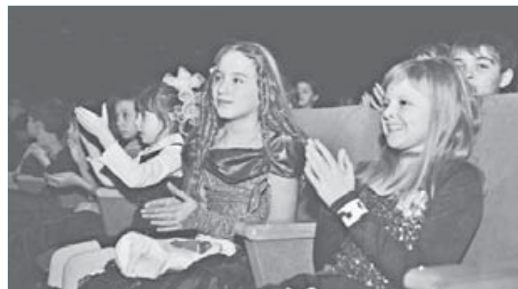
Первые зрители “Емелиных чудес” остались довольны спектаклем

“Емелины чудеса” не сойдут со сцены театра до 9 января следующего года. Каждый день (кроме 1 и 2 января) по три спектакля. Праздник начался!