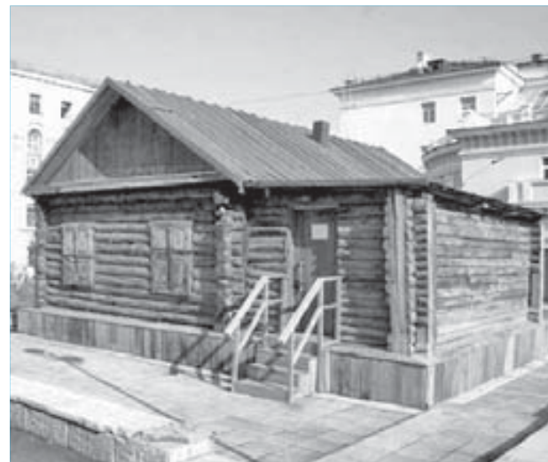
90 лет назад Первый дом Норильска стоял на Нулевом пикете