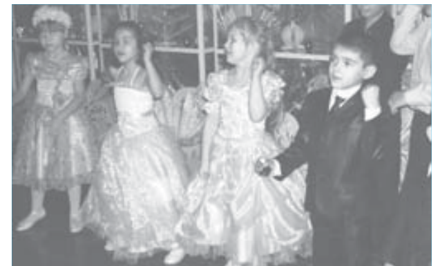
В хрустальном зале так и хочется танцевать

Что ж, в Новый год волшебство случается.