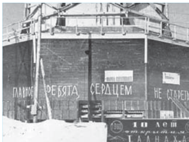
45 лет назад введен в эксплуатацию рудник "Маяк"