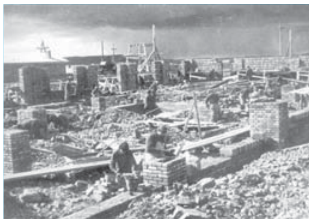
Строительство завода №25. 1943 год