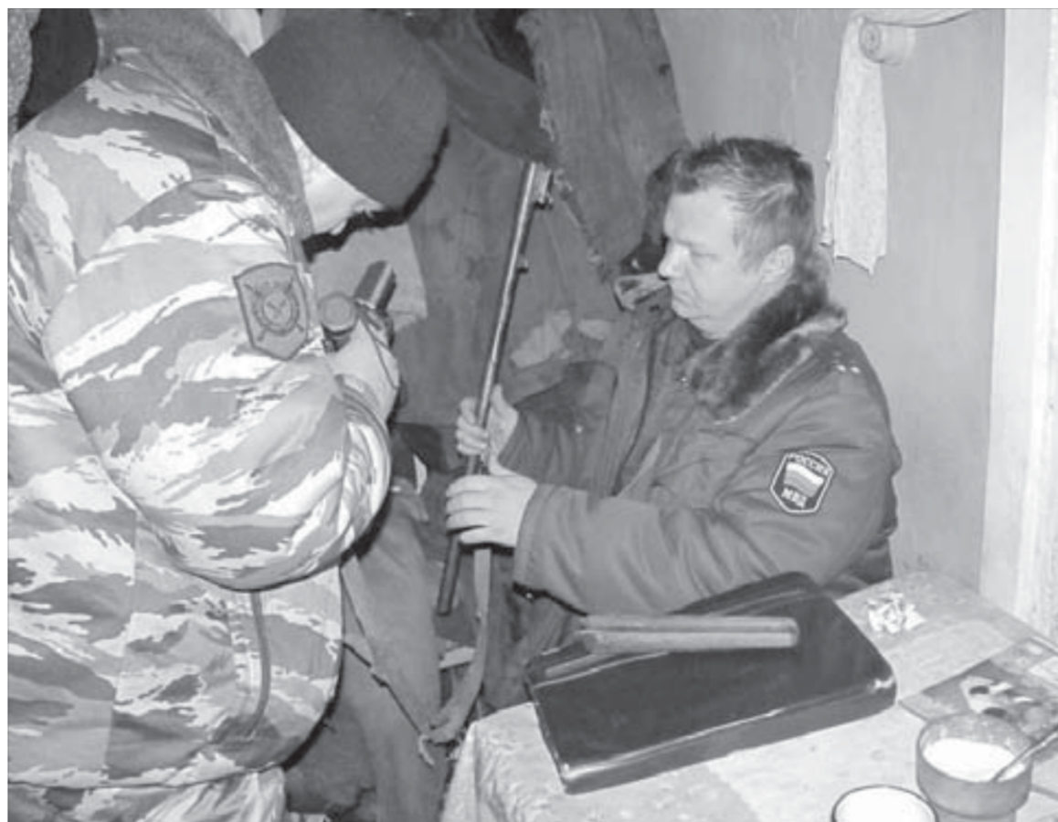
Незарегистрированное ружье и охотники, и милиция называют одинаково – "браконьсерки"

Размышляю: городскому жителю получить право на обладание оружием, которое для него по большому счету игрушка, легче, чем исконному жителю тундры, для которого ружье порой един-