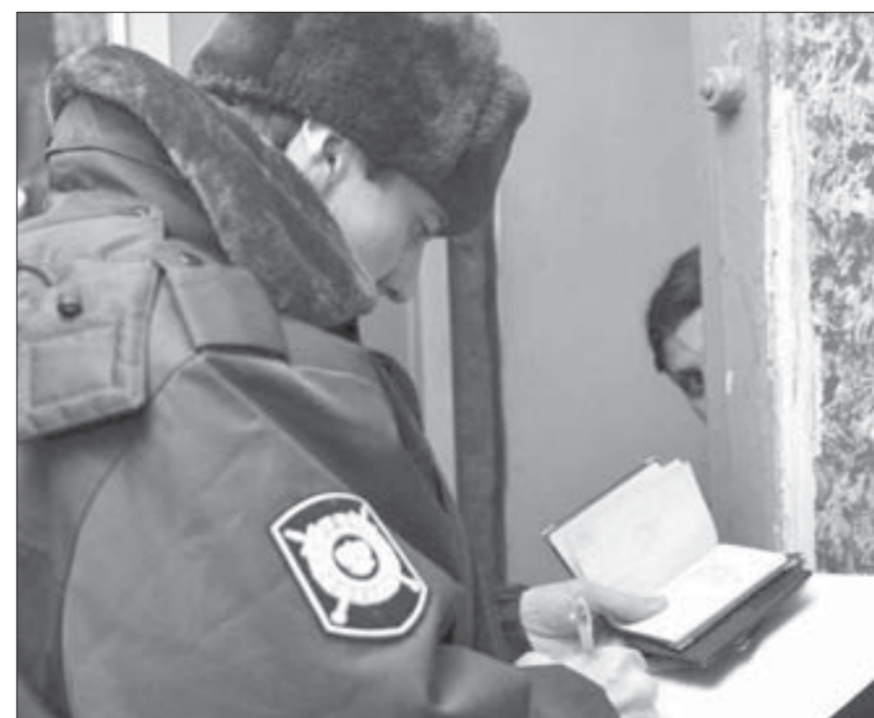
Проверка паспортного режима

Десять минут назад стражи порядка получили установку, как себя вести и на что обращать особое внимание. Рейды с целью профилактики правонарушений, выявления подростков, оказавшихся в трудной жизненной ситуации, проверки соблюдения гражданами паспортного режима норильское управление внутренних дел проводит постоянно, так что сотрудники патрульно-постовой службы, инспекции по делам несовершеннолетних, управления миграционной службы, участковые милиционеры свои задачи знают наизуток.