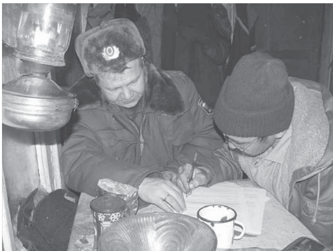
Фотография сделана со вспышкой. Обстановка в доме при свете керосиновой лампы еще более убогая

Если вы обладаете информацией, звоните по телефону 37-15-12, 47-24-09 или 02.