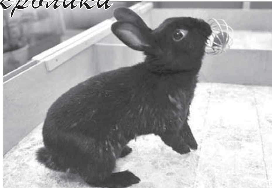
Крольчиху Нюсю в пору в цирк отдавать

Кроликов держат и дома, но лучше, если у животного есть своя клетка. Ведь кролики – грызуны. Могут проводку перегрызть и мебель “на зубок” попробуют. Кроликов можно приучить ходить в туалет. Например, крольчиха Зая, когда жила в семье, соблюдала все правила гигиены. Да и вообще, кролики не грязнули. Кроме того, они хорошо ладят с другими животными. Если в доме есть кошка, то они очень часто дружат и играют друг с другом. Еще одно положительное качество этих животных – дневной образ жизни. Ночью кролики предпочитают спать, и, когда их соседи по зооуголку – хомяки начинают носиться по клетке и кататься в беговых колесах, кролики пытаются их утихомирить. Правда, весьма своеобразным способом. Они подкидывают находящиеся в клетке предметы, думая, что шум напугает хомяков и те лягут спать. К прочим обитателям животного мира