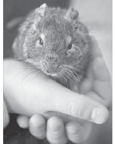
Дегу – карликовая шиншилла

За время пребывания в живом уголке Зая три раза рожала крольчат. Каждый раз