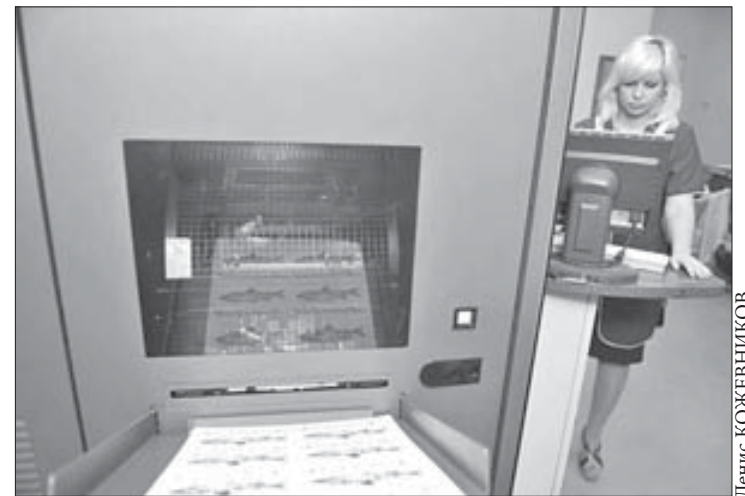
Так готовятся “рыбы счастья”

Набор открыток “Рыба счастья” можно приобрести в рекламном агентстве медиакомпании “Северный город”. Информация по телефону 23-88-88.