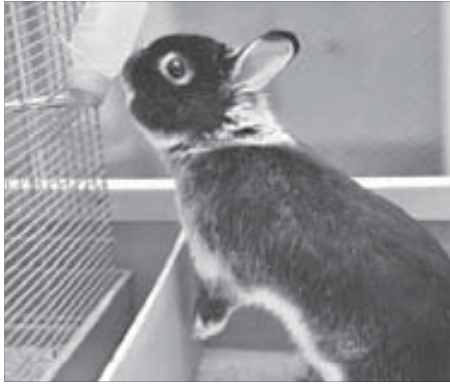
“Что-то пить хочется”

СЮТ они равнодушны. А вот маленькая песчанка набрасывается на кролика, если рядом есть кормушка. Переживает, что такой большой зверь съест все, что добыто ею с таким трудом.