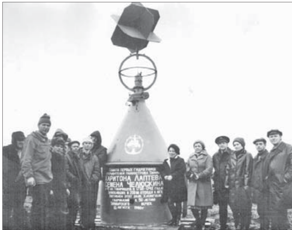
Исторический снимок открытия памятника в 1980-м

Строительные компании, заявившие о своем желании участвовать в проекте, предлагают возвести каркасные дома, которые производятся в заводских условиях. Таким образом одноэтажный дом будет готов под ключ всего за месяц.