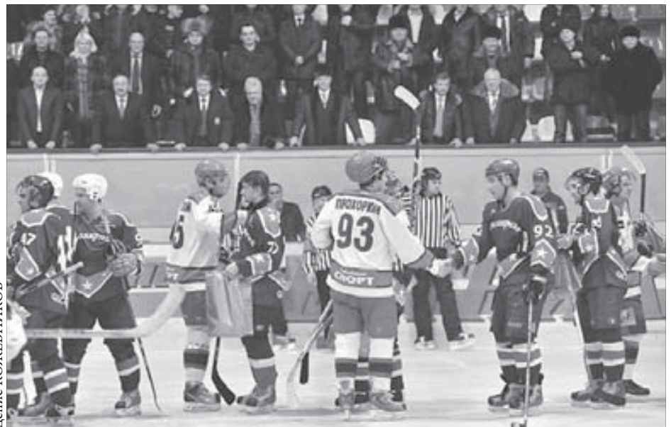
Зрители приветствовали игроков стоя