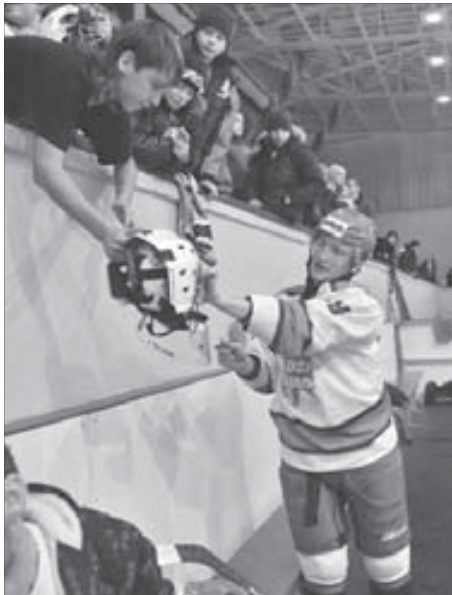
Автограф от звезды

– Нужно отрабатывать все элементы игры, вне зависимости от того, какую позицию вы занимаете в команде, – наставлял ребят главный тренер ЦСКА Сергей Немчинов. – А также нужно всегда серьезно воспринимать соперника, неважно, кто он – аутсайдер Континентальной лиги или неоднократный обладатель Кубка Стэнли.