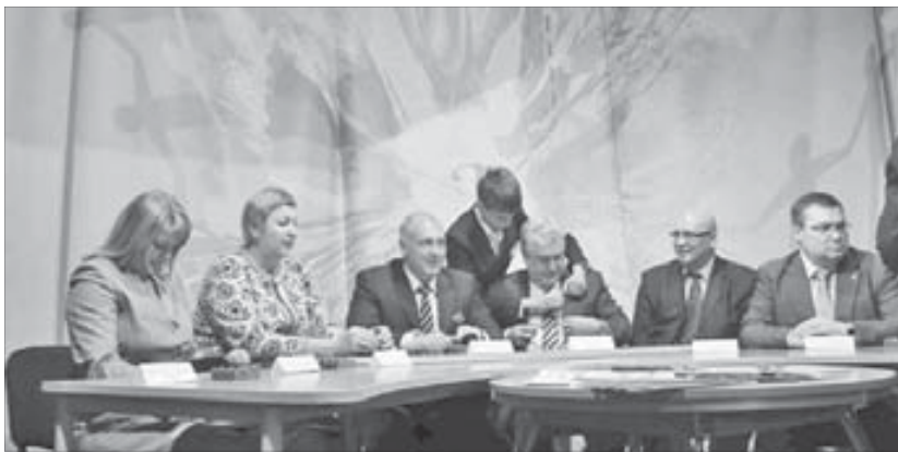
Большие гости за круглым столом. До съемки осталось...