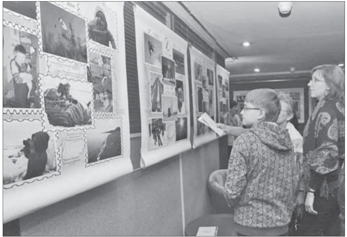
Детский конкурс стал одним из любимых событий фестиваля