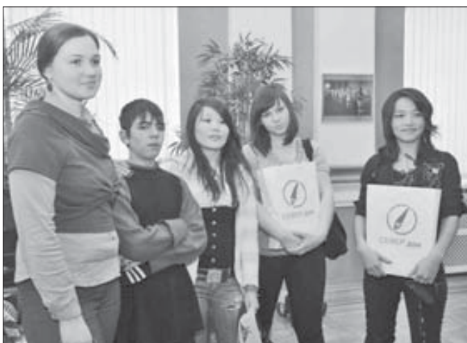
В феврале этого года ребята открыли для себя “СЕВЕР.ДОК”

Организаторами фотоконкурса являются медиакомпания “Северный город”, МБУ “Кинокомплекс “Родина”.