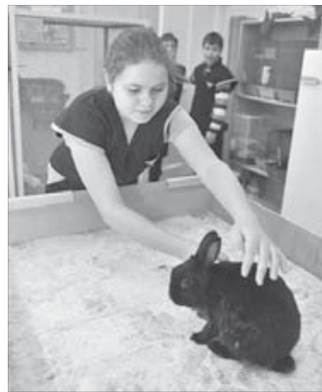
Шустрик – любимец детей