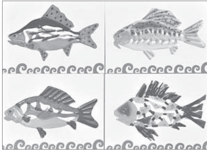
Любовь, богатство, удача, красота – позитивных эмоций хватит на всех

В типографии “Северный формат” началась печать открыток “Рыба счастья”.