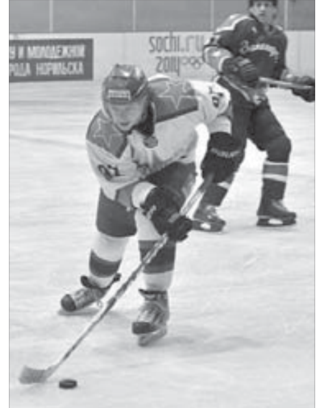
Мастера и в товарищеской встрече выкладываются полностью