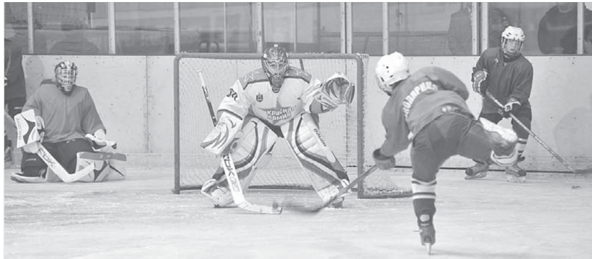
Юным северянам будет чем гордиться: на мастер-классе они забивали голы вратарю ЦСКА!