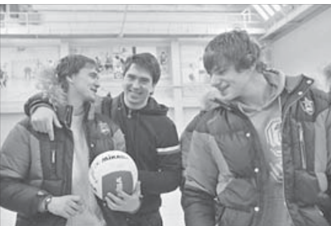
Ожидали увидеть в Норильске холод. А встретили теплый прием

В цеху стоит грохот, из-за которого трудно разобрать слова. Над головами работают краны. Периодически звучит сигнал, похожий на сигнал тревоги. Уже через минуту многие начинают кашлять. И это, пожалуй, одно из самых сильных впечатлений от экскурсии.