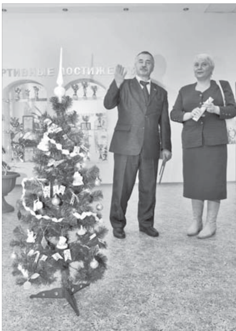
Елка в стиле ретро