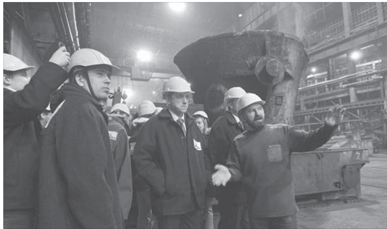
Производство оставило у спортсменов сильные впечатления...