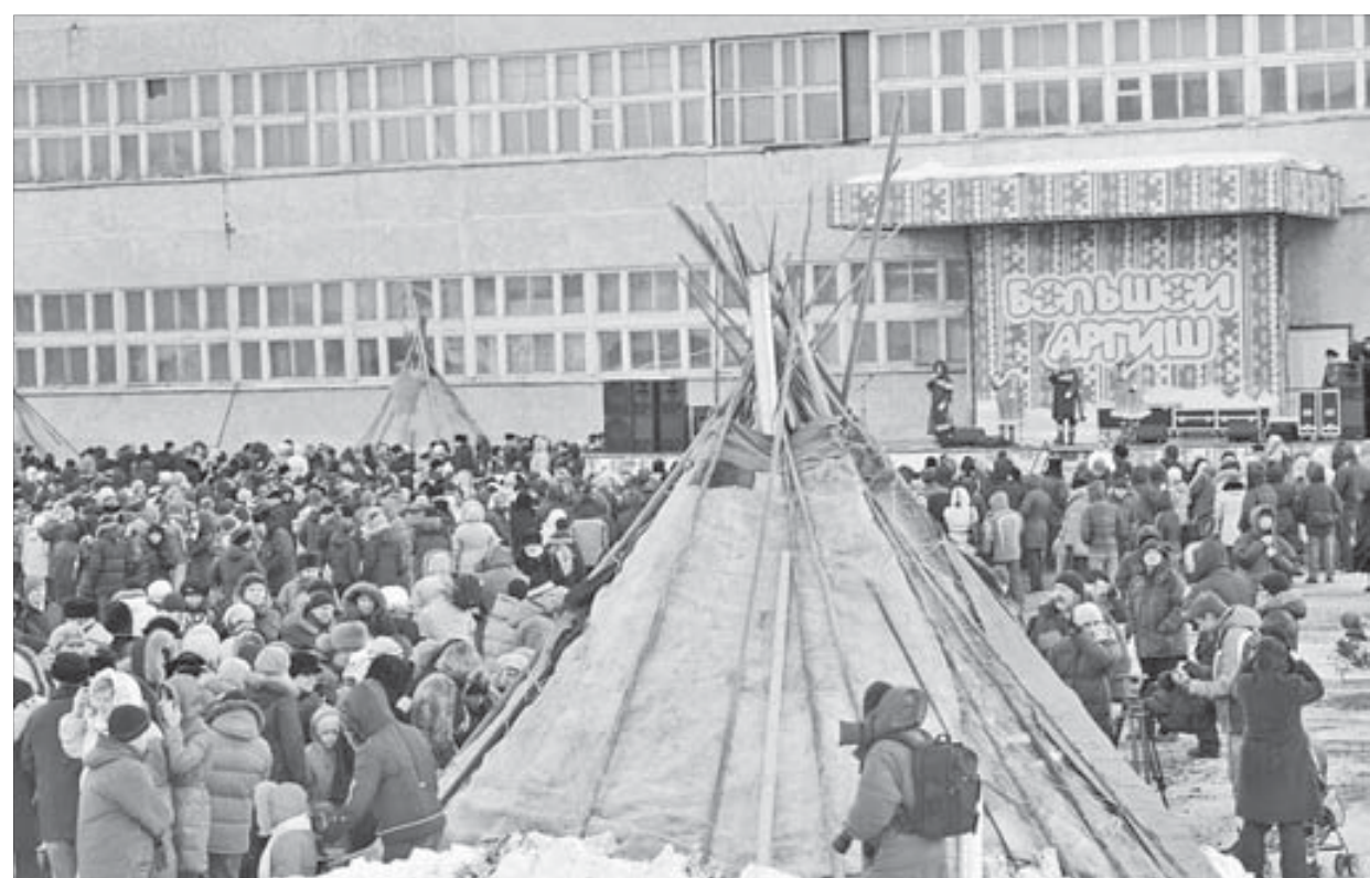
Большой аргиш стал ярким событием для Норильска