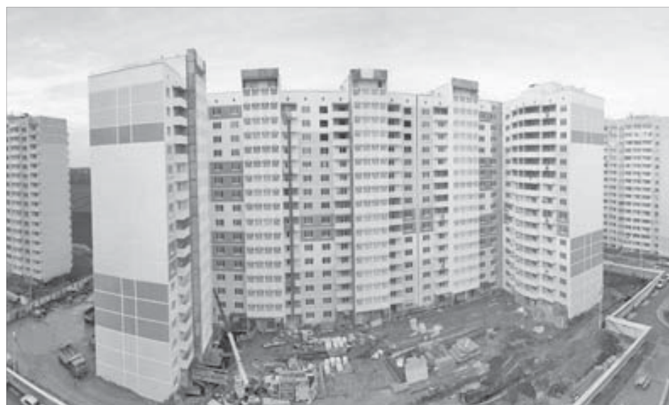
Жилой комплекс “Академический” в Краснодаре