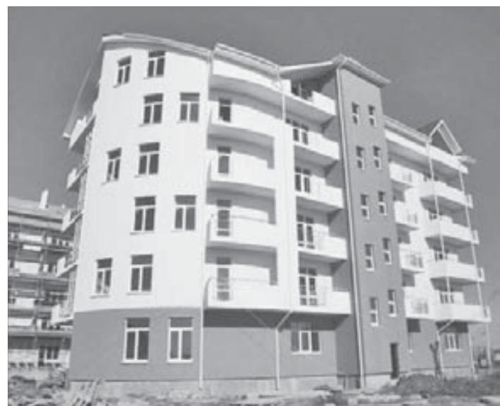
Немецкая деревня ждет норильчан