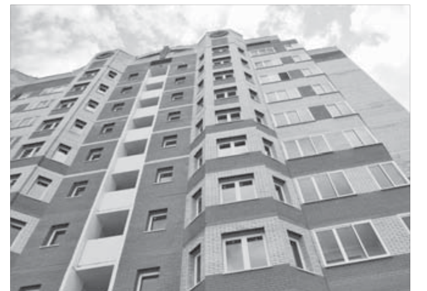
В Ногинске будет много норильчан