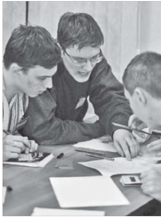
Правильный ответ – здесь

В Норильском индустриальном институте для студентов третьих курсов состоялась третья студенческая олимпиада "Норильск. Экология. Молодежь". Мероприятие было направлено на привлечение молодежи к экологическим проблемам и повышению интереса к окружающей природе.