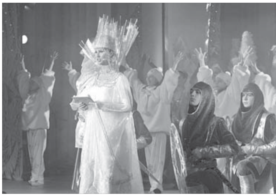
Праздничное шоу поразило небывалым размахом