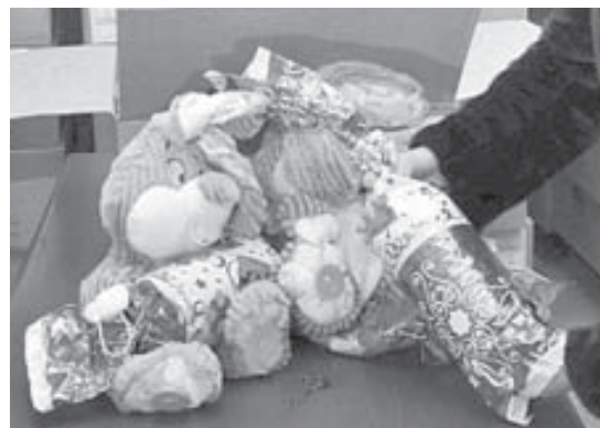
Зайцы нынче в почете