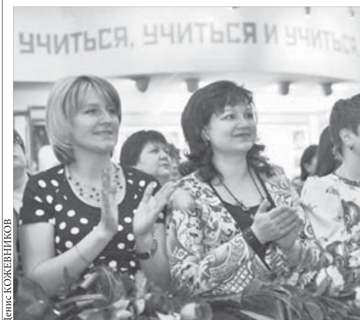
Учить и учиться