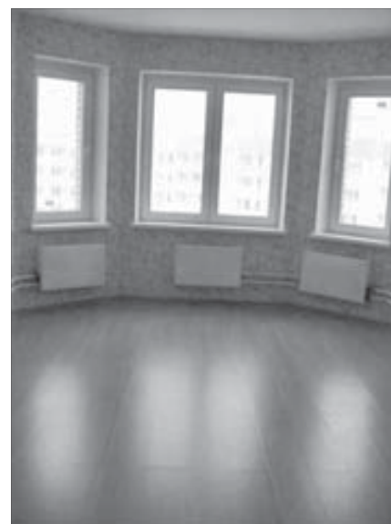
Квартиры просторные и уютные