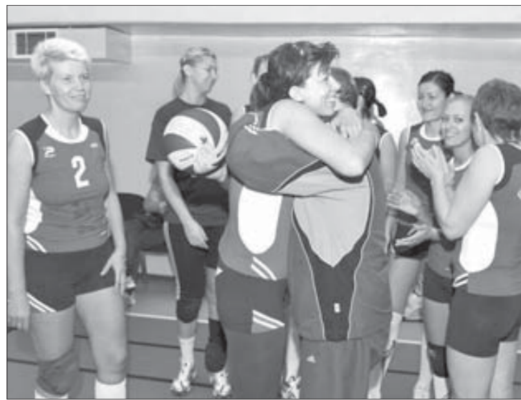
Своим результатом остались довольны