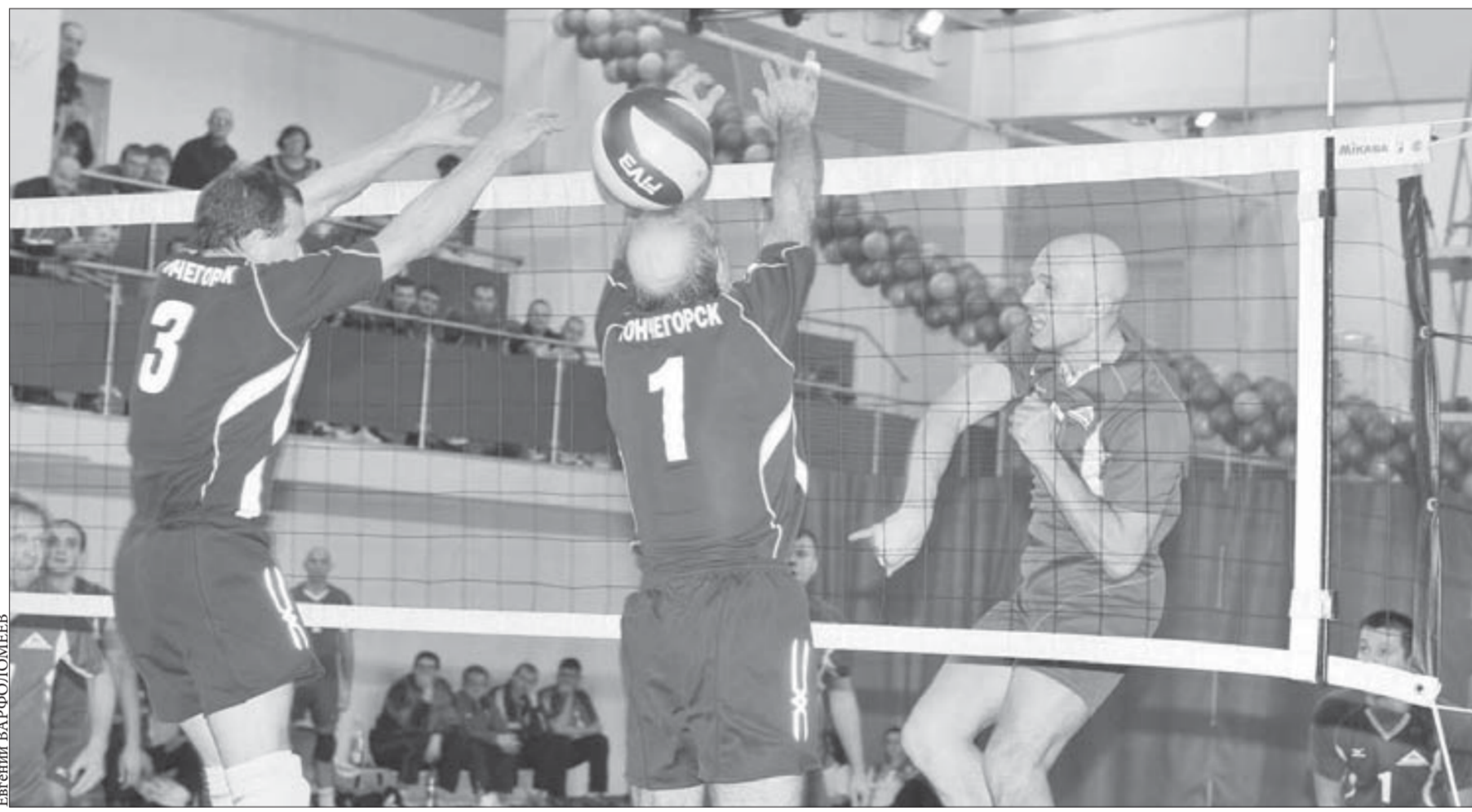
Мужчины выложились по полной