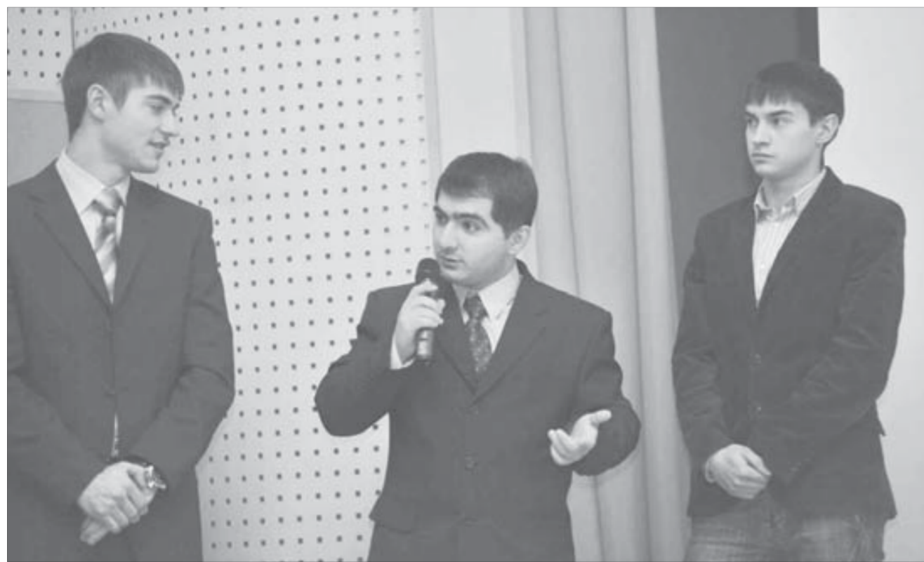
Студенты рассказали не только о производстве, но и об отдыхе и общении