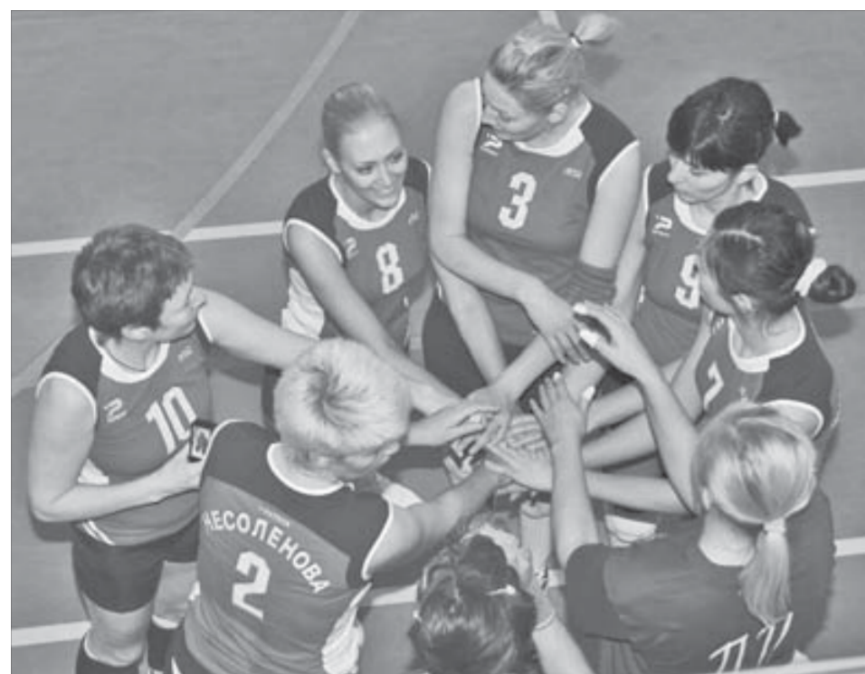
До золота остались считанные минуты