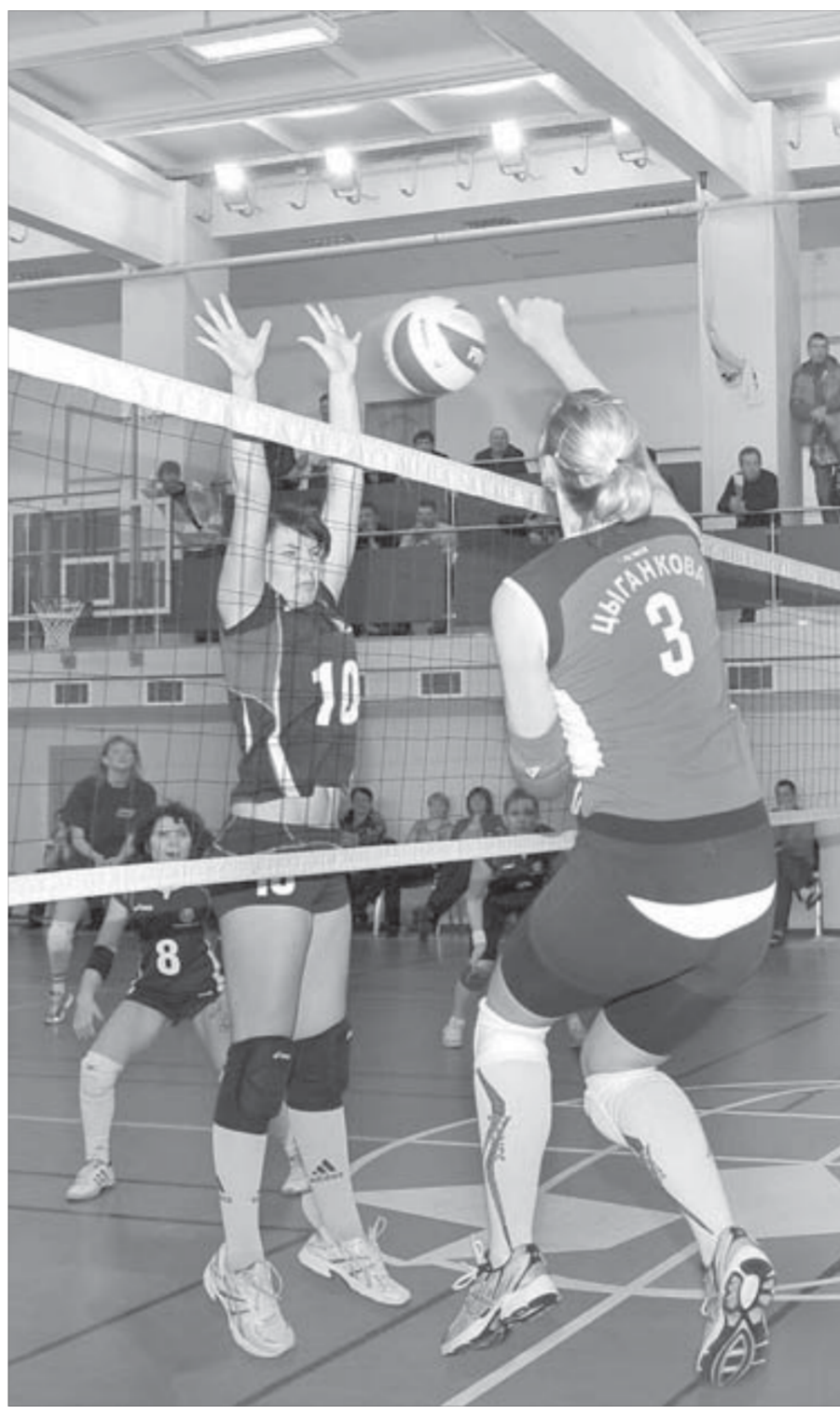
Поберегла бы защита руки