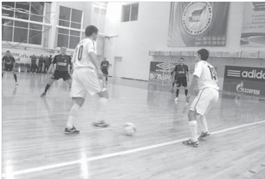
Северяне доказали свое превосходство

И все же северяне смогли доказать свое превосходство. Несмотря на судейскую ошибку. Несмотря на оскорбительные выкрики сыктывкарских болельщиков, когда норильчане повели в счете. На этот главный тренер "Норникеля" отреагировал однозначно: "Оскорблять – это неправильно!.. В Сыктывкаре много ребят, которые нам хорошо знакомы еще по Высшей лиге. Они тогда никак не могли наших обыграть и до сих пор об этом мечтают. Они видят, что с "Никелем" можно играть. Нужно только в ворота попадать. Попали мы!"