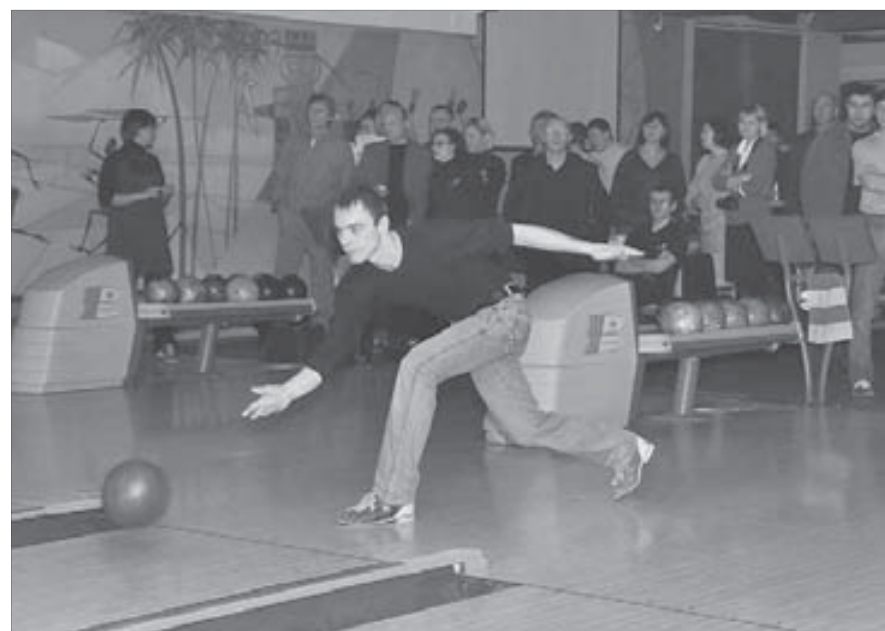
Игроки стали грамотнее

второй подгруппе абсолютный лидер – институт “Тироникель”. Серебро