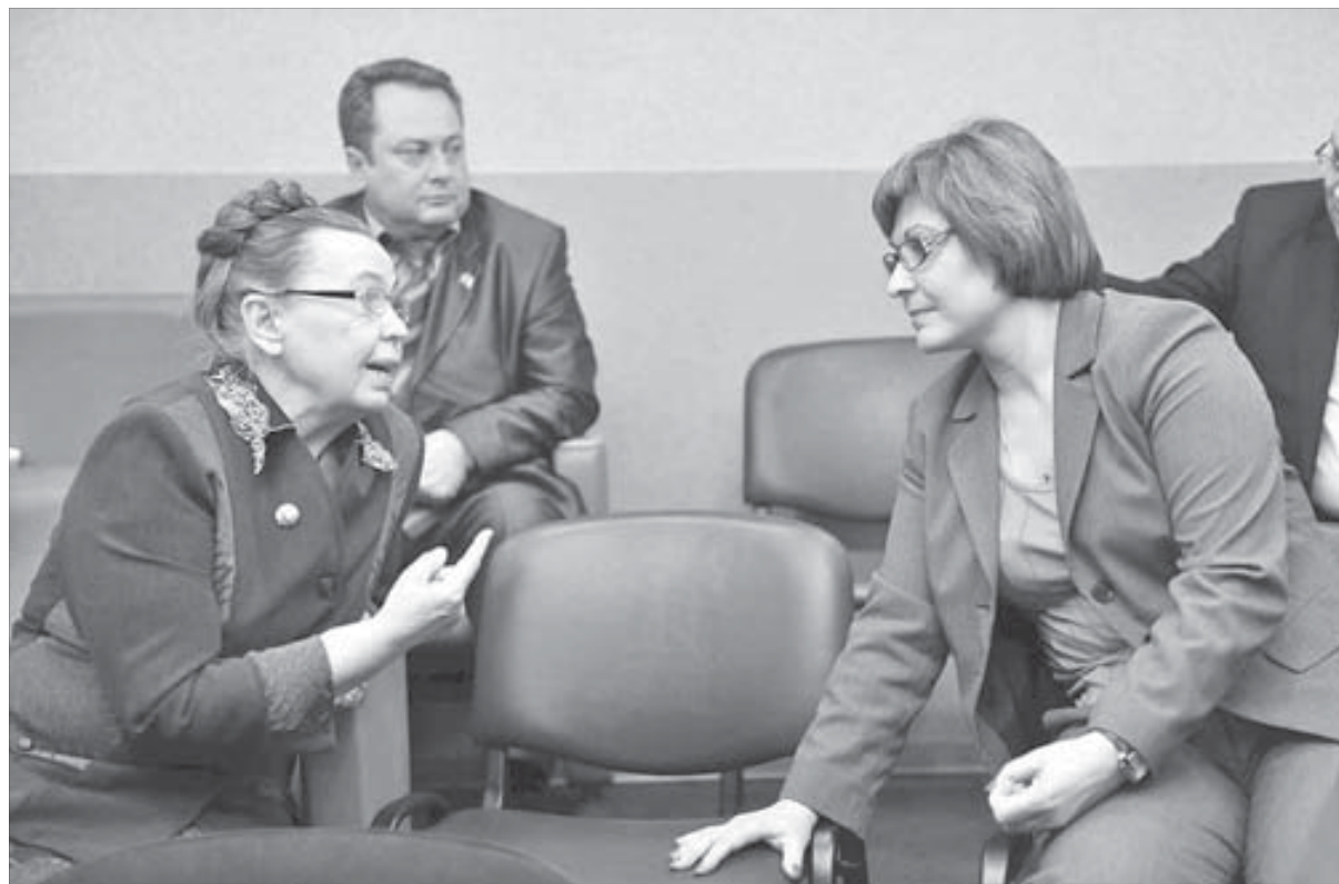
Диалог о бюджете перед началом слушаний