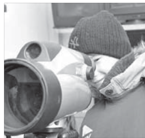
В окуляре гора Отдельная видна во всех деталях

Курс акций ОАО "ГМК "Норильский никель" – 6675 рублей. ОАО "Полюс Золото" – 1793 рубля.