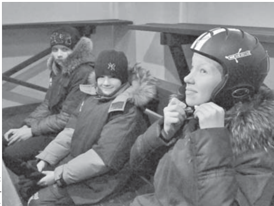
Для горнолыжника безопасность превыше всего

Турбаза “Солнечная” оказалась знакома ребятам не только по рассказам, а вот к горнолыжному комплексу ехали с особым нетерпением. Выяснилось, что никто из школьников ни разу не примерял настоящие горные лыжи и сноуборд.