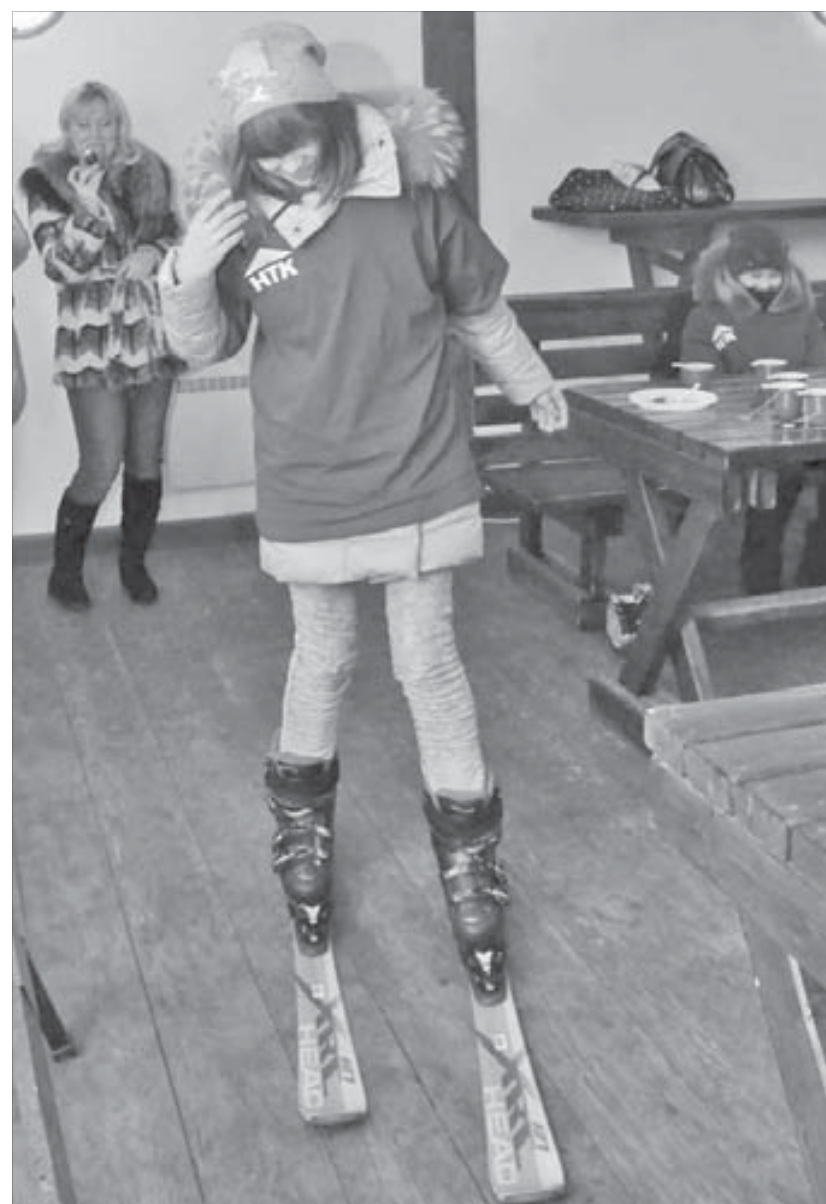
Из-за погоды на лыжи встали только в помещении