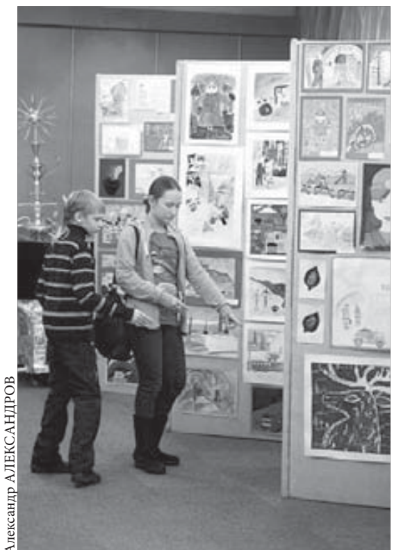
Из 550 работ выбрать лучшие было непросто

В итоге в общекорпоративном этапе конкурса примут участие 28 детей. Их работы отправят в Москву, где и определят победителей. Их имена назовут в конце января.