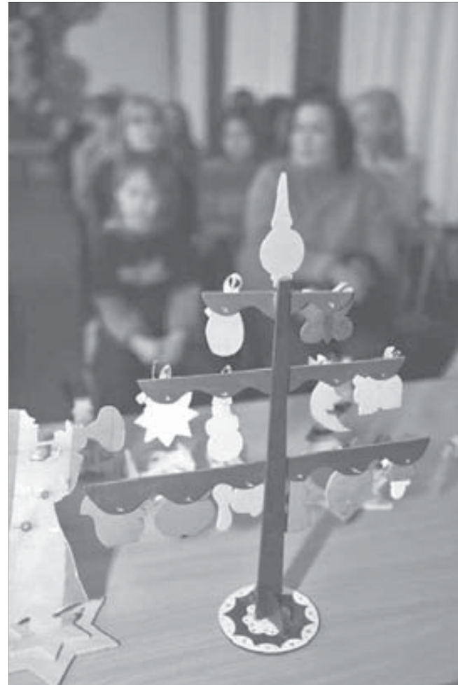
Елка из палки