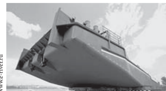
Спуск на воду баржи “БП-2002” проекта 82260