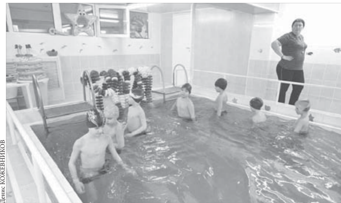
В детском саду ребенка всесторонне развивают