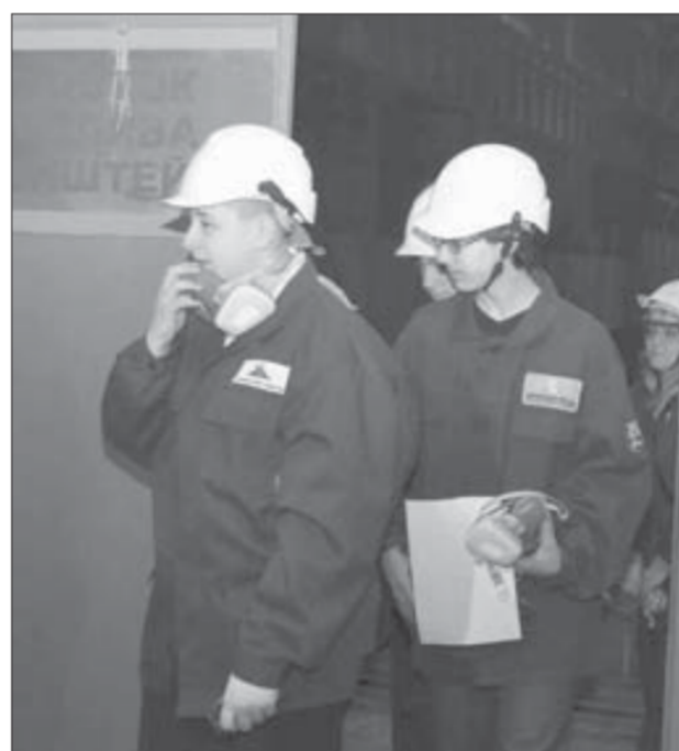
Пригодились и средства защиты