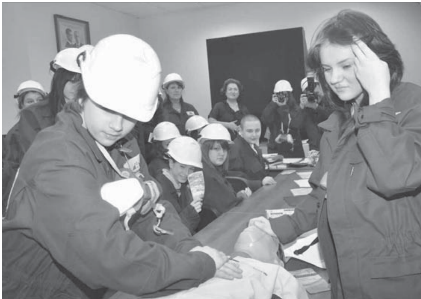
Привести тренажер в чувство удалось не сразу