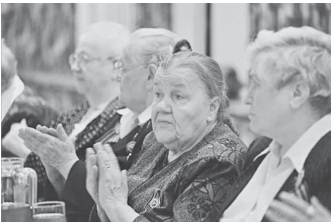
Этих людей многое связывает

Давность срока не имеет значения, автор письма должна посетить врача первый год один раз в месяц, второй – один раз в два месяца, третий – на усмотрение врача: один раз в три-четыре месяца или раз в полгода. Если через три года регулярного наблюдения врач даст заключение “здоровая”, снятие с учета (бесплатное) гарантировано.