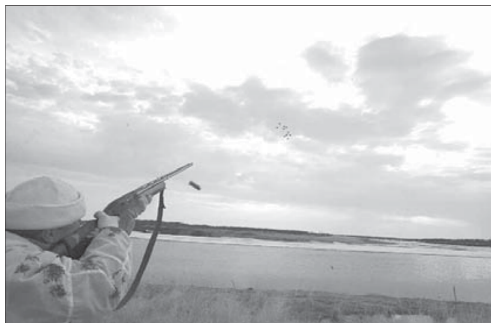
Полярная ночь укоротит сезон охоты