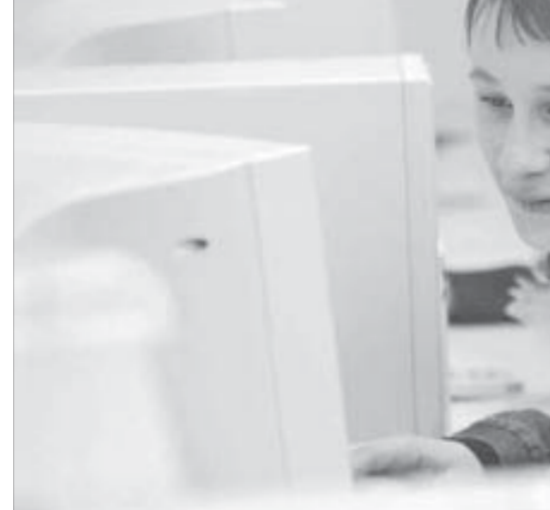
Модульная школа помогает найти ответы на интересные вопросы

Таким образом участников олимпиады подготовили к заданиям первого модуля, выявляющего уровень общих теоретических знаний. Второй модуль включал решение творческих заданий по биологии и ТРИЗ. Освоение этого алгоритма способствует развитию у учащихся нестандартного мышления и формированию ряда ключевых компетенций, что, несомненно, отвечает реалиям времени. Подготовка такого рода заданий была запланирована в работе шестой секции для учащихся всех возрастных категорий.