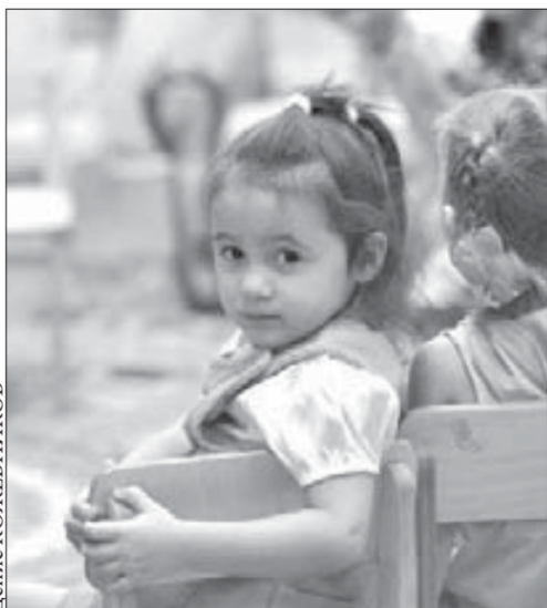
Работу властей оценивают дети

Сегодня трудно поверить, но в 1989 году в Норильске работал 101 детский сад, который посещали 28 642 ребенка (сегодня списочный состав детей в садах составляет 8269 малышей). В 90-е годы большая часть этих учреждений по разным причинам оказалась закрыта. Действующими оставались только 30 детских садов. В 2002-м ситуация начала меняться. Именно тогда впервые в Норильске приступили к реконструкции дошкольных учреждений. И сегодня в районах Норильска работает уже 39 садов, а кроме того, появилось еще пять групп дошкольного образования (на базе СОШ №24) в Снежногорске. Тем не менее проблема с устройством ребенка в детский сад по-прежнему остается актуальной.