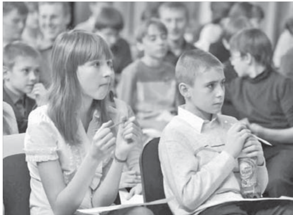
Ребята узнали много любопытного о документальном кино