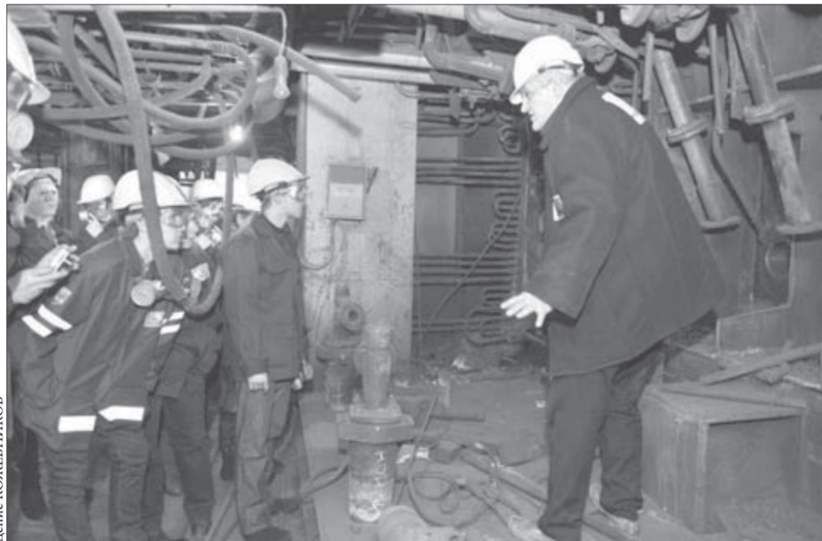
Футеровочный пояс и система охлаждения – основные объекты внимания

Студенты Норильского индустриального института посетили плавильный цех медного завода, где идет плановый ремонт печи Ванюкова ПВ-3. Возможность заглянуть в остывшее сердце металлургического предприятия выпадает нечасто.