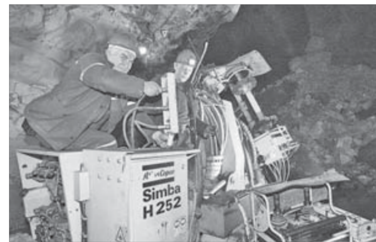
ГКМ увеличивает добычу руды

В следующем году ГКМ планирует ввести в эксплуатацию еще несколько рудоспусков на Центральном и Восточном участках подземного рудника.