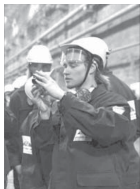
Увиденное стараются запечатлеть