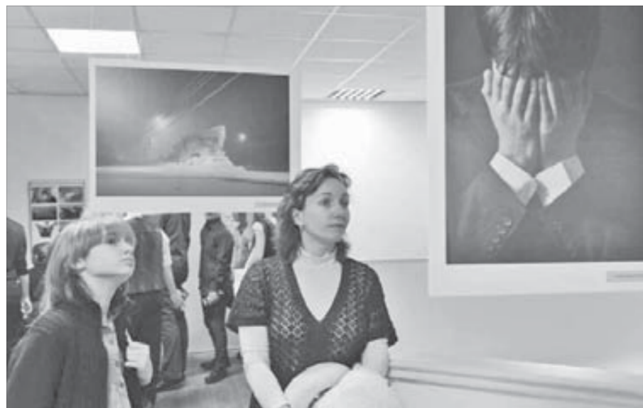
Фото, мысли, эмоции...

После незапланированного перерыва проявил себя в реальности проект “Полярная перспектива”. В этот раз в Музее истории освоения и развития НПП состоялось финальное действие конкурса – фотовыставка.