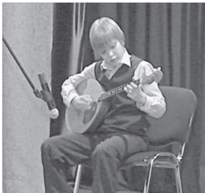
Незабываемые звуки думы

— Замечательный вечер, подаривший позитивное настроение, — говорит она о "Минуте славы". — Приятно видеть учеников в новом качестве, узнавать заново. И радостно за каждого, кто сумел познать минуту славы.