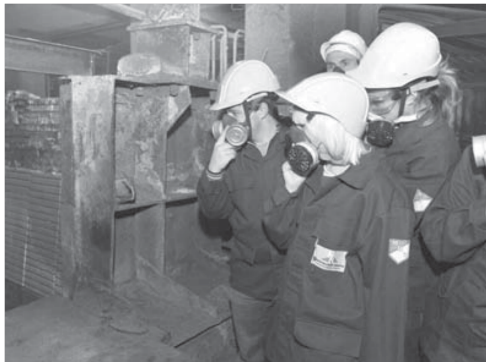
Объем ванны печи поразил студентов

точно трудоемкий процесс – сам запуск печи. Около трех дней уходит на то, чтобы привести ее в стандартный рабочий режим.