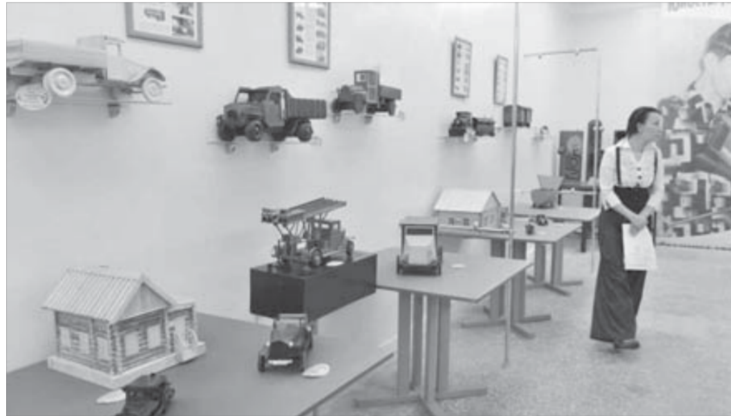
За день до открытия

Напомним, что 1 сентября этого года станция юных техников вместе с Заполярным филиалом приступили к реализации проекта “Юность. Техника. Творчество”, направленного