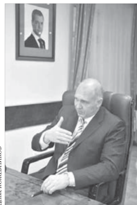
За помощь спасибо «Норильскому никелю»