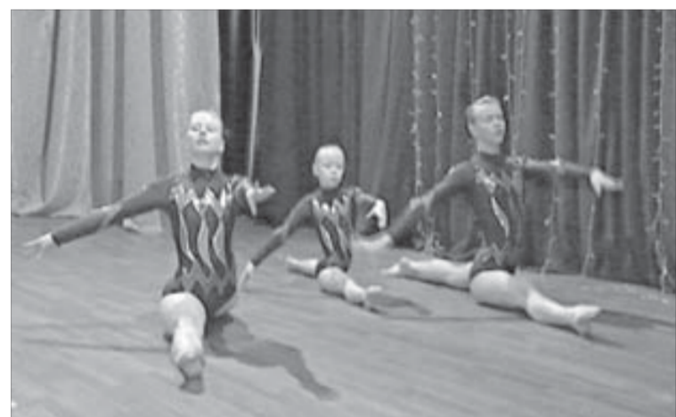
Спортивные успехи лицеи

Как только стало известно о проведении этого конкурса, ребята ринулись заполнять заявки на участие. Актив школы "Максимум" решил, что номинаций в "Минуте..." должно быть много. Ведь талантов в школьной среде хоть отбавляй. Почему бы не дать возможность раскрыться и тем ребятам, которые увлекаются игрой на музыкальных инструментах, и тем, кто предпочитает литературное чтение, и нашедшим себя в хореографии или вокале, спорте или изобразительно-прикладном искусстве? Активисты придумали и уникальную номинацию — монтажное искусство. В ней вне формата каждый мог проявить себя. Простора для творчества хватало.