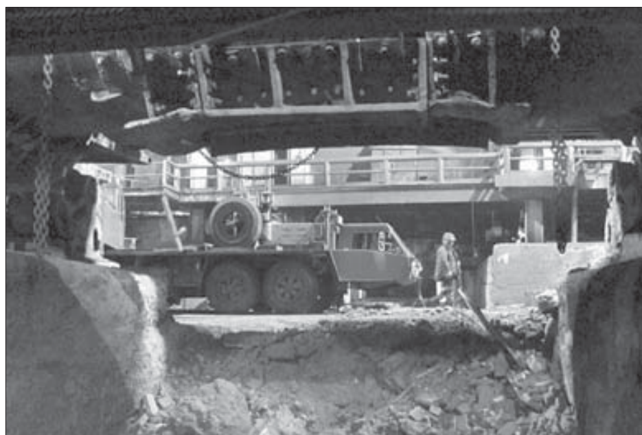
Краны "Като" в плавильном цехе увидишь не часто