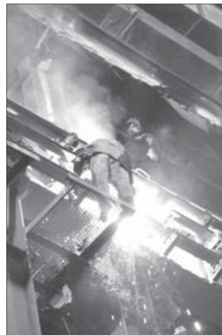
Работы ведутся на высоте многоэтажного дома

Сегодня плановый ремонт в плавильном цехе медного завода должен быть завершен.