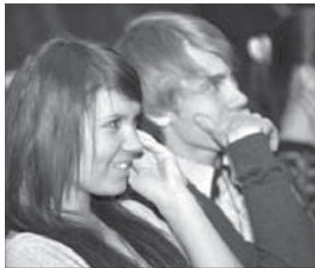
Эмоции видны на лицах

В номинации "Лучший мультипликационный фильм" бесспорным лидером стала "Бочка с красотой" детской киностудии "Поиск" (Новосибирск). Сюжет, который придумали и нарисовали дети в возрасте от трех до восьми лет, незамысловат, но сколько экспрессии! Члены жюри никак не могут забыть страшный глазастый лес, лошадь, которая не умела ни стирать ни готовить, да и самого обаяшку Ка-