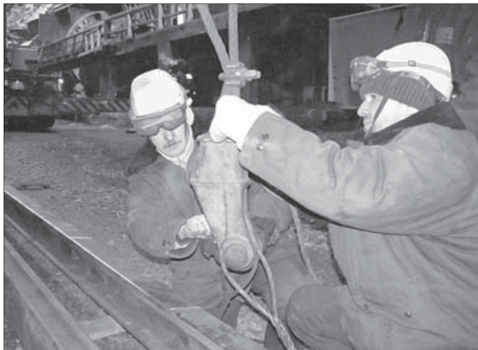
У электросварщиков есть и смежная профессия – стропальщик