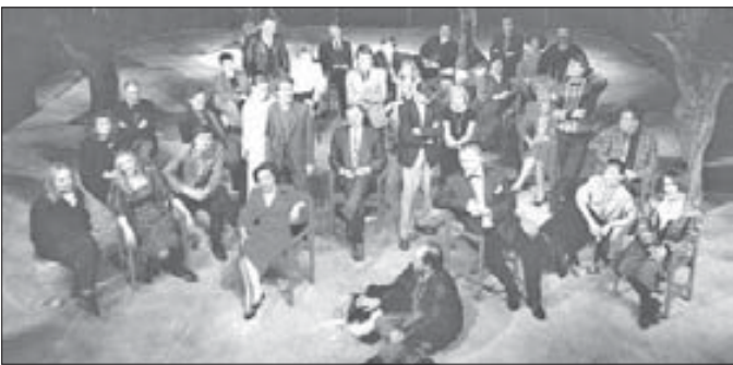
Юбилейный снимок труппы-1991

3 ноября 1991 года на Ленинском, 34, прошел торжественный вечер, посвященный полувековому юбилею самого северного в мире театра.