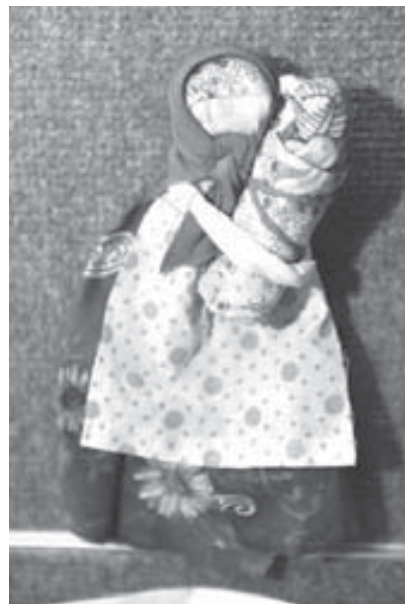
Не зря в программе был мастер-класс по оберегам

последнее мероприятие из большой программы проекта «Приободришься и женишься». В ближайшее воскресенье в «АРТе» состоится его заключительная часть – вечер, на котором будут отмечены все участники, а победители выставки получат сертификаты на приобретение подарков от магазина «Северок».