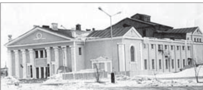
Здание театра на Севастопольской не сохранилось, как и первое, на Нулевом пикете