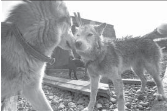
Собака – друг человека?