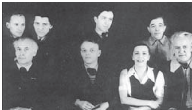
Первый директор театра (в центре) был еще и актером, и режиссером, и даже бухгалтером