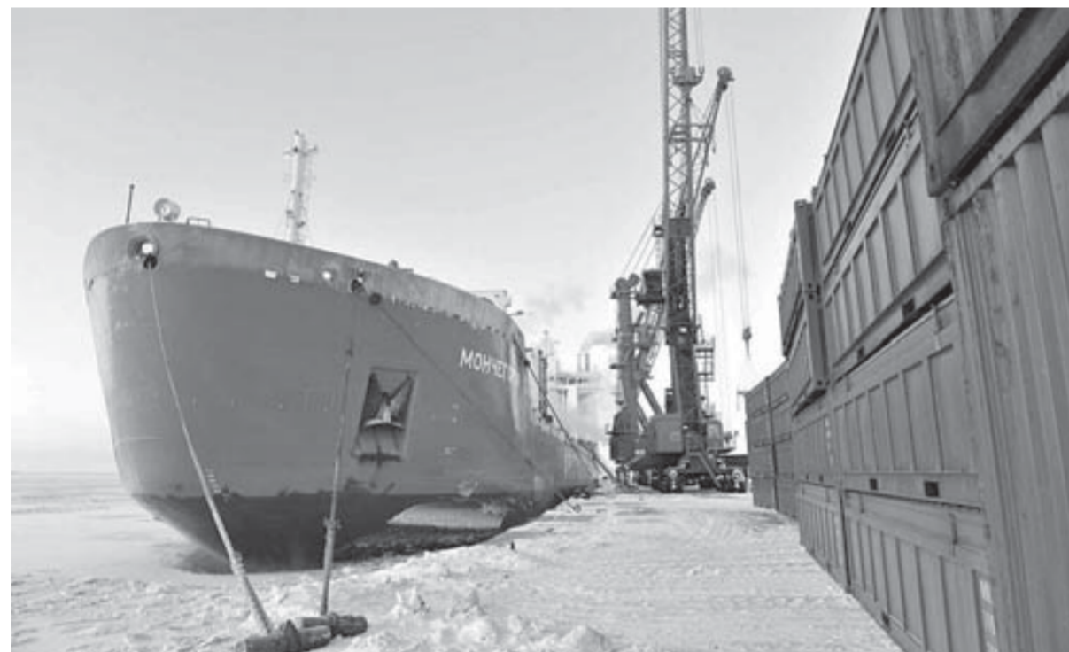
Первопроходец у причала Дудинского морского порта

Корреспонденты “ЗВ” побывали на борту дизель-электрохода “Мончегорск”, совершившего первый трансарктический переход по Севморпути в страны Юго-Восточной Азии.