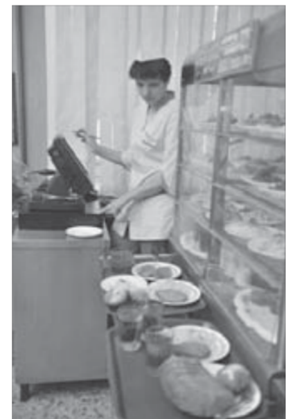
На кассе есть терминал для карточек