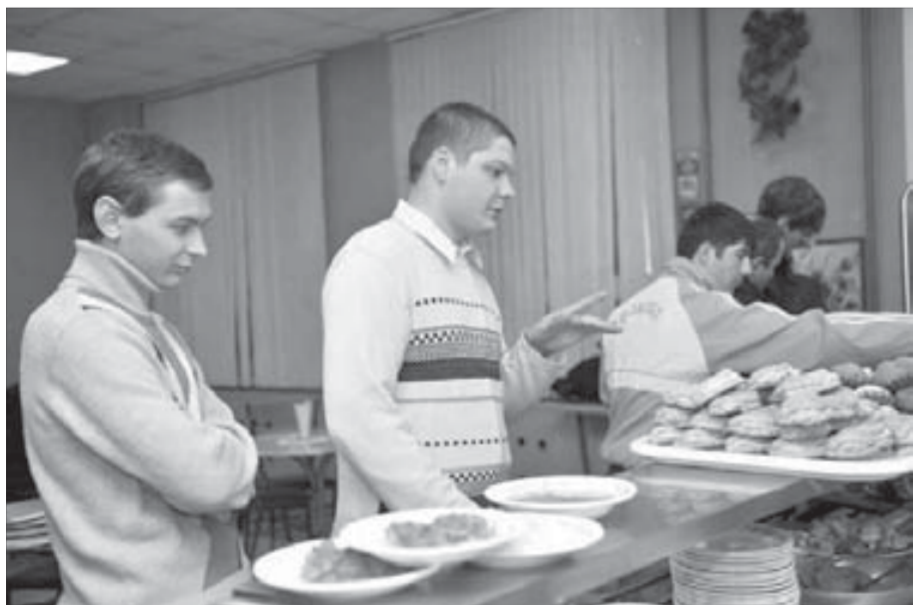
Наибольшим спросом пользуется выпечка