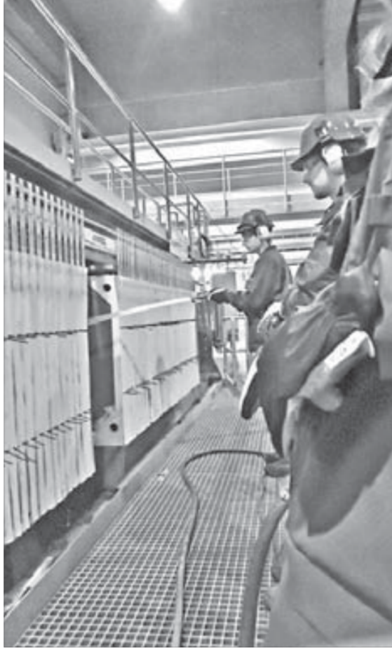
Цех выщелачивания по-фински

– Мы не только работали и учились, мы имели возможность и прекрасно отдыхать. В выходные мы могли побродить по городку, искупаться в реке,