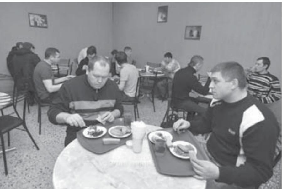
Обед или ужин здесь обходится в среднем в 150 рублей