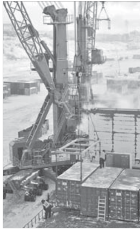
До 20 ноября будут идти погрузо-разгрузочные работы