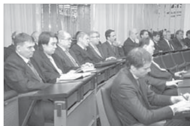
В Норильске тема интересна многим

Вчера руководители Российского энергетического агентства (РЭА) Минэнерго России обсудили с представителями города и Заполярного филиала вопросы энергосбережения.