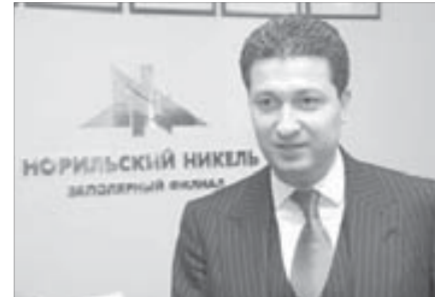
Тимур Иванов: “Мы разработаем комплексную программу по энергосбережению”

– На встрече мы обсудили основные приоритеты государственной политики в области совершенствования энергопотребления, – говорит генеральный