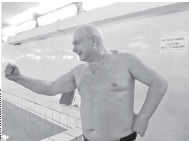
P. S. До серьезного выяснения отношений дело не дошло