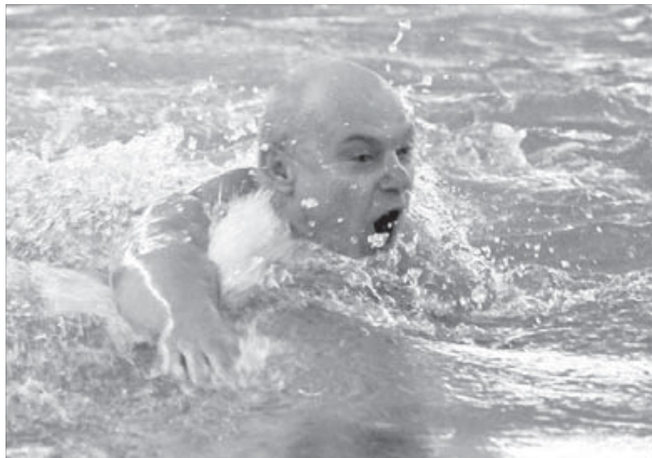
...а мы подрежем