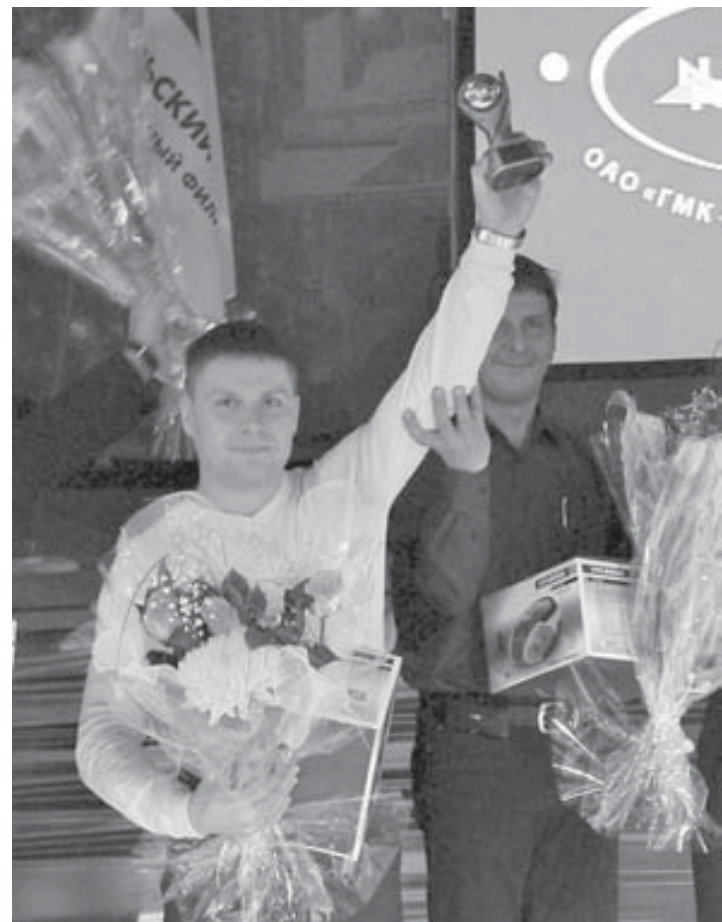
Приятный миг победы