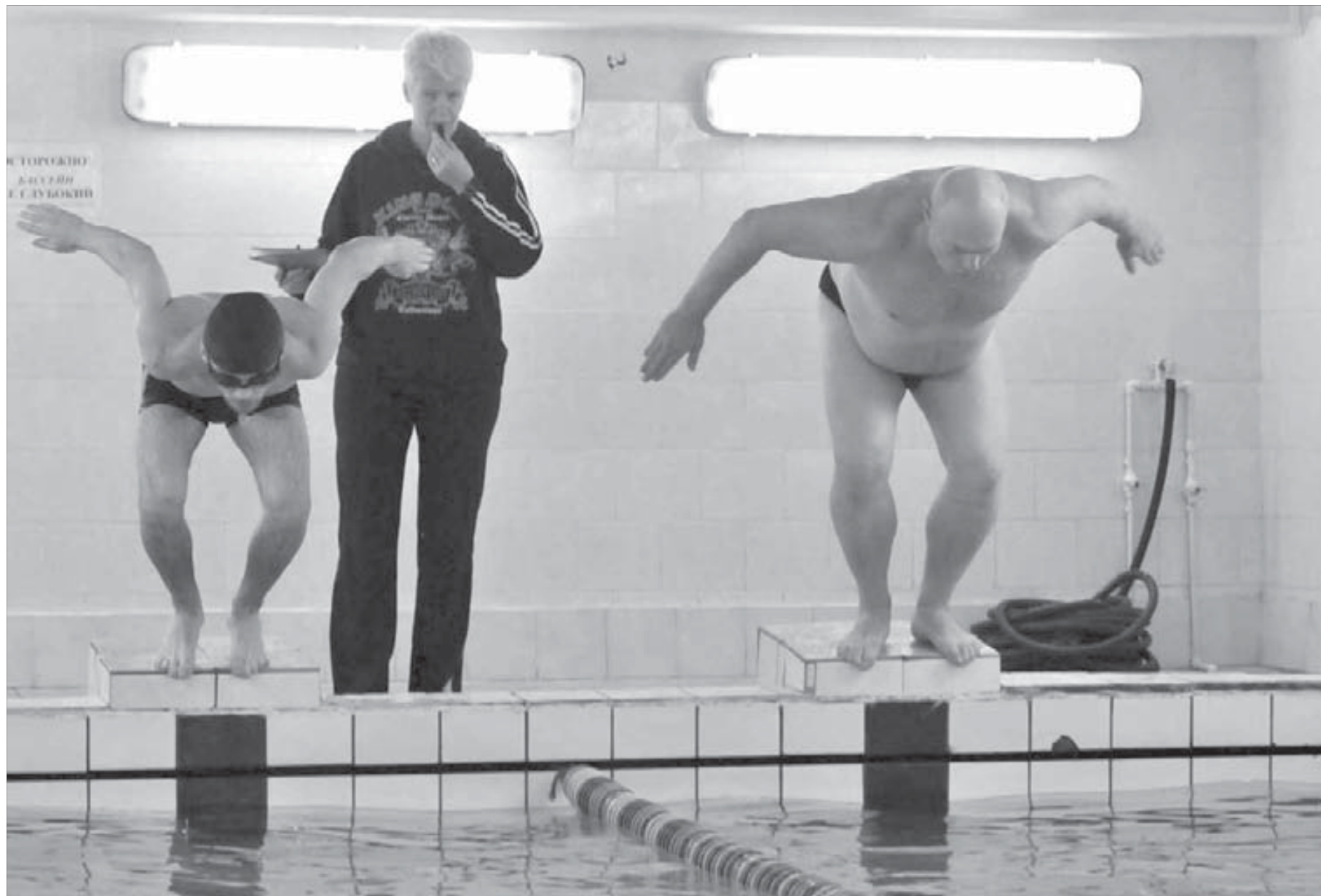
Мысли уже у финиша...

В субботу стартовала XXII городская спартакиада среди лиц с ограниченными возможностями, посвященная Международному дню инвалидов. В программе спартакиады, которая продлится до 28 ноября, состязания по семи видам спорта: легкая атлетика, боулинг, дартс, пулевая стрельба, настольный теннис, плавание, волейбол сидя.