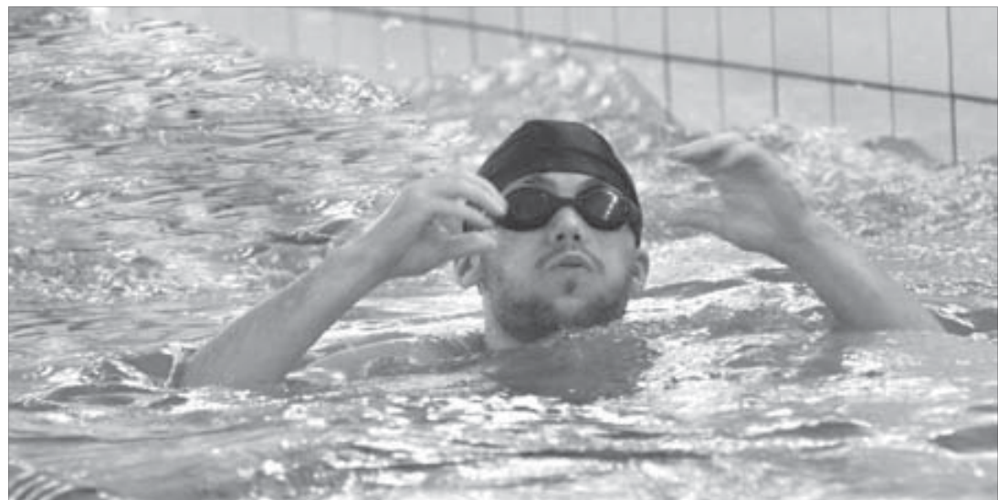
После заплыва дышит с удовольствием