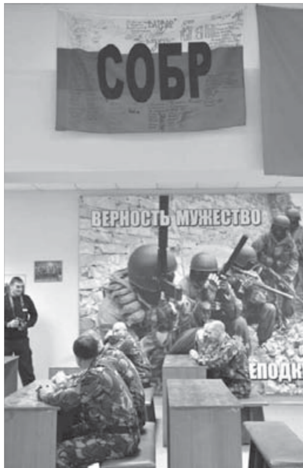
Герои всегда за кадром