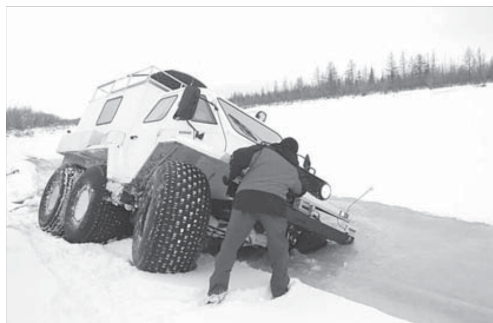
Ноябрь 2010. Провалиться в промоину может даже такая техника

Судно ледового класса Arc-7 разработано в соответствии с климатическими условиями для эксплуатации при температуре до минус 50 градусов. Сдача танкера типа Nordic AT-19 заказчику запланирована на конец сентября 2011 года.