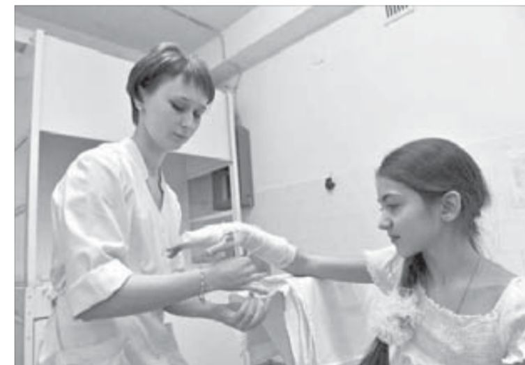
Гололед и его последствия