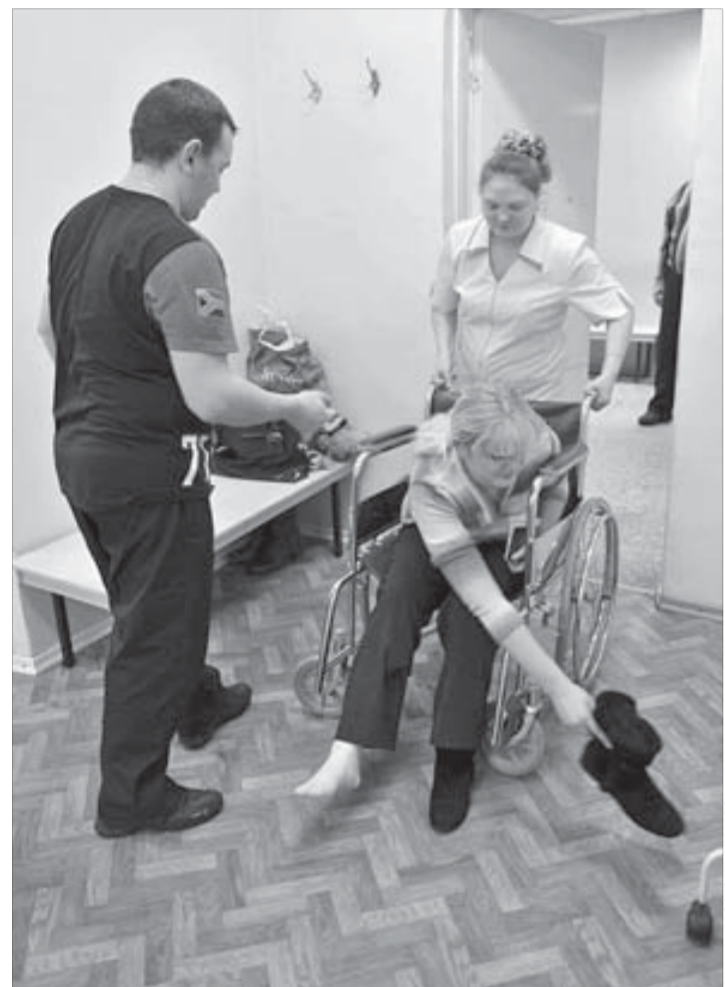
Пришлось “вызывать” кресло-каталку