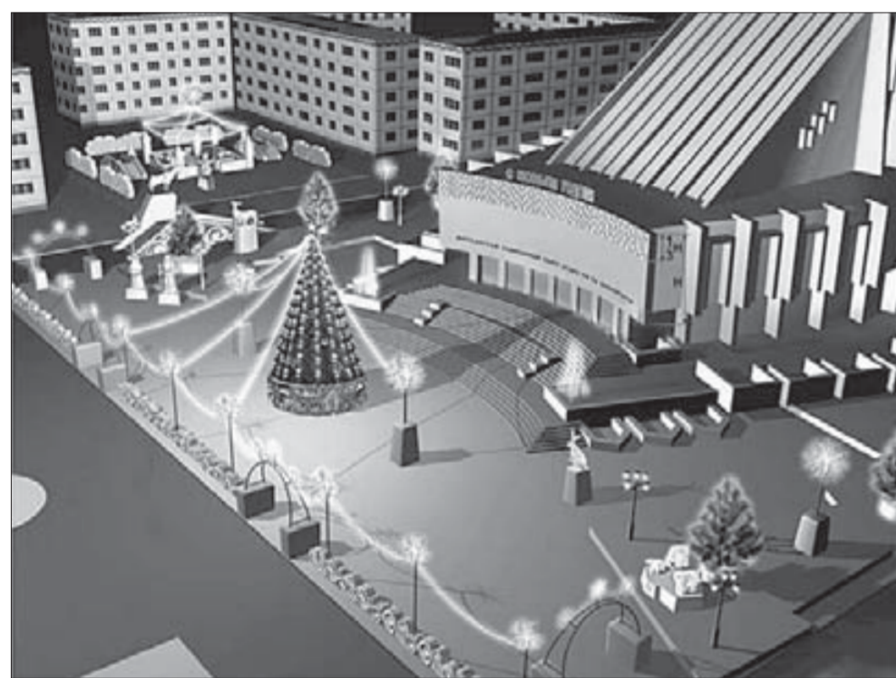
Эскиз центрального новогоднего городка