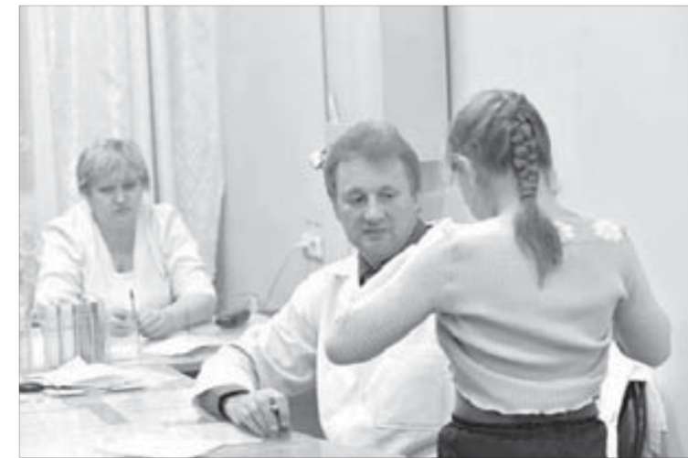
Ушиба, к счастью, нет