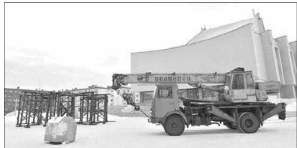
К 22 декабря Театральная площадь преобразится

Открытие центральной елки намечено на 22 декабря.