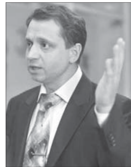
“Наша задача – соединить две стороны для их дальнейшего сотрудничества”