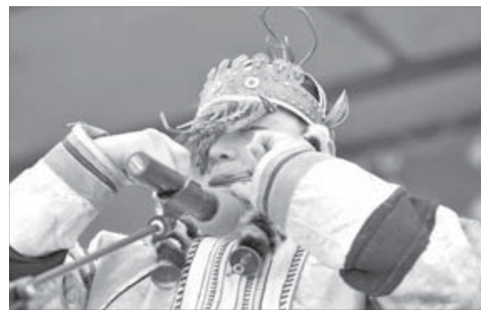
Знатки говорят, что самый хороший звук издает барган, сделанный из серебра или бронзы