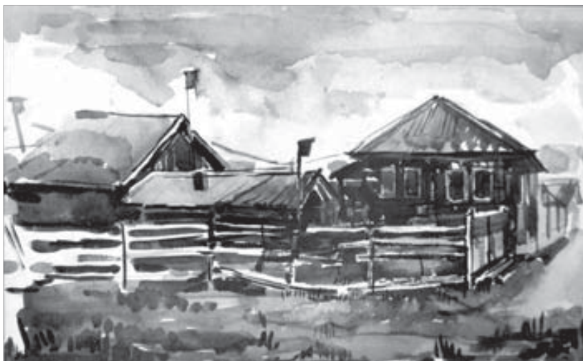
Шушенское (и в Шушенском) хорошо пишется