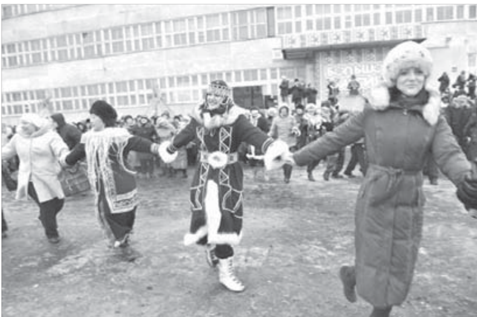
Общий хоровод под музыку хэйро