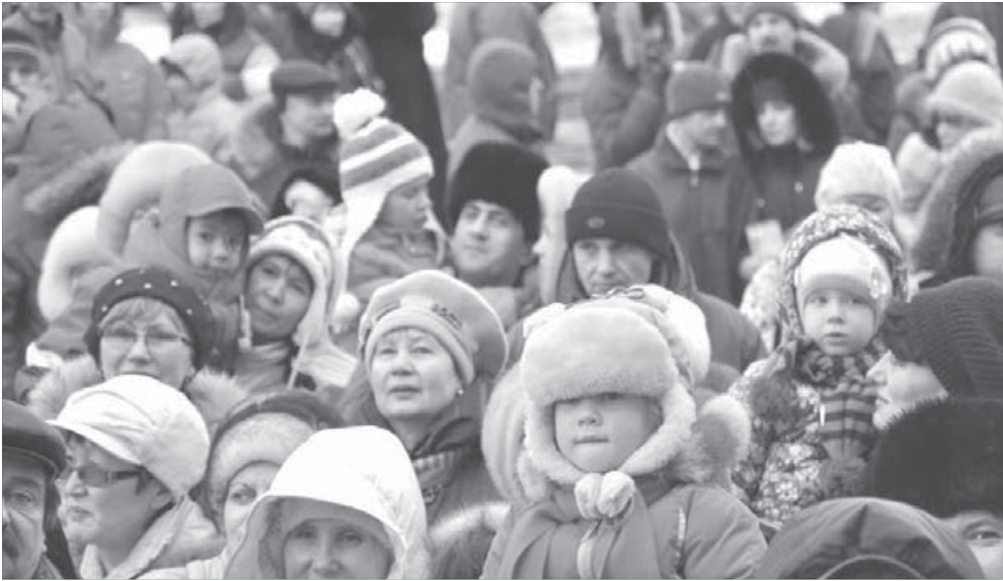
На Большой артиш пришли целыми семьями