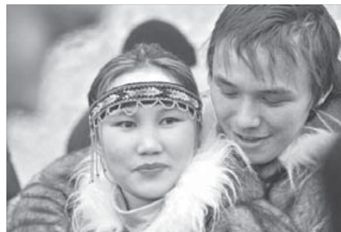
В творческих коллективах коренных народов много молодежи