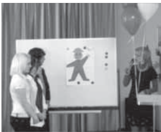
Так выглядит портрет "идеального работника"

Задания были разными: сначала соискателям на звание лучшего будущего профессионала нужно было представить себя в самом выгодном свете. Затем приемная комиссия проверила ребят на готовность к профессиональной деятельности – бригадам нужно было вычеркнуть не соответствующие какой-либо профессии термины. Члены комиссии также проверяли участников на внимательность и находчивость.