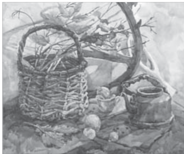
Северянке не обойтись без "Дыхания Севера"