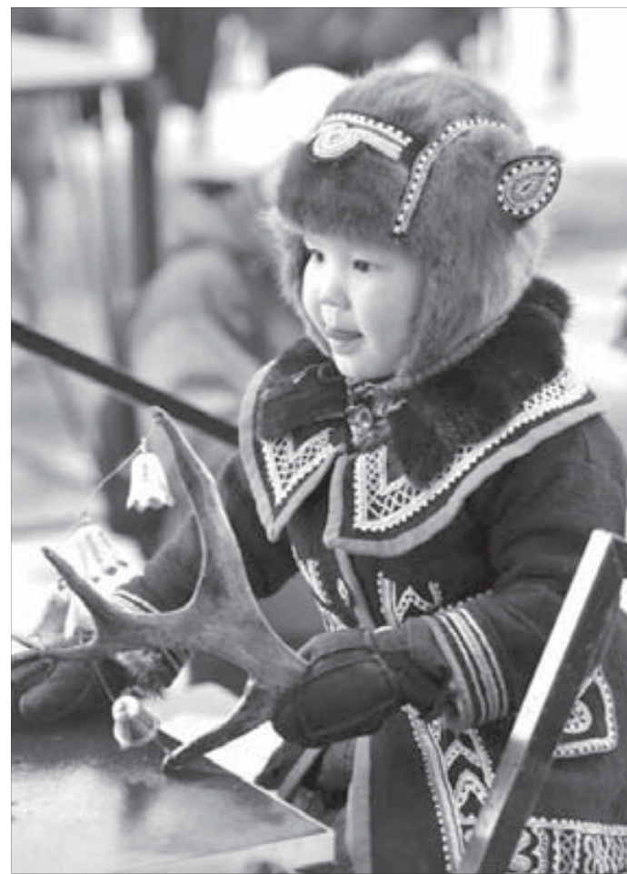
Таймырские женщины умеют вышивать на одежде идеально симметричный орнамент без трафаретов и линейки