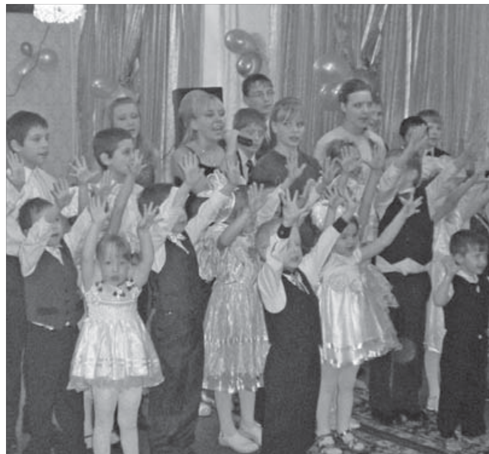
Юбилей детского дома — праздник каждого воспитанника

Ежедневно ребята окружены большим вниманием и любовью. Норильский детский дом признан лучшим в Красноярском крае.