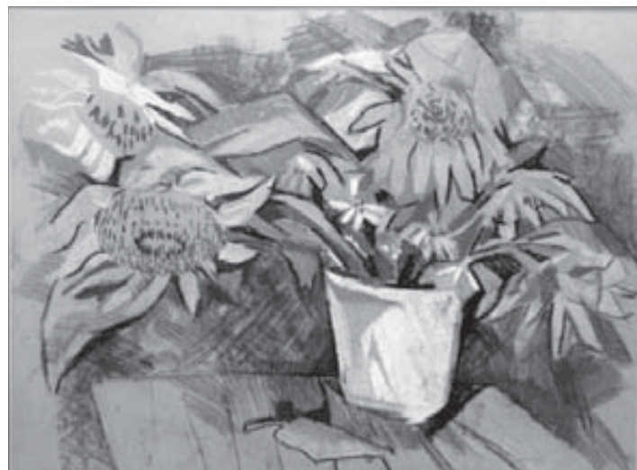
Солнечные цветы любил не только Ван Гог