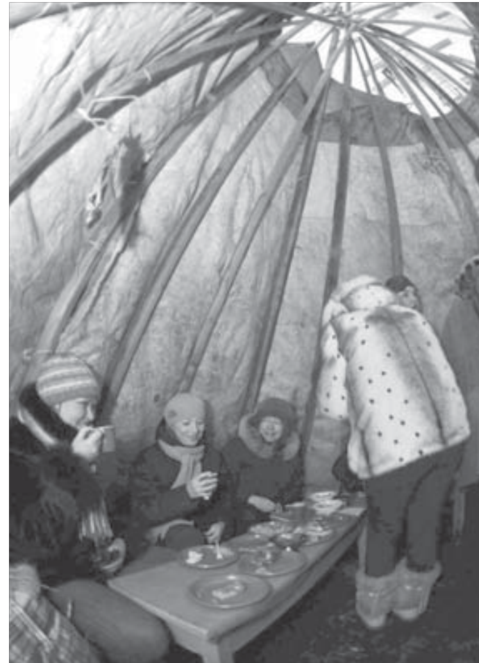
В одном из чумов