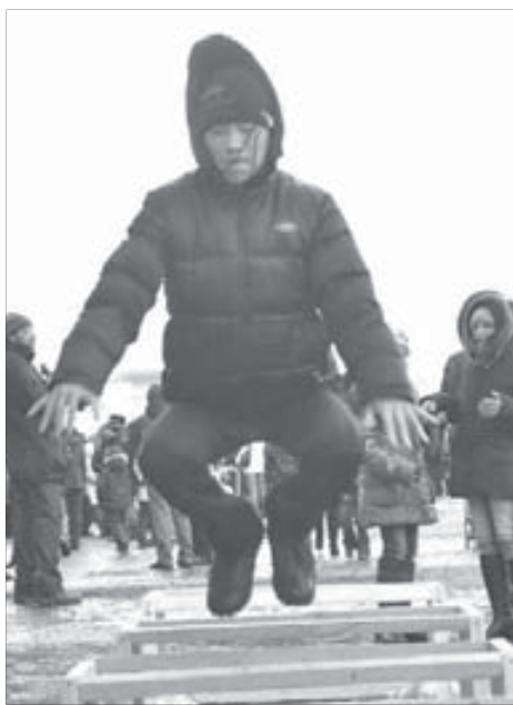
Популярность в прыжках через нарты мог любой желающий