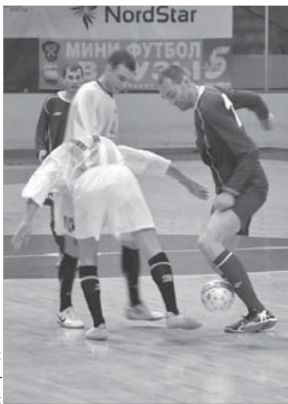
Борьба на каждом участке площадки