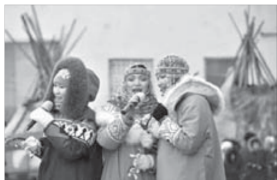
Вокальный коллектив "Сулускан"