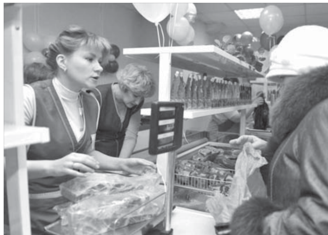
"А может еще и этот кусочек мяса?"