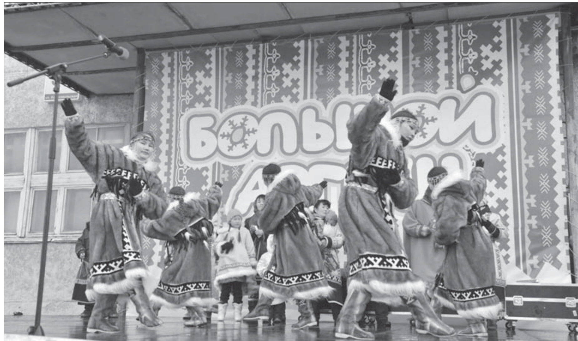
Каждый национальный танец норильчане провожали аплодисментами