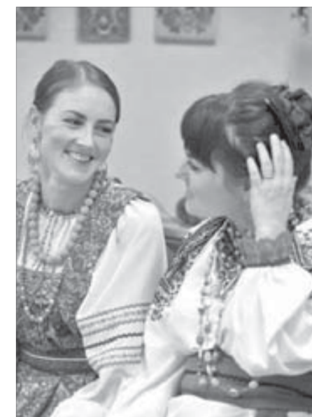
Колыбельные исполняли девицы-красавицы — студентки НКИ

Хозяйка горницы, в которой проходило занятие, предложила всем родителям купить учебники “Устное народное творчество” с