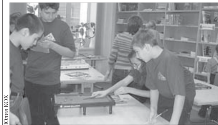
Настольные игры порадовали ребят