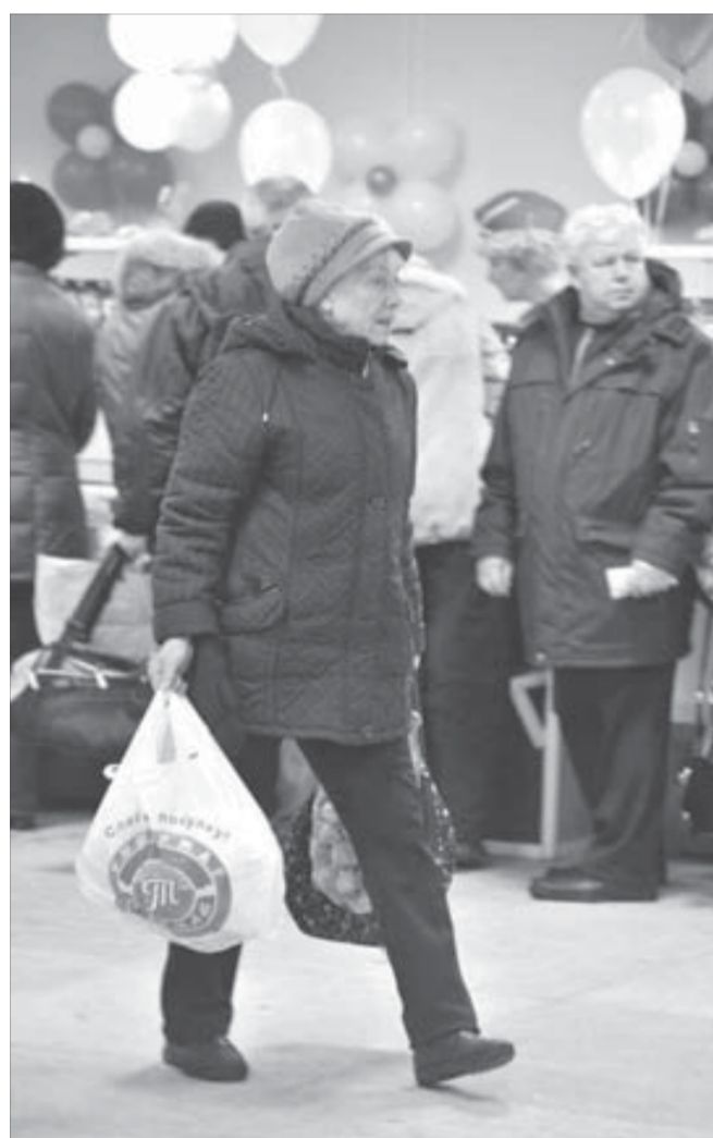
Без покупки никто не ушел