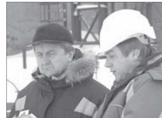
В “Гору” идут серьезные инвестиции