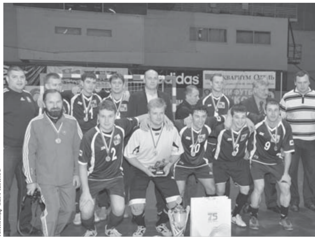
Победители корпоративного турнира – игроки медного