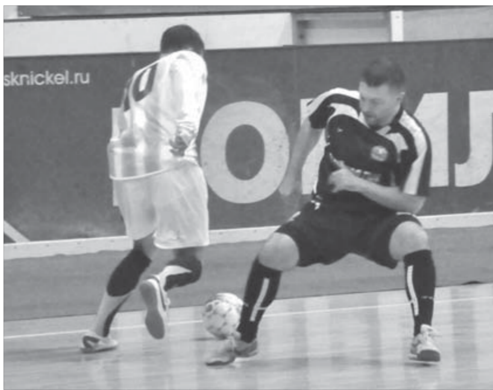
Гостям с КГМК (в темной форме) чуть-чуть не хватило для победы

Но определиться с выбором необходимо еще в сентябре. Как отметили в городском управлении общего и дошкольного образования, предпочтение учащихся в выборе одного из шести существующих модулей курса в 2011 году, скорее всего, не изменится. Большинство норийских школьников и их родителей выбрали основы мировых религиозных культур.