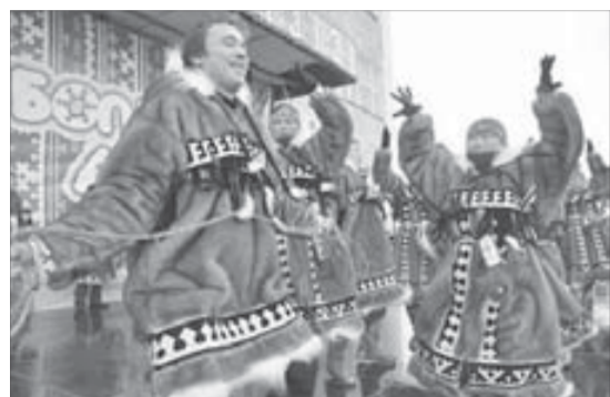
Детский хореографический ансамбль "Таймыр"