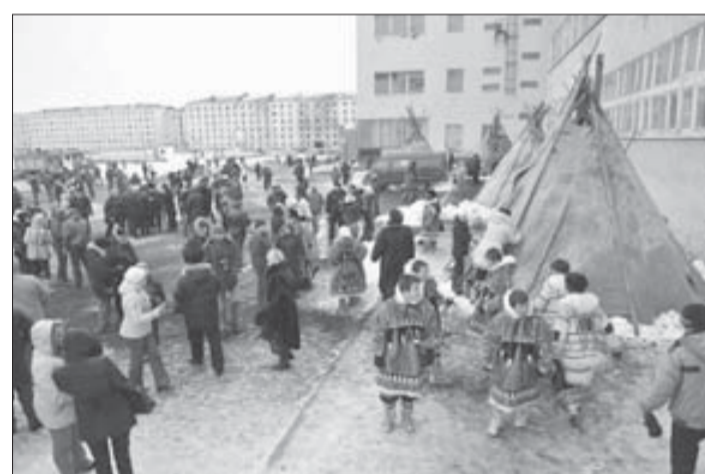
Площадь Северного города притягивала и удивляла