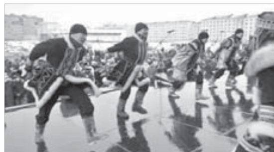
Ансамбль песни и танца народов Севера "Хэйро"