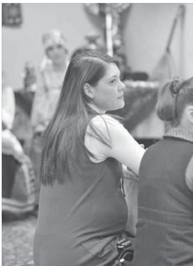
Эмоции — только положительные

В колледже искусств прошел мастер-класс по колыбельным песням для участников грантового проекта норильского роддома “Приободришь и женишь”.