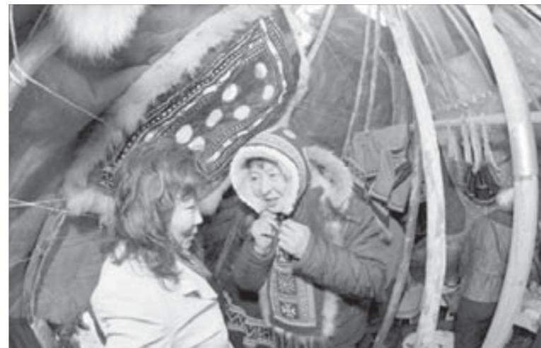
В долганском чуме