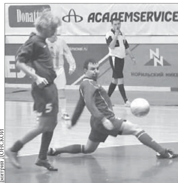
Боролась до последнего