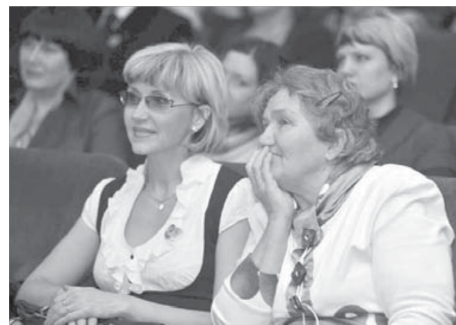
Хорошо в этой творческой команде