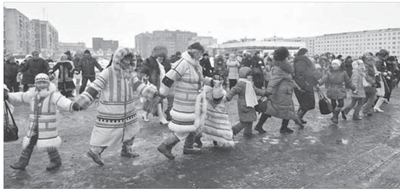
Праздник закончился общим хороводом на площади