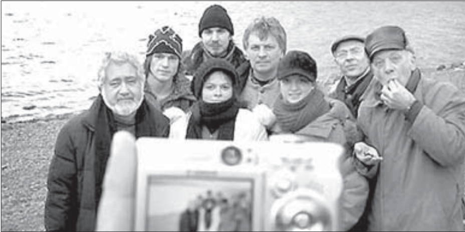
Репетируя “Жизнь и судьбу”, Лев Додин привез своих студентов в Норильск. Среди них был и сегодняшний гость “ЗВ”. В момент съемки он бродил по берегу Ламы