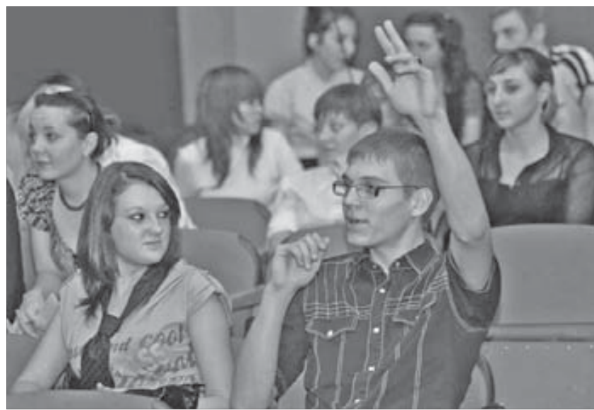
Студентов волновала личная жизнь будущих парламентариев, а студенток – любопытство сокурсников

Выборы в молодежный парламент состоятся 27 ноября. В этот день в Норильске будут оборудованы пять избирательных участков – в ККЗ “АРТ”, кинотеатре “Родина”, центральной Публичной библиотеке, молодежном центре и в здании автовокзала. Каждый норильчанин в возрасте от 14 до 35 лет сможет выбрать 15 будущих парламентариев. На членство в молодежном парламенте претендует 31 выпускник проекта “Кадровый потенциал города Норильска”.