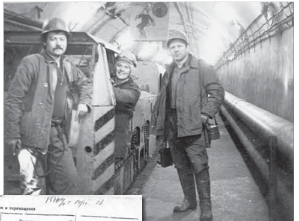
Трудилась наравне с мужчинами

Начальник отдела кадров стал думать. Бурильщик не для меня. Тяжело. Сошлись, что буду работать скреперистом на добыче. Так с 11 октября 1955