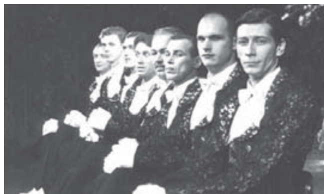
Играть Уайльда непросто. Десять лет назад у норильчан это получилось блестяще