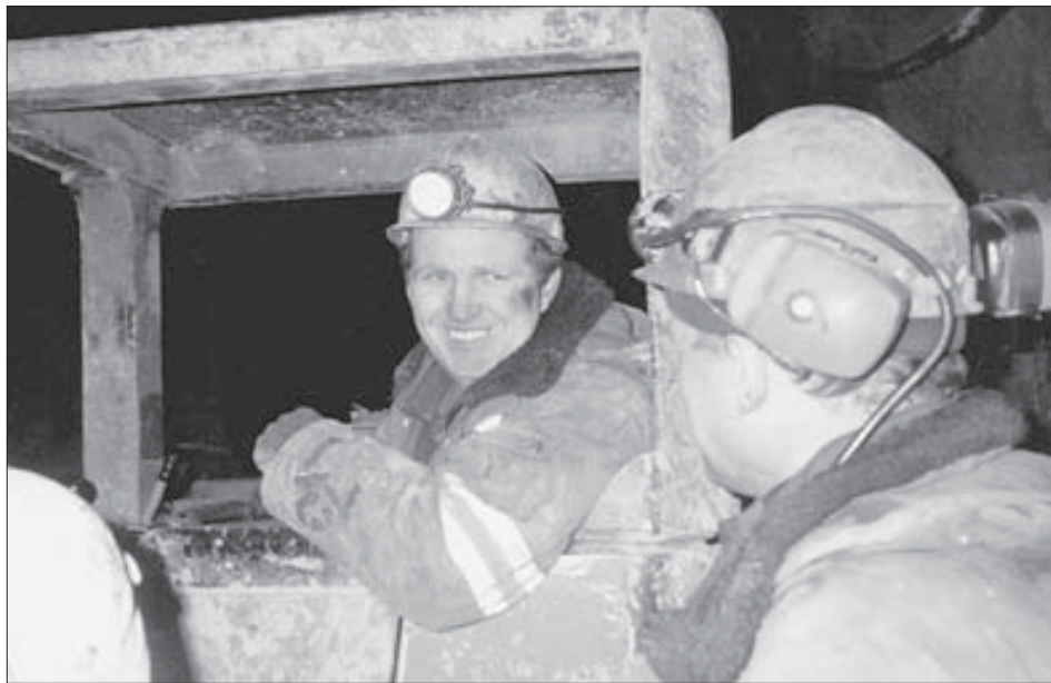
Работа машинисту ПДМ нравится