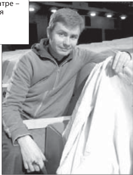
“У Додина я полюбил сочинять спектакль”

– Обе дали много в понимании судьбы и жизни наших героев. Но в Норильске я был впервые, в Польшу уже ездил не один раз еще в новосибирский отрезок своей жизни. Я даже польский язык выучил.