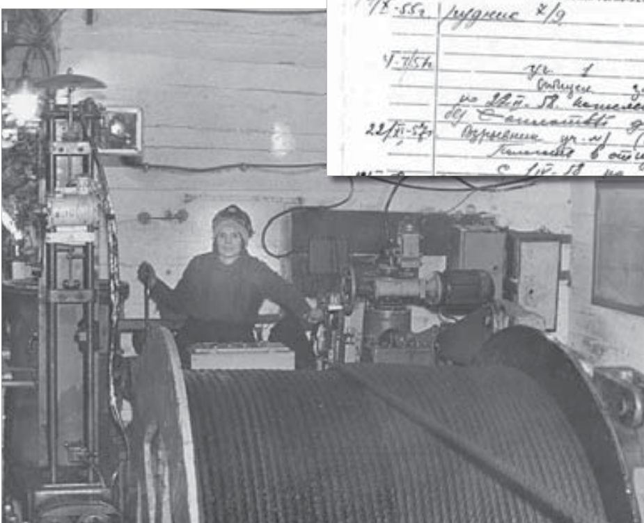
На "Заполярном" прошла вся ее жизнь

"...28 сентября я выехала из Красноярска в Норильск, плыла последним пароходом на Север... – пишет она. – Все было интересно: как плыли, приезд, сам город... Норильск еще был небольшой – улицы Октябрьская, Горная, Ленина, а остальное – тундра. Очень много приехало молодежи. Все смеялись – "старички-норильчане". Много было солдат, отслуживших в 1955 году. Тогда заключенных убрали со всех рудников, угольные шахты закрывали. Рудник 7/9, ныне "Заполярный", набирал рабочих.