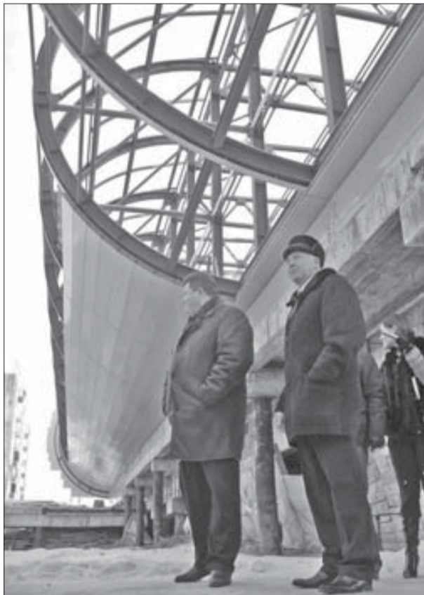
Летом на “Арену-Норильск” вернутся рабочие