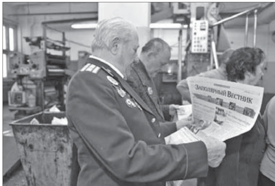
“Заполярный вестник” печатается на американской офсетной машине

Продолжение читайте в ближайших номерах “ЗВ”