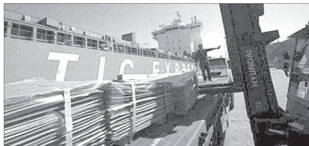
Груз компании доставлен до адресата