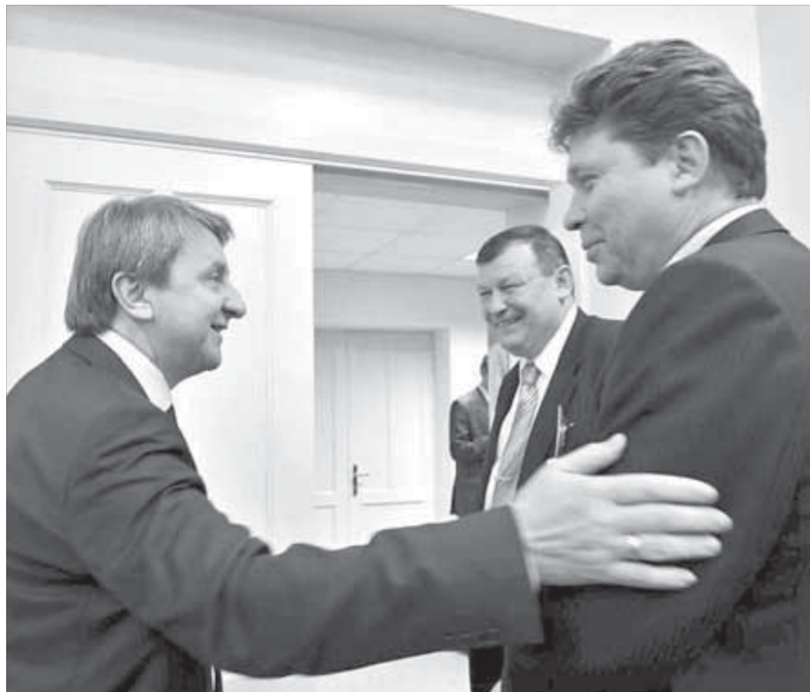
“Норильский никель” открыл двери — экологи готовы помочь