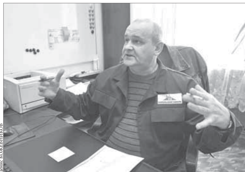
Он был истинным патриотом никелевого завода и Норильска

Курс акций ОАО “ГМК “Норильский никель” – 5457 рублей. ОАО “Полюс Золото” – 1582,3 рубля.