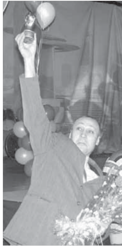
Первое золото есть