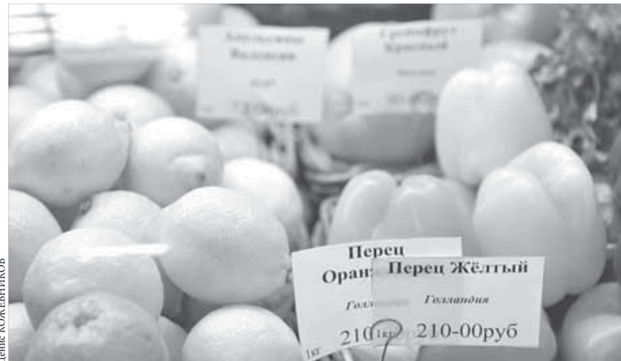
Дары природы к столу северян

В среду оптимизма инвесторам добавила положительная статистика из США и Азии, в частности сообщение об увеличении Китаям сальдо внешнеторгового баланса до максимального уровня с 2008 года. Кроме того, рыночные игроки активно