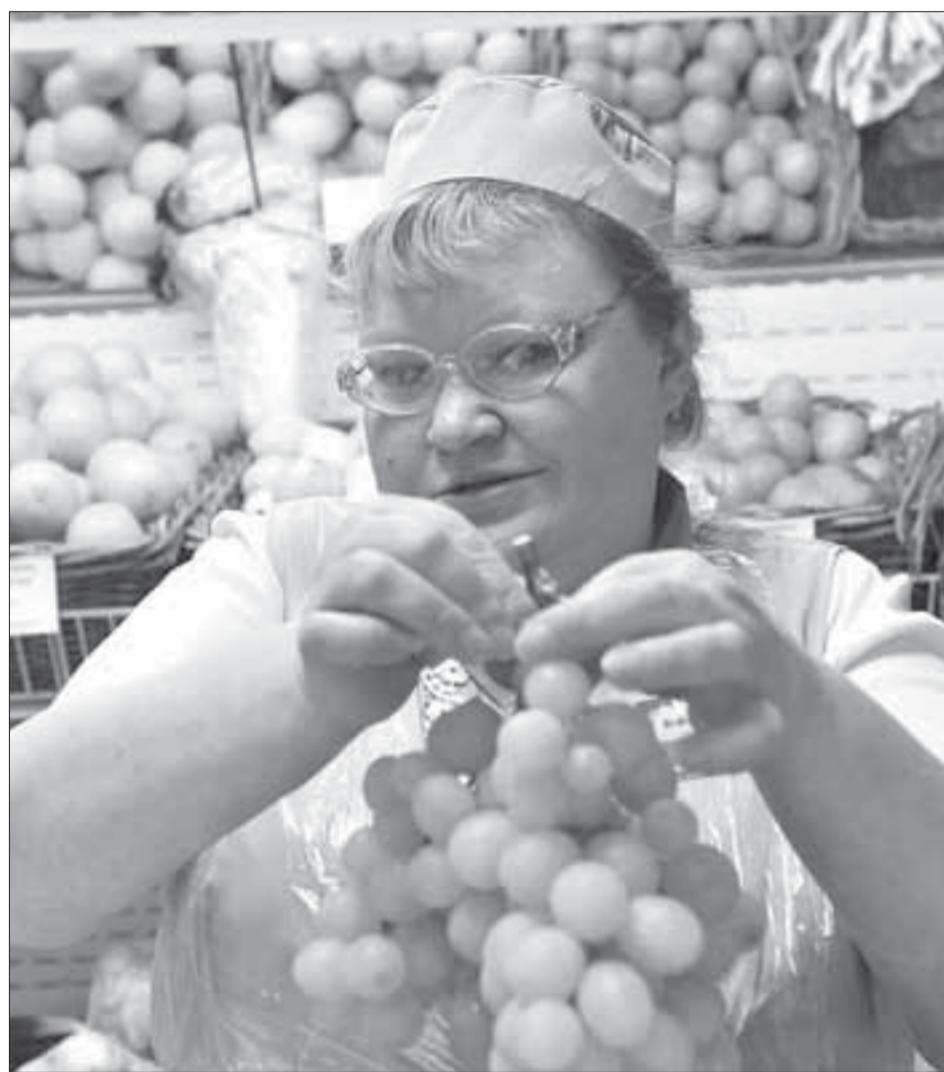
Красивый виноград! И недорогой