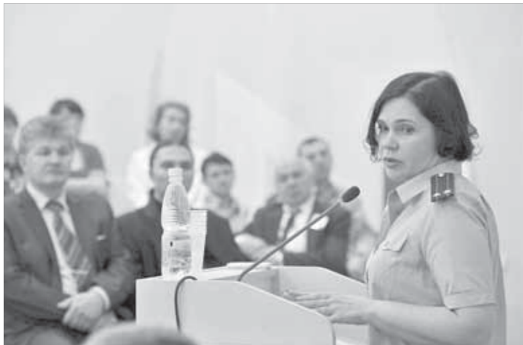
В прокуратуре тоже работают экологи