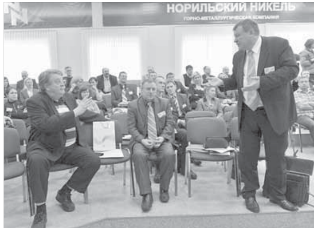
Дискуссии между экологами проходили бурно