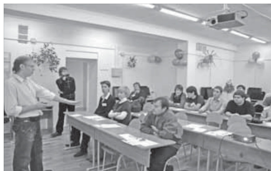
Специалистам есть о чем поговорить

На базе второго корпуса гимназии №5 заработал первый норильский IT-клуб, под эгидой которого планируется собрать лучших специалистов в области компьютерных технологий.