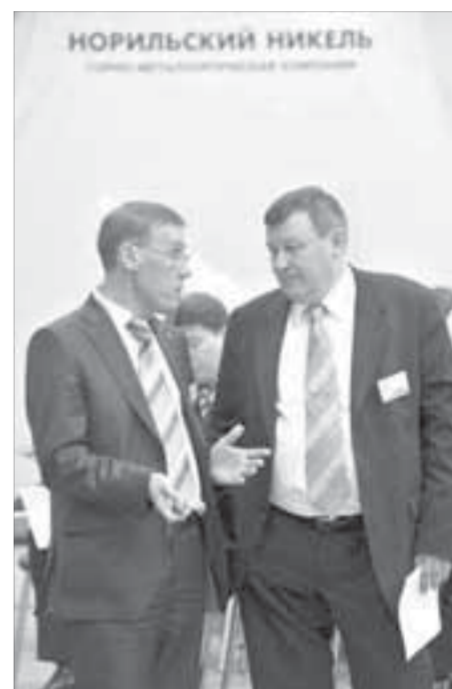
Ученым и производственникам есть что обсудить

Экологи не скрывают своего удовлетворения. Впервые в отечественной практике появилась площадка, на которой сошлись для обсуждения экологических проблем представители промышленности, законодательной и исполнительной власти, надзорных органов, непосредственно экологи. Как выяснилось, только такой комплексный подход дает возможность серьезно продвинуться в деле охраны окружающей среды, рассмотреть природоохранную деятельность во всей полноте, учитывая мнения различных сторон, соотнося научные, технологические и законодательные аспекты. Выяснилось, что говорить на одном языке возможно. А некоторые экологические проблемы всеми участниками конференции были признаны безусловными.