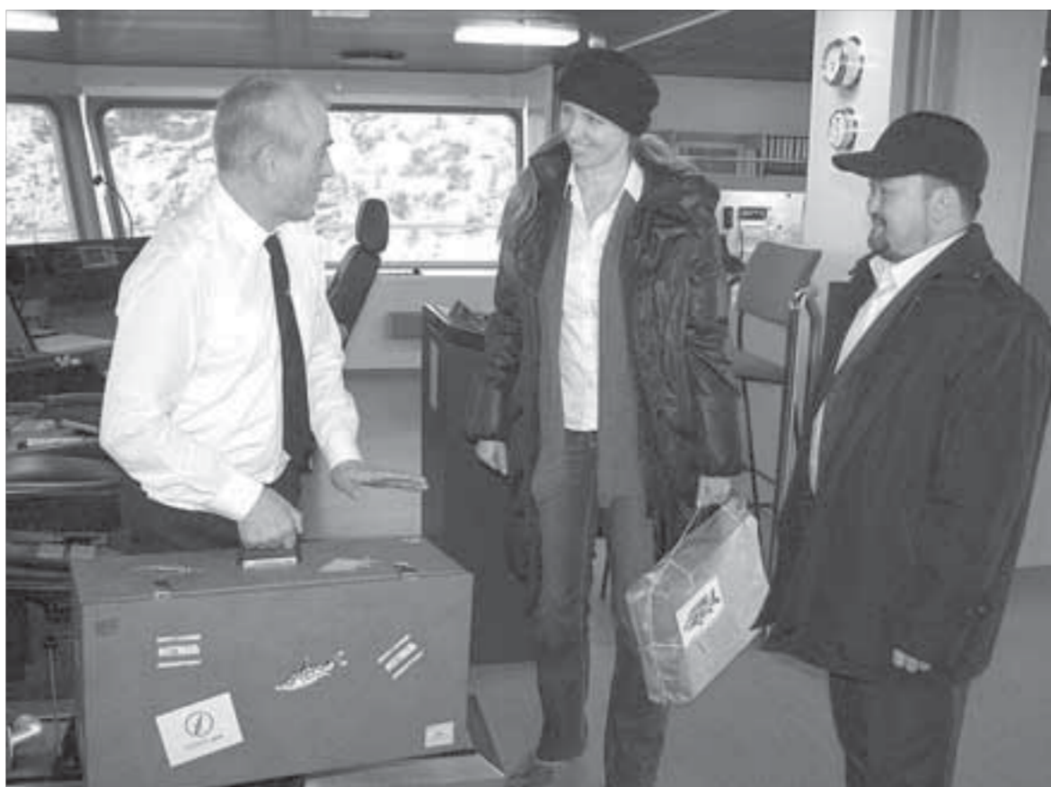
Капитан: “Доставим в лучшем виде!”

Курс акций ОАО “ГМК “Норильский никель” – 5493,5 рубля. ОАО “Полюс Золото” – 1606,2 рубля.