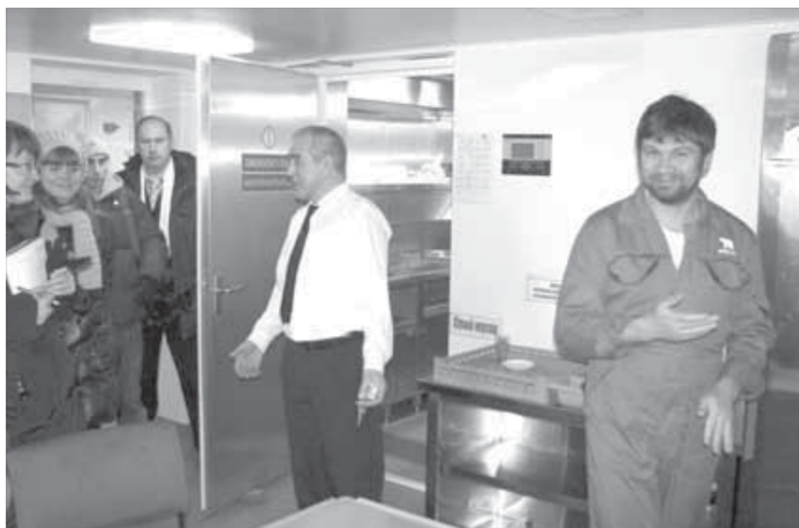
Нам показывают камбуз