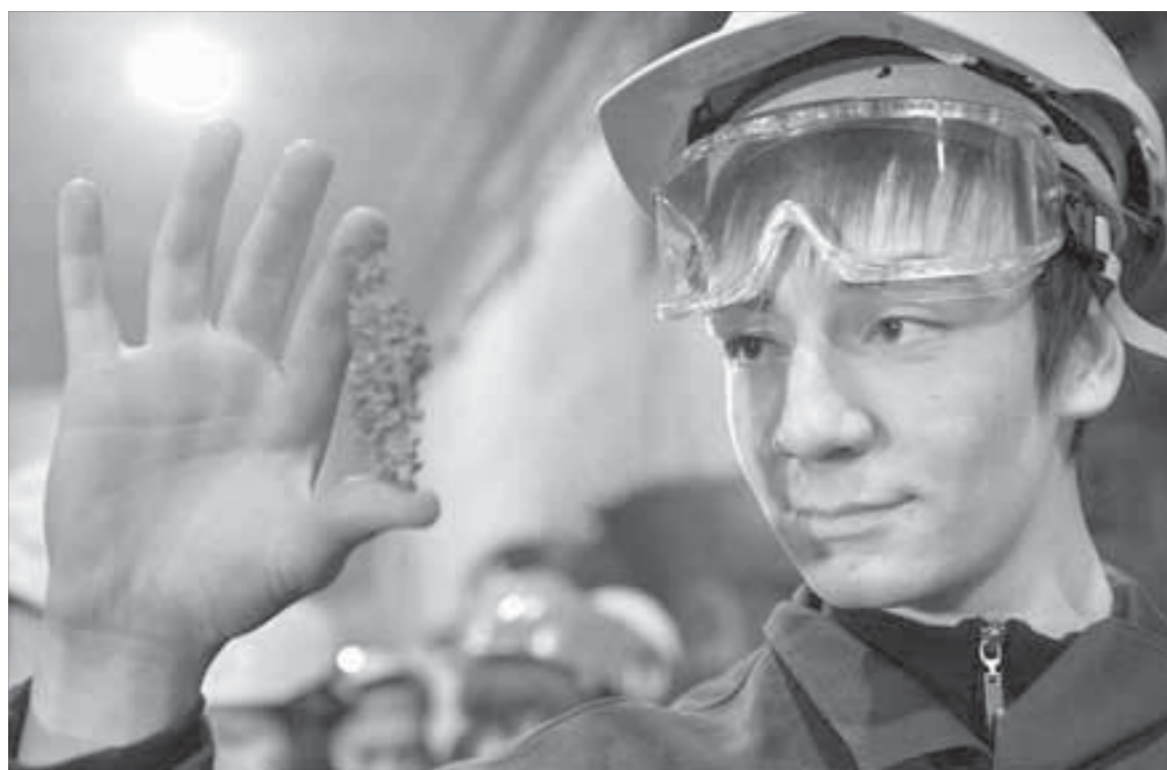
Хороший повод вспомнить таблицу Менделеева

На территории муниципального образования "Город Норильск" в отделе развития и правового регулирования социально-трудовых отношений управления по персоналу аппарата администрации города Норильска работает телефон горячей линии 34-61-34. По указанному телефону жители города могут сообщать информацию, касающуюся задержки выплаты заработной платы. Телефон работает в будние дни с 9.00 до 17.00.