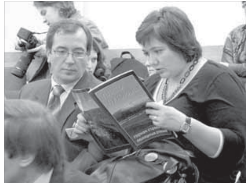
Участники конференции интересны природоохранные проекты "Норникеля"

Большинство покупателей "НН" составляют промышленные предприятия. По состоянию на 2009 год клиентская база "НН" состояла из 435 покупателей в 33 странах, 90% из них – промышленные потребители. Утверждение, что "НН" не продает металлы потребителям напрямую, а отдает их на биржу, – ложное. Основной потребитель никеля – сталелитейная промышленность, главный критерий решения о покупке никеля – низкая стоимость. Особых требований к качеству продукта нет. Если на рынке – профицит, то он приходится на наиболее дорогой стандартный материал (катод). Биржа – это место, где находится профицитный материал. Наличие материала "НН" на складах LME – свидетельство, что это один из самых дорогих стандартных материалов. Система сбыта и сбытовая политика "НН" функционируют 9 лет. За период 2002–2010 гг. средняя цена никеля выросла на 170% по сравнению с предшествующим 9-летним периодом, меди – на 130%, цинка – на 70%, алюминия – на 36%. Производитель, ежегодно решающий задачи реализации 100% объемов по среднегодовой цене, привести к обвалу цен на рынке не может даже теоретически.