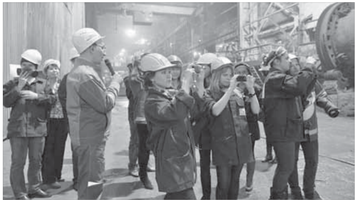
Плавильный цех оставил глубокие впечатления