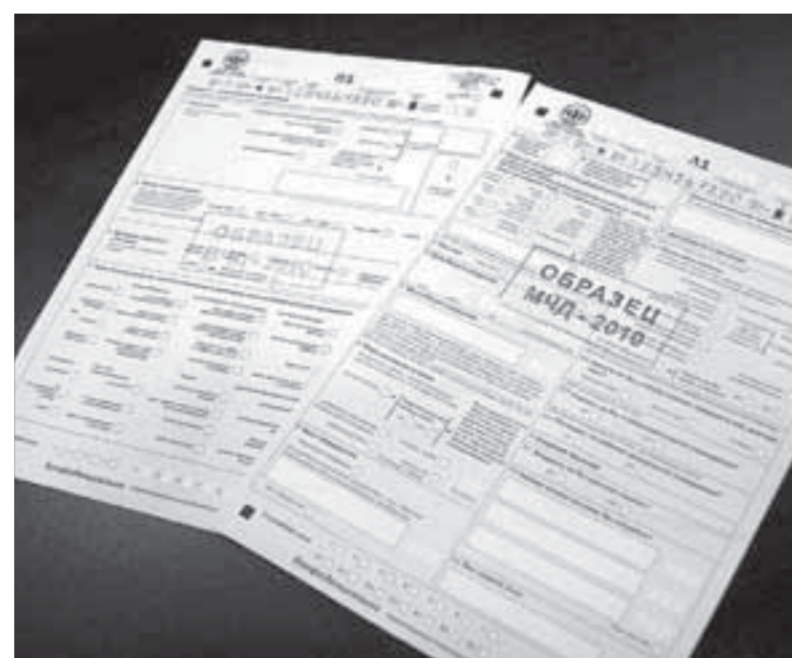
Образцы переписных листов