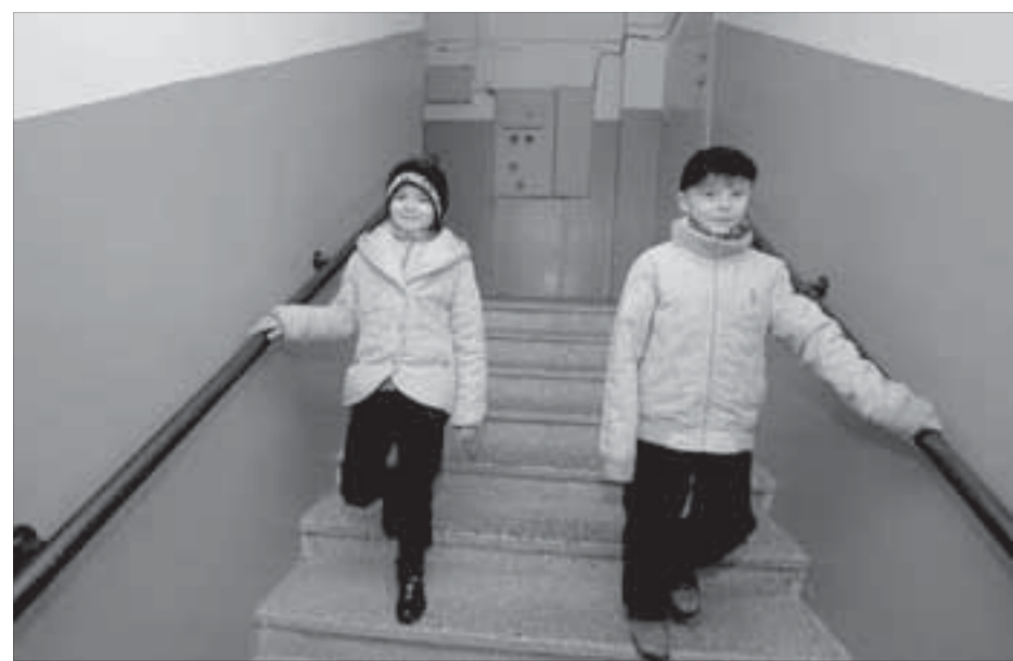
Не хватает лишь ковровой дорожки