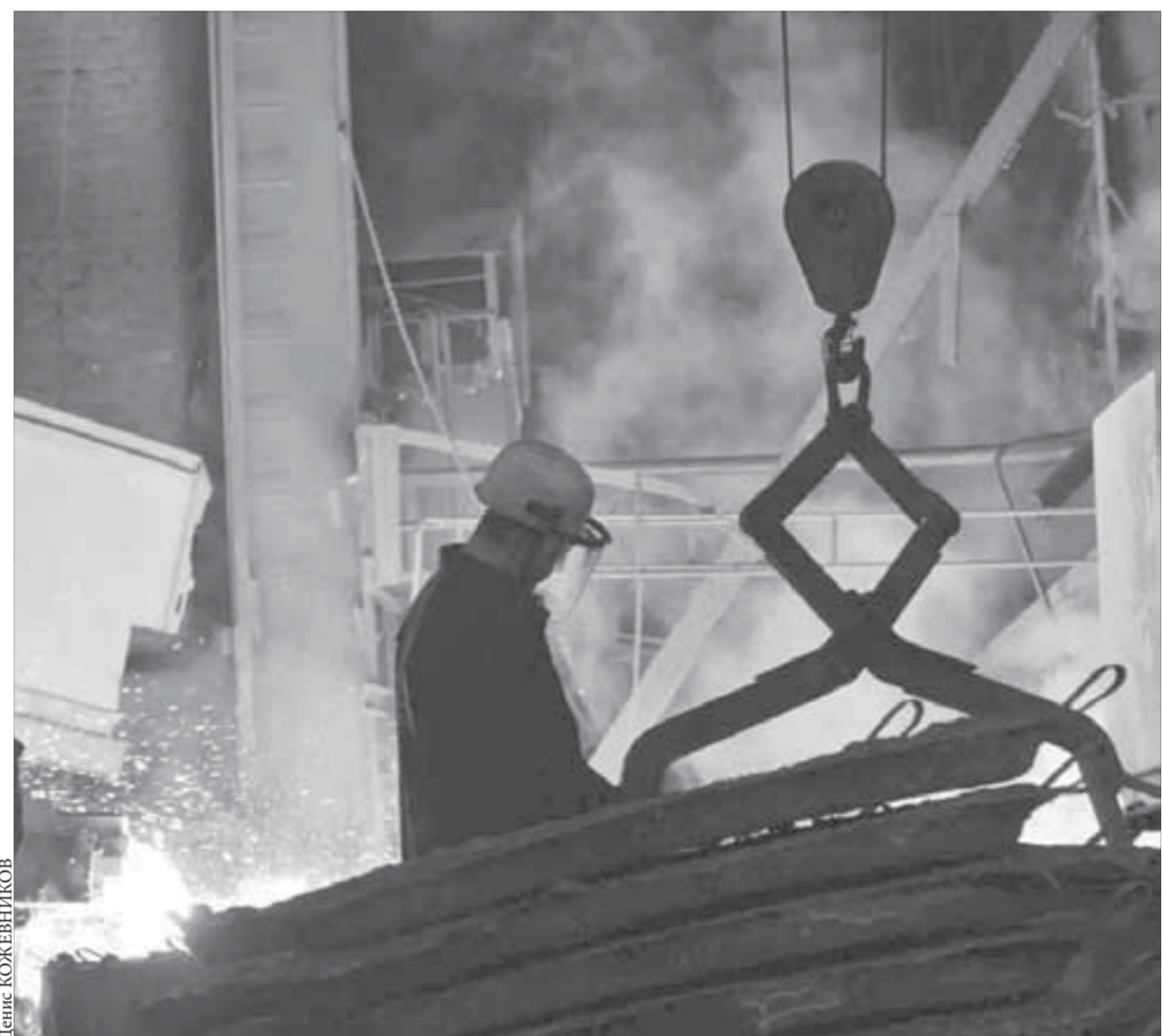
Работа у плавильщиков не из легких

То, что цены на цветные металлы будут расти в следующем году, полагают и во французском инвестиционном банке Natixis. Здесь прогнозируют, что в 2011 году средняя цена на медь составит 8300 долларов за тонну, а во второй половине года может достигнуть максимума — 9000 долларов за тонну.