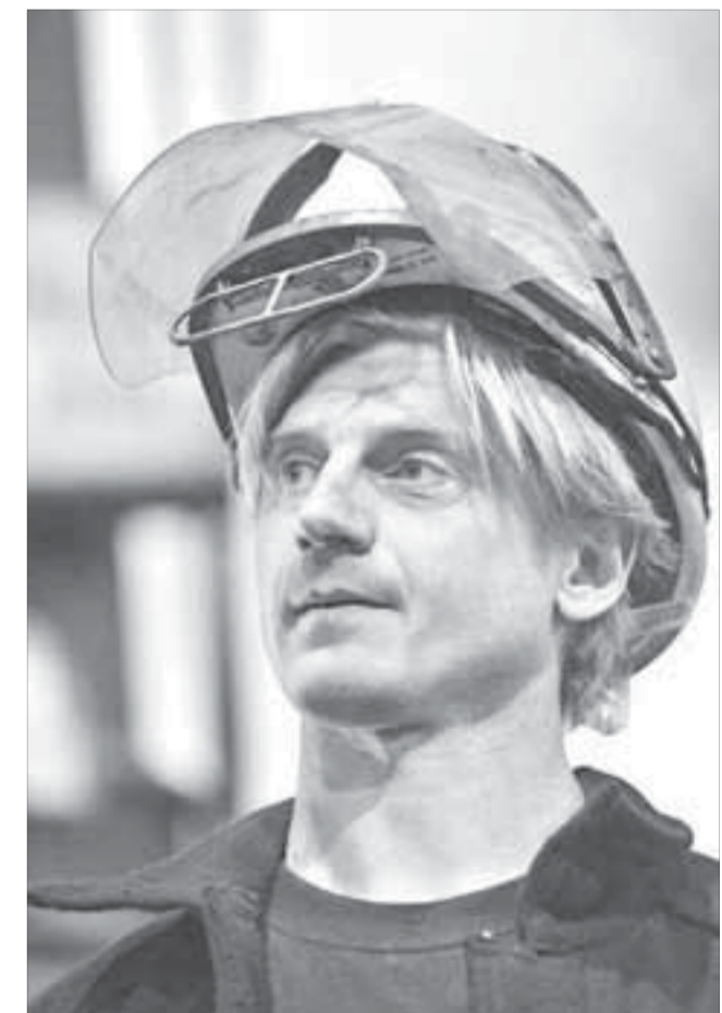
Дмитрий о проблемах говорит открыто

сонала у нас впритык. Если кто-то на больничный уходит, приходится вертеться вдвое больше.