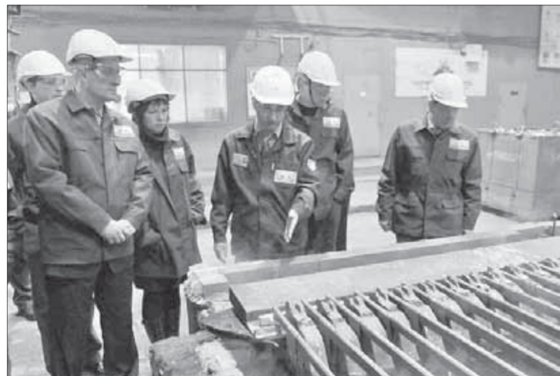
«Приятно видеть, как поставлено здесь дело»

Вчера в Норильске открылась региональная экологическая конференция «Охрана окружающей среды и промышленная деятельность на Севере». Экологи-ученые и экологи-практики из Москвы, Санкт-Петербурга, Красноярска, Мончегорска и Норильска собрались, чтобы оценить природоохранную деятельность Заполярного филиала, поделиться опытом внедрения экотехнологий, результатами современных исследований экологической направленности, наметить перспективы работы.