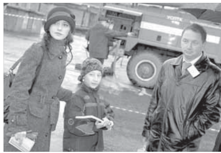
Быть пожарным хорошо, но и журналистом неплохо