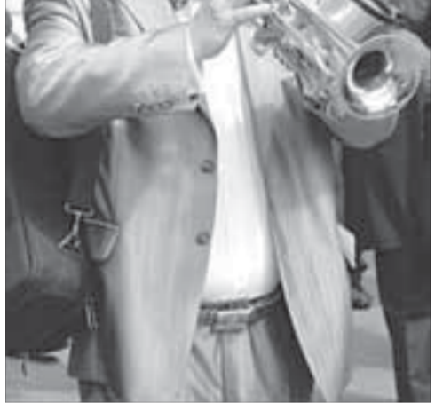
А человек играет на трубе

Сорок лет существует этот уральский коллектив. Создал его и по сей день руководит трубочник-виртуоз народный артист России Игорь Бурко. Челябинцы – лауреаты многих российских и международных фестивалей, они гастролируют по всей Европе и в каждом своем концерте одно отделение обязательно посвящают отечественному