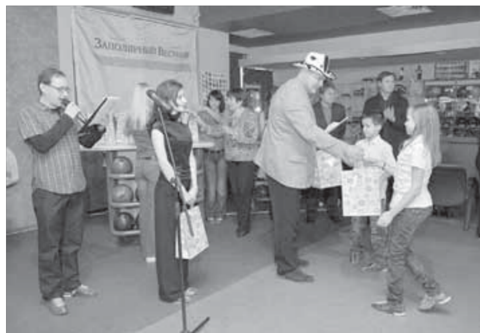
Юнкоры получили призы из рук журналистов "ЗВ"