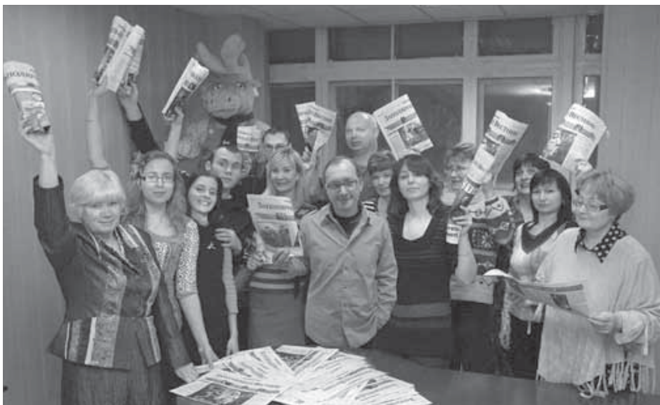
"Заполярный вестник" – это мы!

Накануне юбилея "Заполярного вестника" хочу пожелать, чтоб вы не испытывали трудных времен, как когда-то было.