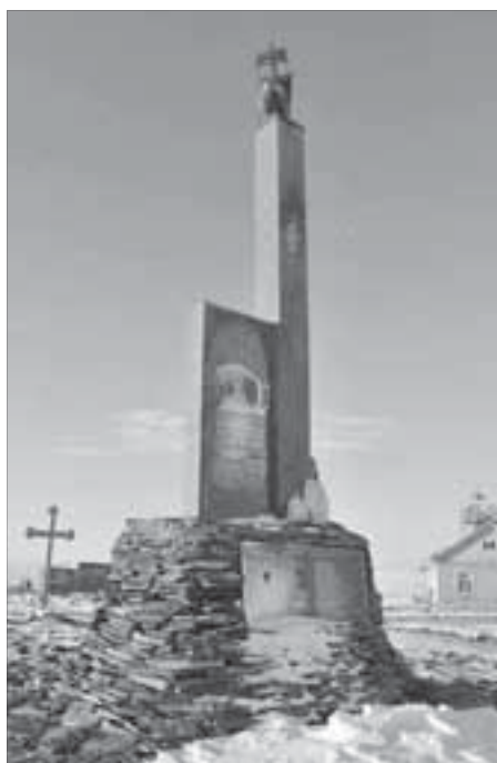
От солдат Тобольского гарнизона

Мы, конечно, тут не первые. На протяжении нескольких столетий в эти края стремились исследователи и покорители Арктики, научные экспедиции, военные, не говоря уже о сумасшедших – в хорошем смысле слова – спортсменах и путешественниках. Вот и флаг нашей газеты пришлось разворачивать у каменного знака экспедиции Руала Амундсена и по соседству с деревянным столбом экспедиции Харитона Лаптева.