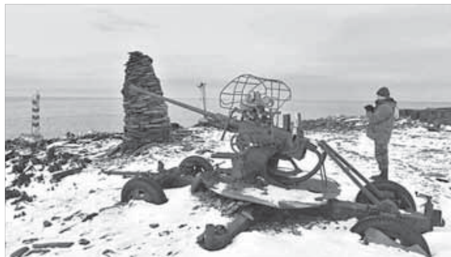
Присутствие как признак государственности

Пограничники говорят, что их главной задачей в Арктике является не просто охрана морских и биологических ресурсов, контроль за проходящими судами, морской и воздушной территорией, но и представление здесь государственных интересов. Демонстрация присутствия как признак государственности. С некоторых пор пограничники сами себе прибавили еще одну функцию – сохранение истории освоения Арктики.