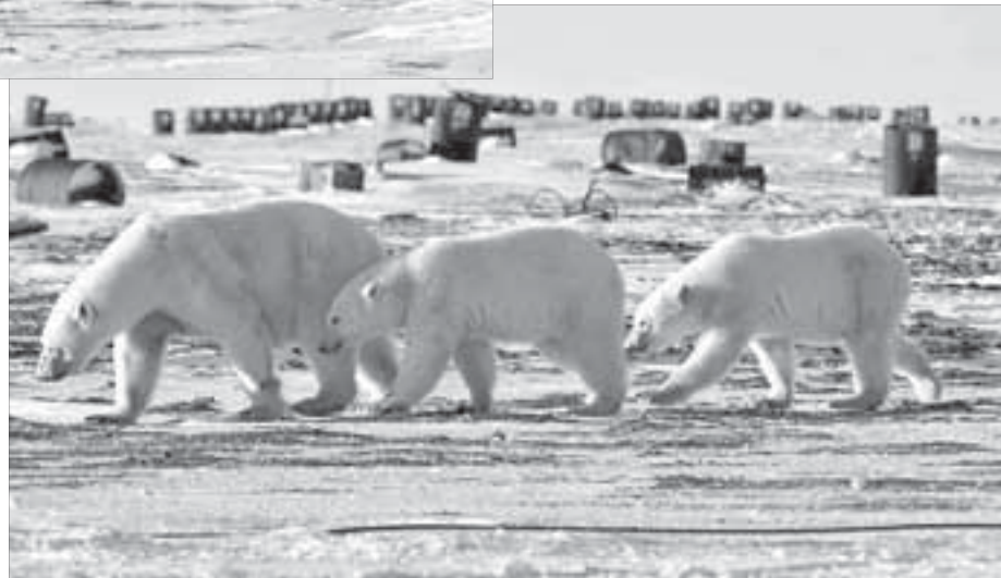
Мы тут не первые и не одни

Дом на Среднем превратился в музей – на нем мемориальная табличка, внутри экспонаты из тех, что удалось собрать в Арктике: огромный пропеллер с самолета начала прошлого столетия, красный флаг, изрядно истрепанный северными ветрами, предметы быта и работы полярников.