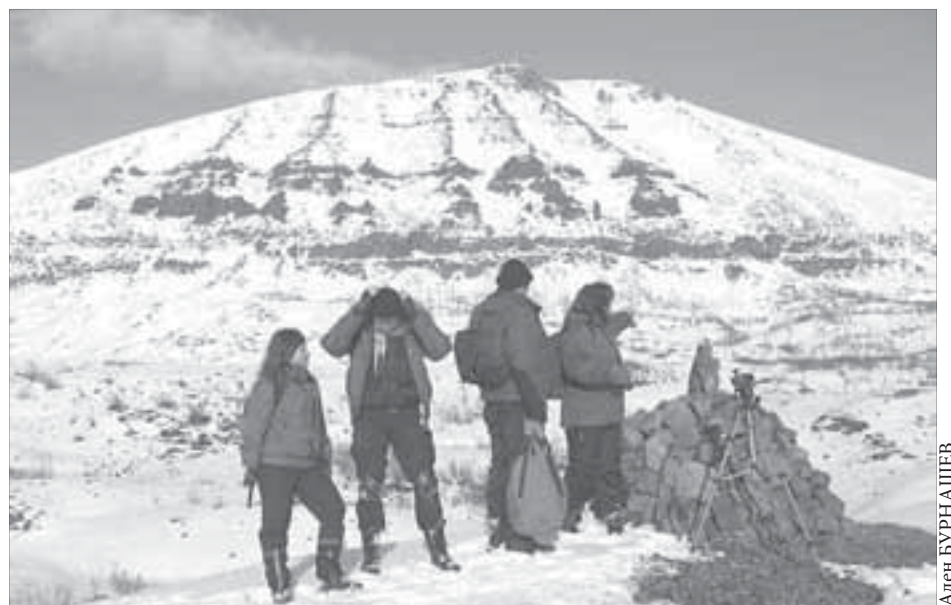
Сейчас поселок найти очень трудно

Наверное, эту страницу в истории Норильска уже можно закрыть. Но таких страниц вокруг немало. Чтобы их увидеть, не нужно многого. Достаточно походной экипировки, немного провизии, блокнота, фотоаппарата или видеокамеры.