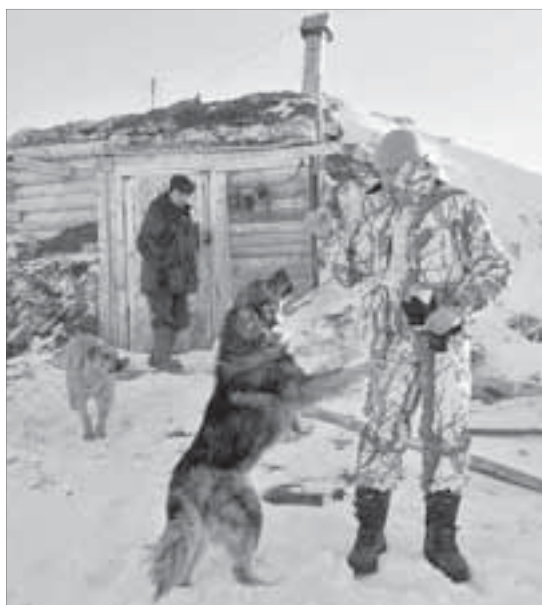
Пес Дизель – лучший друг полярников