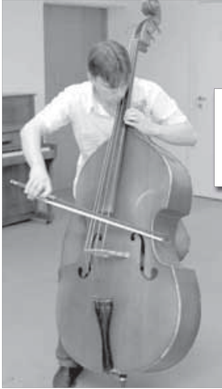
Любовь к контрабасу пришла не сразу