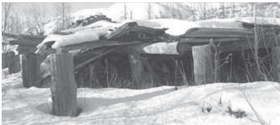
Когда-то здесь жили и работали люди

Хочется обозначить сразу: на роль первооткрывателей никто из нас не претендовал, в городе до сих пор живет довольно много очевидцев тех или иных историчес-