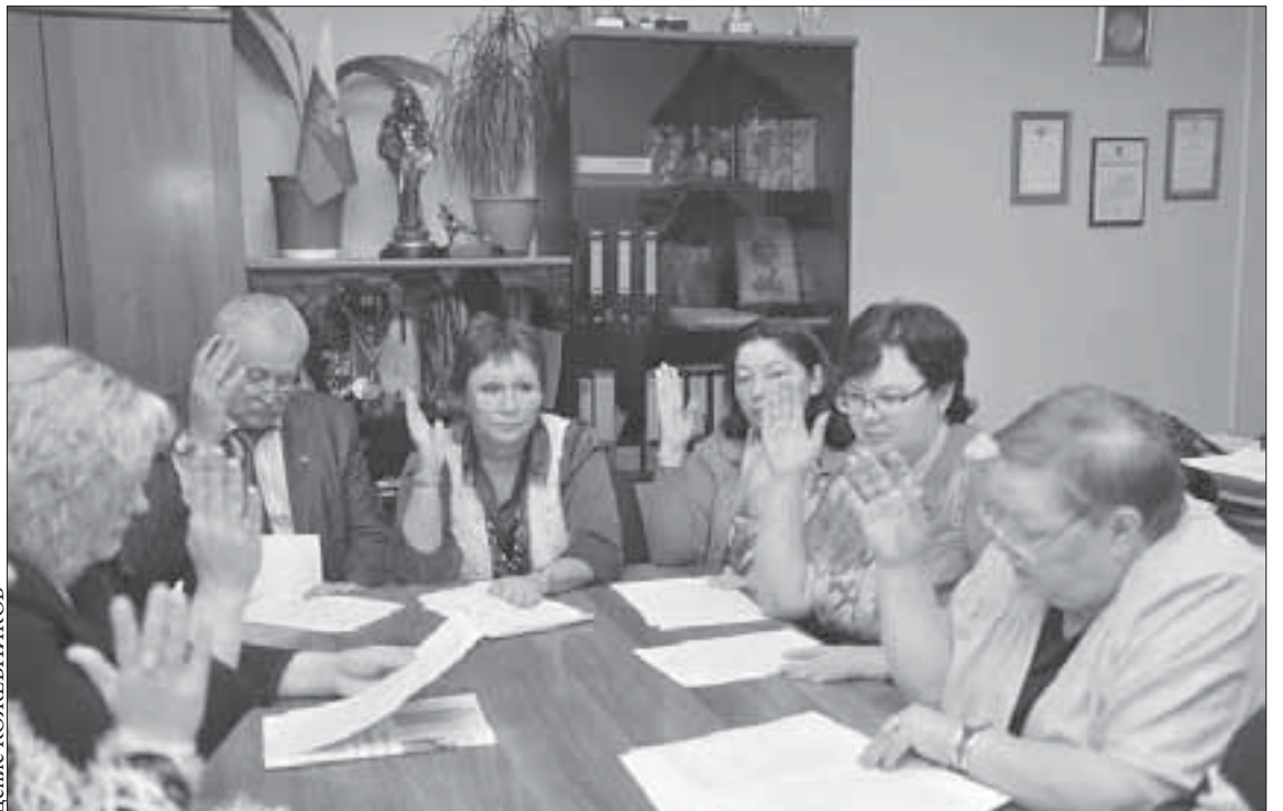
Норильчане голосуют за стабильность