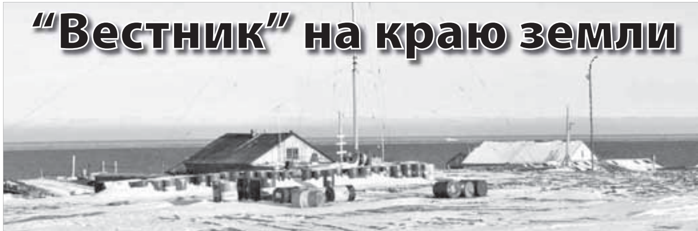
Полярная станция “Мыс Челюскин”