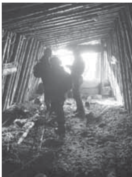
Сегодня штольни заброшены и опасны

Одно дело – изучать историю Норильска, сидя в архивах или Интернете. Другое – видеть, как, когда и из чего строился город.