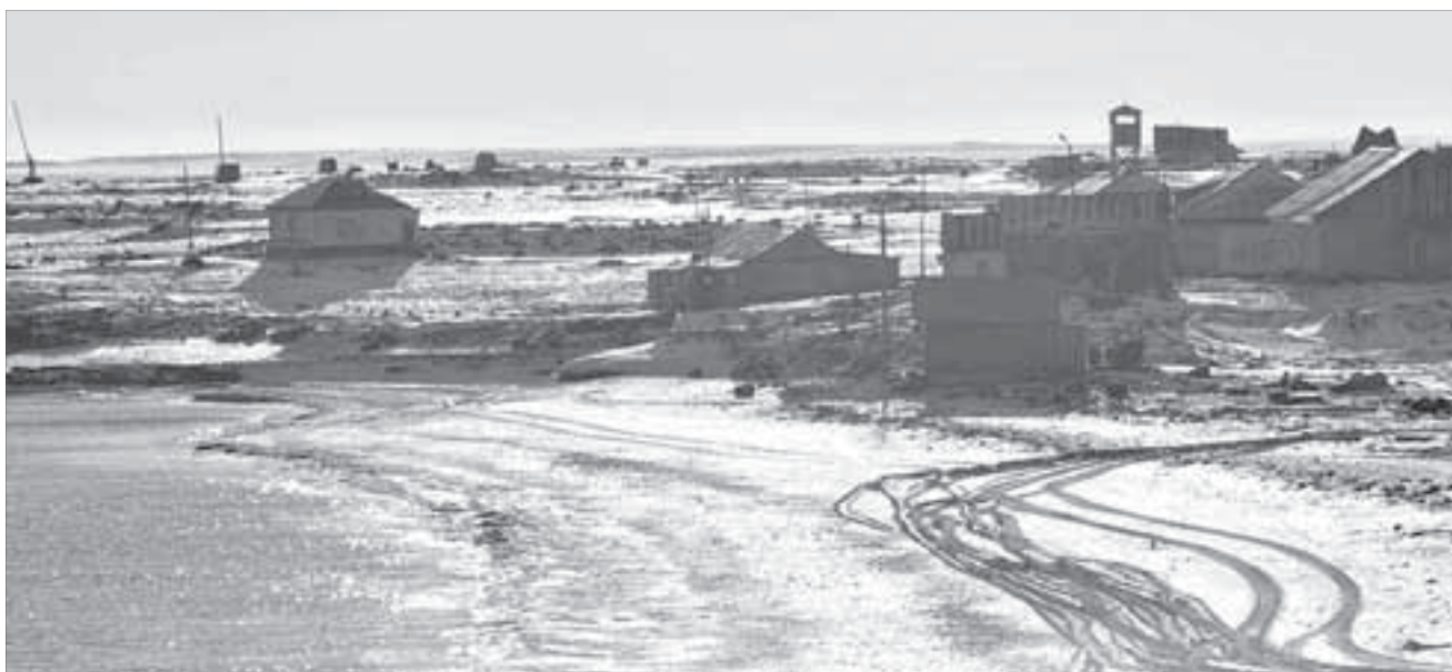
Люди на краю континента