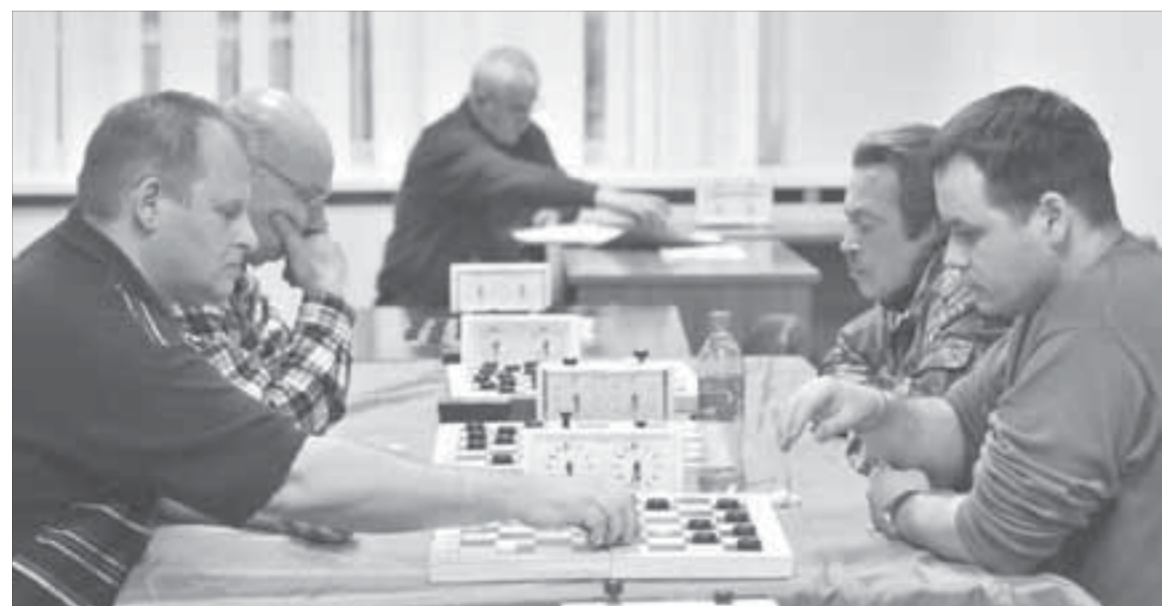
Команда Норильской железной дороги вышла в "дамки"

Победитель во второй группе определился задолго до последнего тура. Железнодорожники уверенно лидировали, обыгрывая многих соперников всухую. Уже с середины турнира догнать команду НЖД практически ни у кого не было шансов.