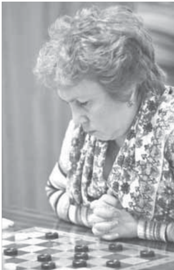
Женщины не уступают мужчинам

– Почему предприятия делят на группы по численности работающих? – обращается он к организатором соревнований. – Нашей команде во второй