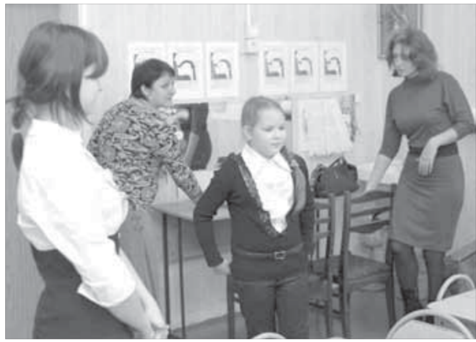
Все, что знали, владельцы перстня корреспондентам рассказали