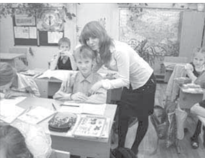
"Так, правило первое – слушать учителя!"

Завершился день дублера праздничным концертом. В актовом зале педагогов ждал сюрприз: десятиклассники открыли сезон КВН. Веселые шутки на школьную тему никого не оставили равнодушным. Зрителям ничего не оставалось, как активно поддержать выступающих аплодисментами.