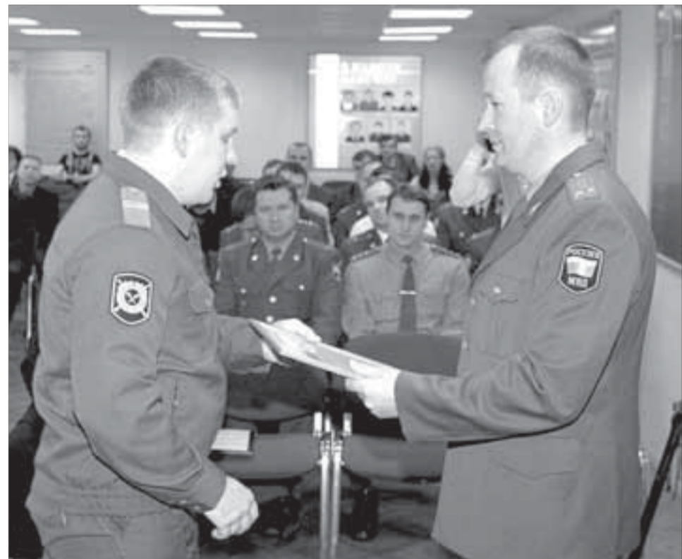
Опер – это образ жизни

Вчера норильские сыщики отметили профессиональный праздник – 5 октября 1918 года было организовано Центральное управление уголовного розыска.