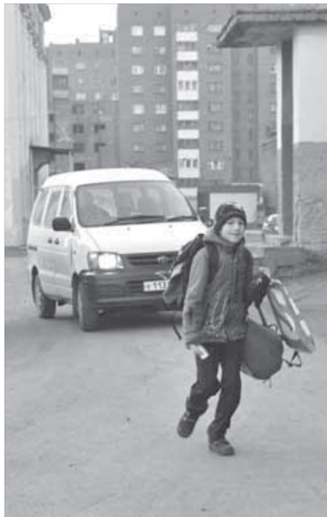
Пешеходом быть не опасно?