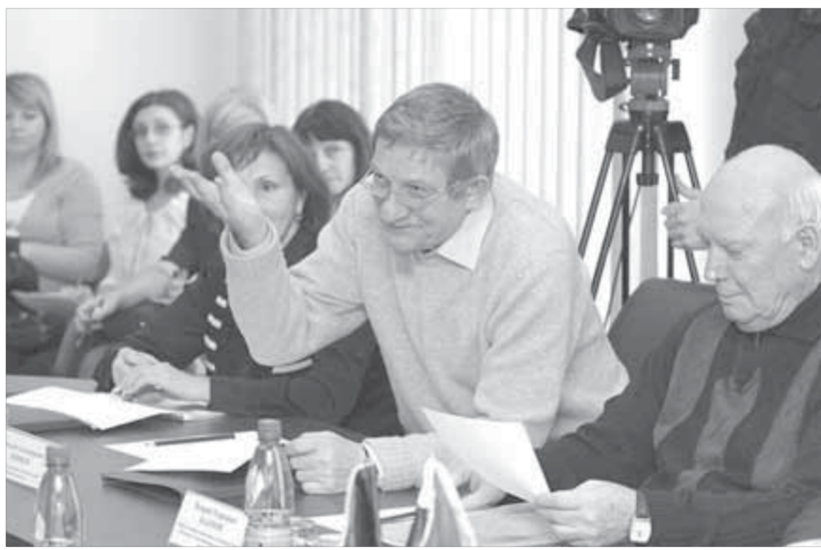
Соглашения превращаются в реальные дела