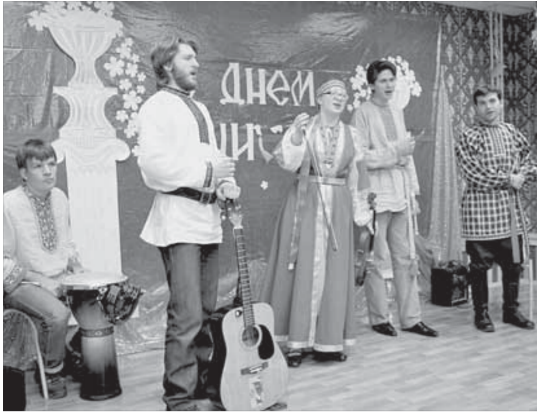
Поздравление от коллег из ДТДМ