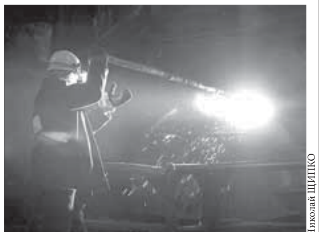
Труд норильских металлургов рынок оценил достойно