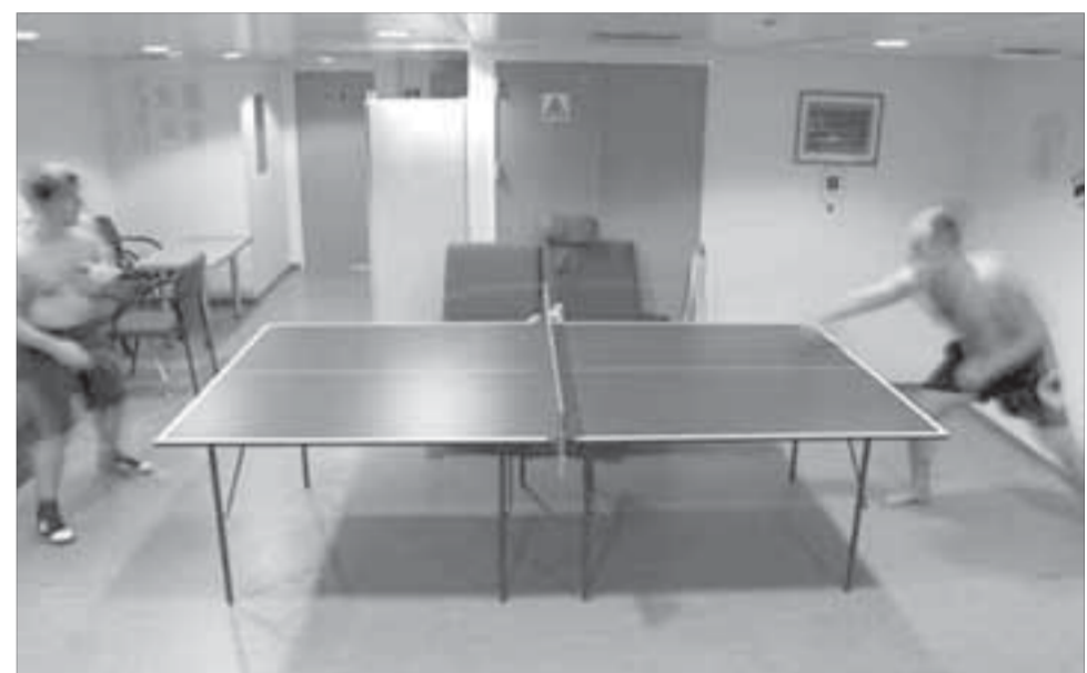
За победу положены “ценные китайские призы”