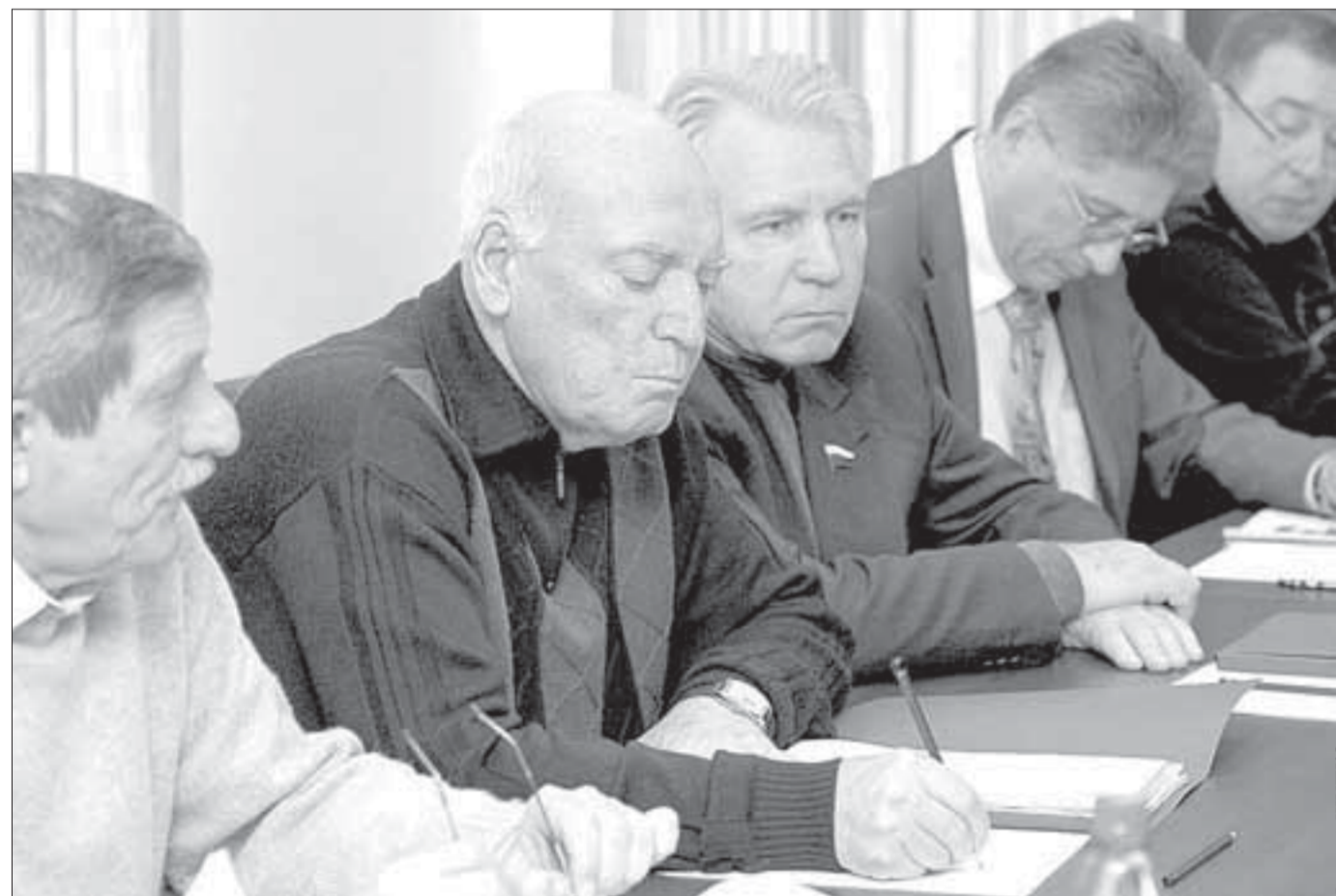
Гостям рассказали о подготовке к реализации четырехстороннего соглашения

Делегация Совета Федерации, побывавшая в Норильске, сегодня работает в Дудинке, а завтра в Красноярске состоится выездное заседание Комитета верхней палаты российского парламента по делам Севера и коренных малочисленных народов.