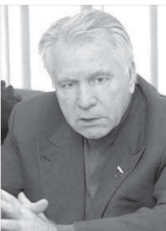
Комитет по Северам будет отстаивать “норильскую строку” в федеральном бюджете

Действительно, для начала реализации программ переселения и модернизации объектов инженерной инфраструктуры необходимо, чтобы