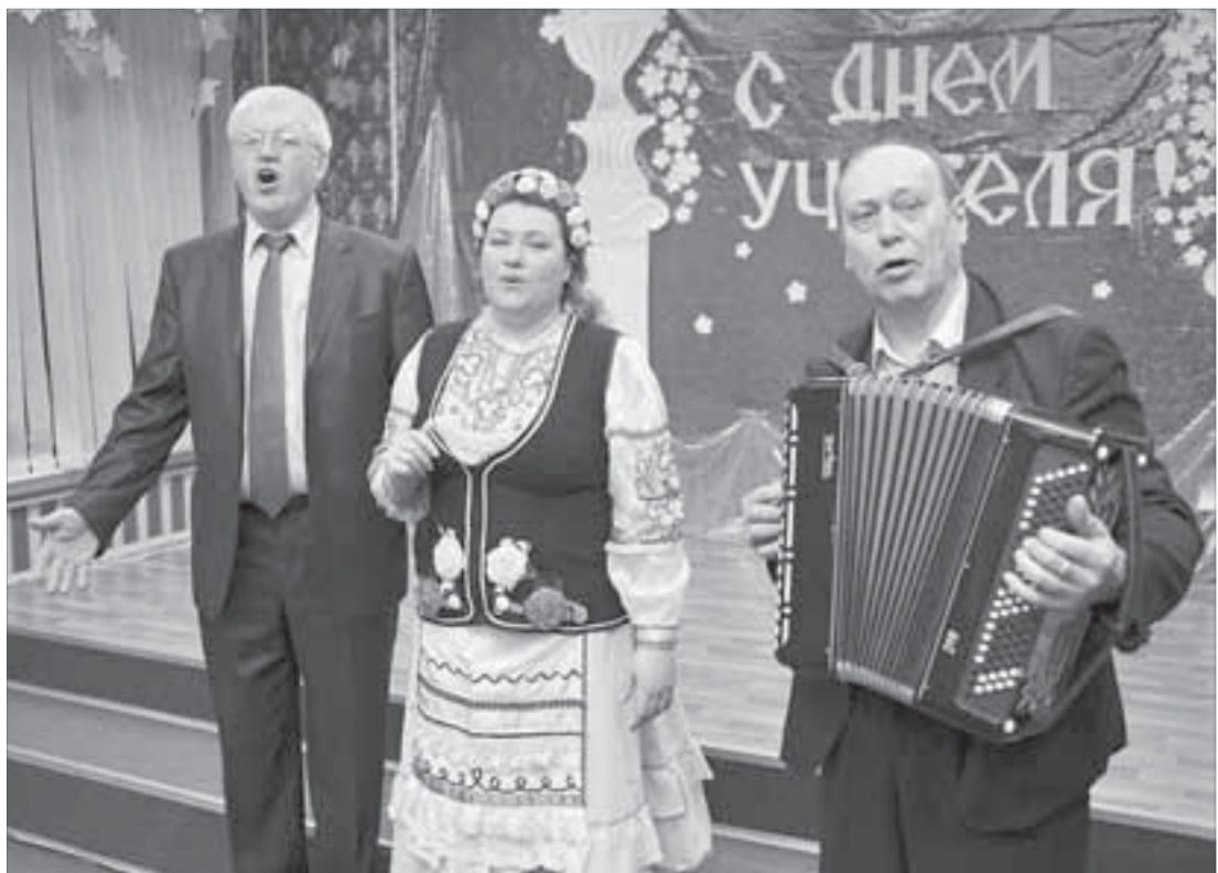
ПО "Норильскремонт" открывает цикл концертов народной музыки

Концерт на День учителя получился соответствующим. Было тепло, как дома, все участники подошли к делу неформально.