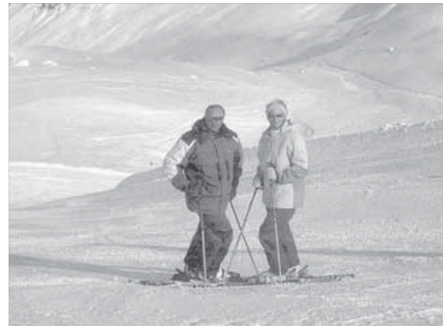
Спорт объединяет семью, уверены супруги