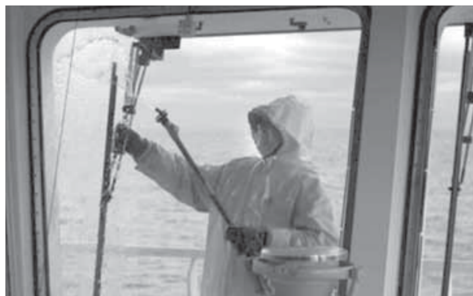
Обещали помыть иллюминаторы? Помыли