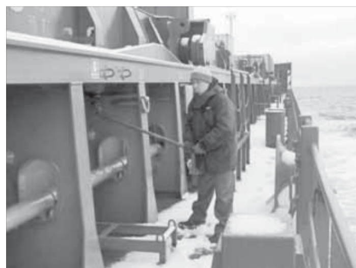
Холод не холод, а регулировать задрайки люков трюмов все равно необходимо