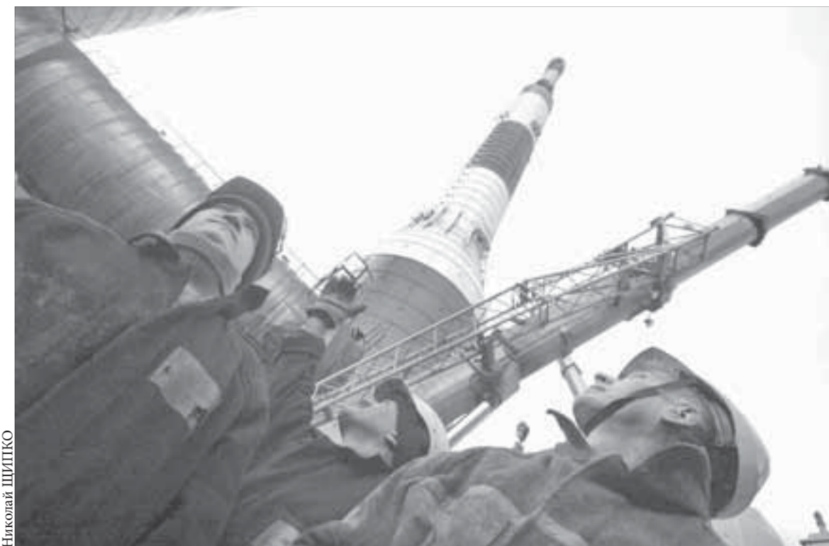
До ввода трубы в эксплуатацию остались считанные дни

Представители UC Rusal также входят в совет директоров ГКМ уже более двух лет, но за все это время вопрос экологии и модернизации производства был поднят ими более-менее серьезно всего раз – летом 2008 года, в разгар происшедшего тогда акционерного конфликта. Сегодня мы во многом наблюдаем события двухлетней давности: проблемы по факту не решаются в отсутствие конструктивной позиции со стороны одного из акционеров, что не мешает UC Rusal создавать видимость беспокорности и заинтересованности в их устранении. В действительности же алюминиевая компания занимается констатацией всем известных фактов, но пока еще не озвучила ни одного конкретного предложения и не взяла на себя ответственность за отсутствие осязаемых позитивных перемен в обсуждаемой сфере. Таким образом, UC Rusal занимается откровенным популизмом для того, чтобы заручиться поддержкой акционеров, инвесторов и других заинтересованных сторон для удовлетворения своих, только ей известных целей.