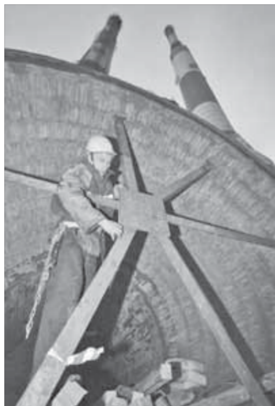
Соединительная секция готова к монтажу