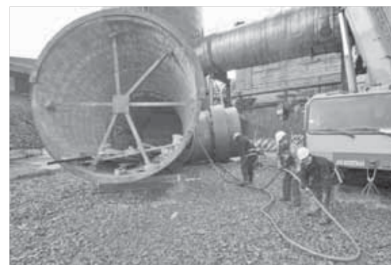
Каждый знает свою задачу