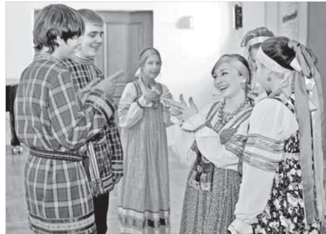
Коллектив знал, что выступление будет удачным

– Они сказали, что нашему ансамблю стоит участвовать в передаче "Минута славы", – говорят девочки. – Это было бы интересно. И, конечно, если в следующем году будет возможность, мы снова поедем на фестиваль-конкурс. Увидеть среди гербов городов-участников герб Норильска на самом видном месте было приятно. Мы сразу поняли, что это хороший знак.