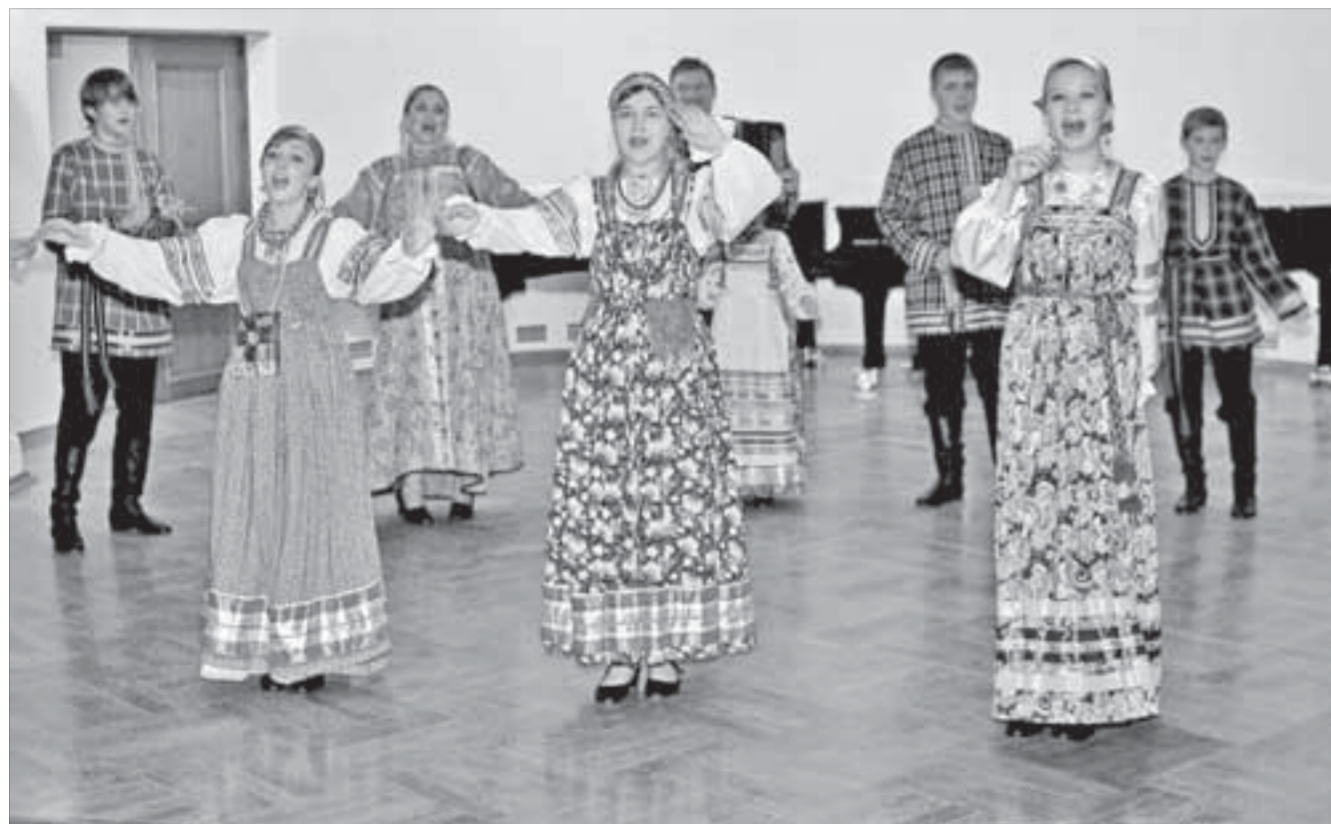
"Соловушки" покорили мурманское жюри

Фольклорный ансамбль "Соловушки" Норильской детской школы искусств вернулся с Всероссийского фестиваля-конкурса детского и молодежного творчества "Сияние Севера" с дипломом лауреата. Успех норильчан в Мурманске был ожидаемым.