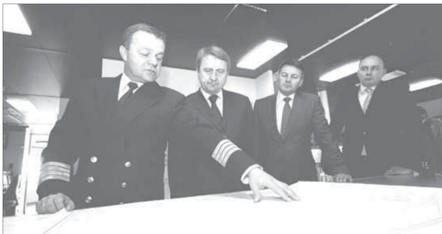
Полярный маршрут пройден пока только на карте

Дизель-электроход усиленного ледового класса "Мончегорск" вышел из Дудинского морского порта в Китай с продукцией "Норильского никеля" в трюмах. Это первый в истории отечественного мореплавания прямой рейс из Мурманска в страны Юго-Восточной Азии по Северному морскому пути.