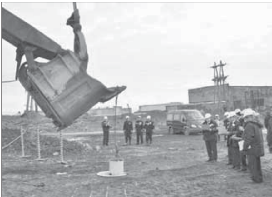
Провести ведро между стойками стало самым сложным заданием