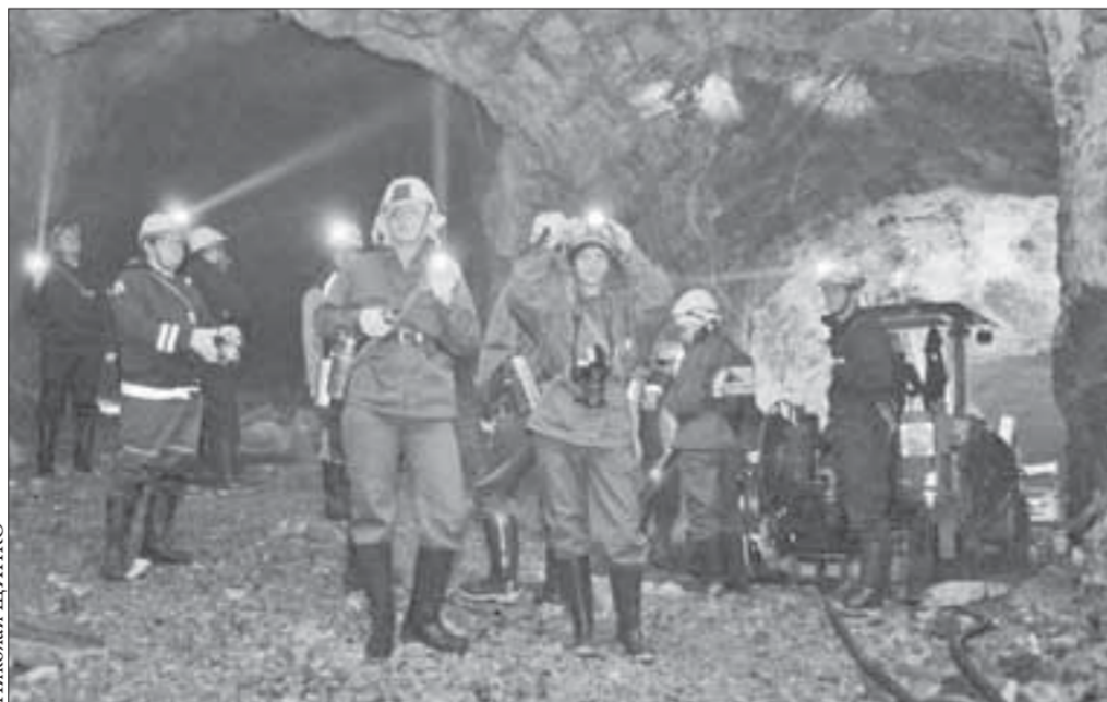
Большинство гостей Норильска впервые спустились в рудник

Кавээнщики из Сочи и Мончегорска, приехавшие в Норильск для участия в форуме "Территория позитива", побывали на руднике "Комсомольский". И решили, что шутить лучше на поверхности.