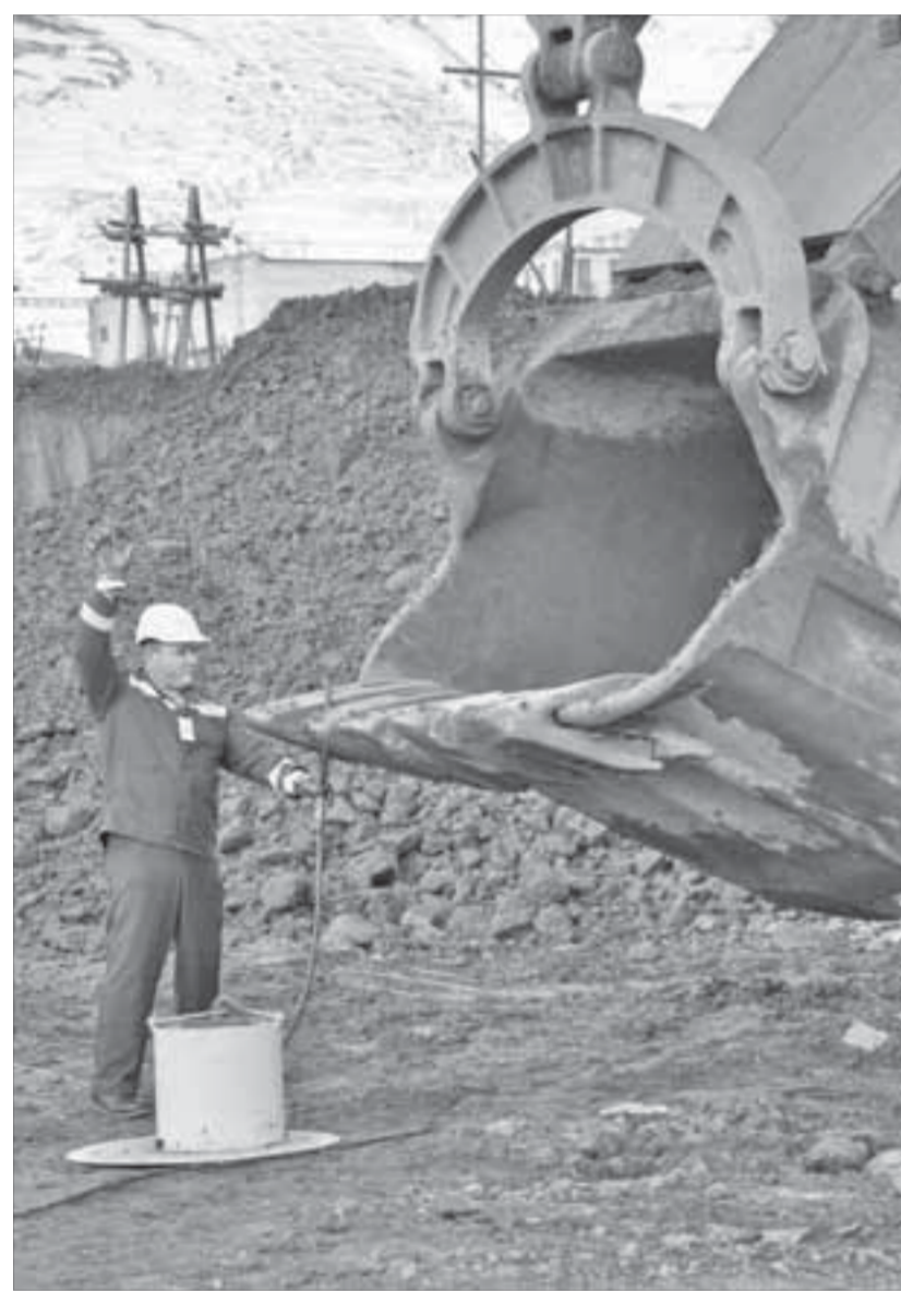
Таким ковшом, оказывается, можно работать легко и красиво