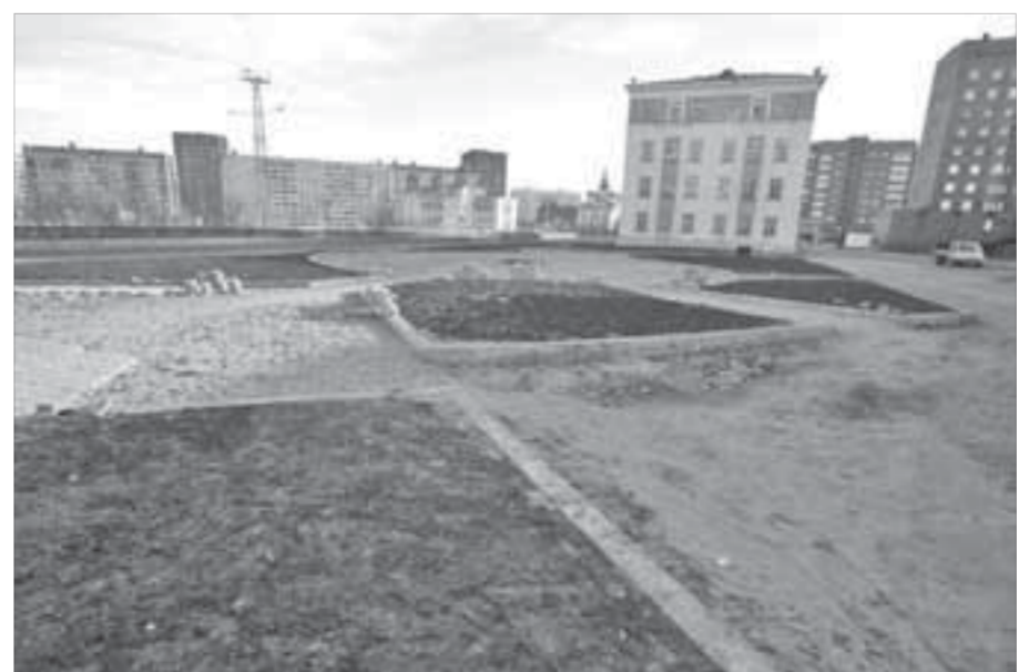
Чем закончится строительный скандал – пока неизвестно

О том, чем закончится строительный скандал, говорить сложно. Сейчас идет претензионная работа между управлением городского хозяйства и подрядчиком. Первые результаты этой работы журналистам пообещали сообщить на днях.