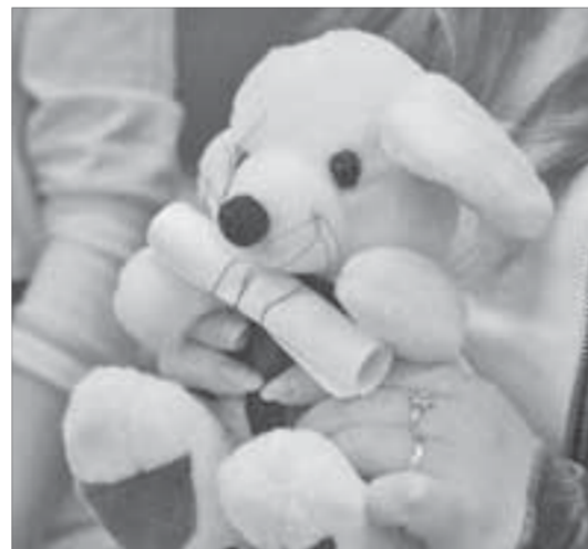
Мягкий "друг" может быть опасен

Именно по этим показателям Роспотребнадзор проверяет игрушечный рынок. В 2007 году после обследования 263 тысяч игр и игрушек