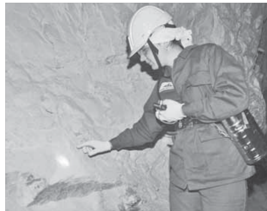
Руда переливается удивительными цветами