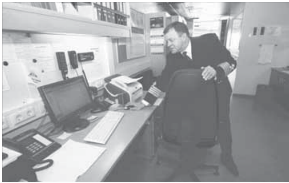
Спутниковые снимки ледовой обстановки будут поступать в капитанскую рубку в режиме онлайн

Динамичные азиатские экономики производят немало современного промышленного оборудования, по соотношению "цена – качество", возможно, наиболее привлекательного на мировых рынках. Уже из первого рейса "Мончегорск" должен доставить в Норильск новое промышленное оборудование для собственных нужд. В