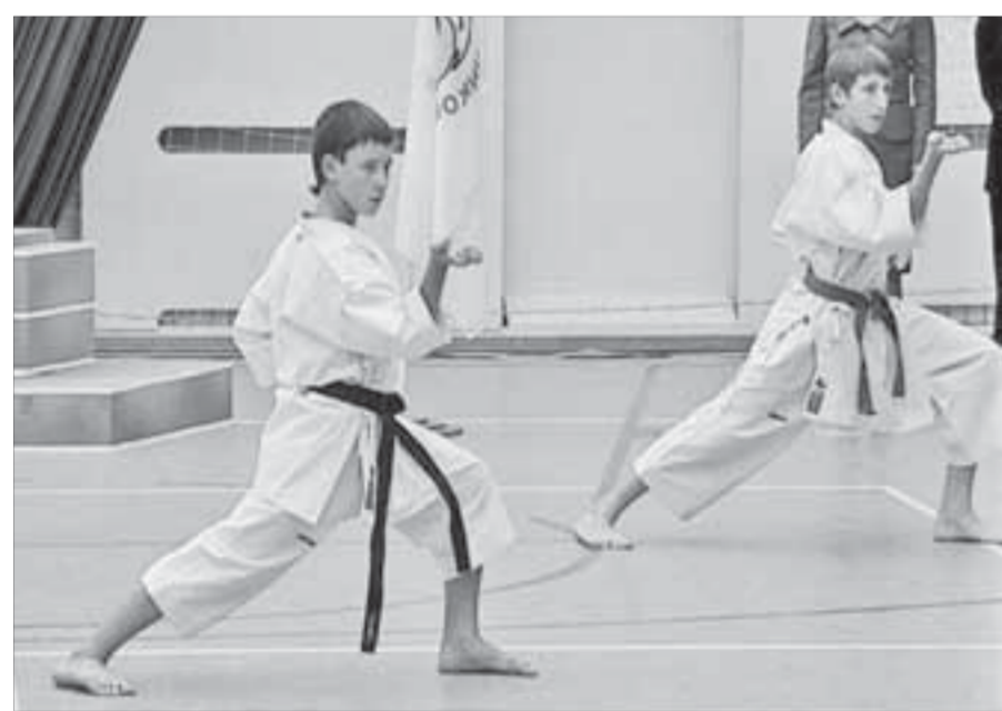
Каратисты доказали: настрой – залог побед

В центре здоровья «Олимпиец» прошло торжественное открытие спартакиады школьников.