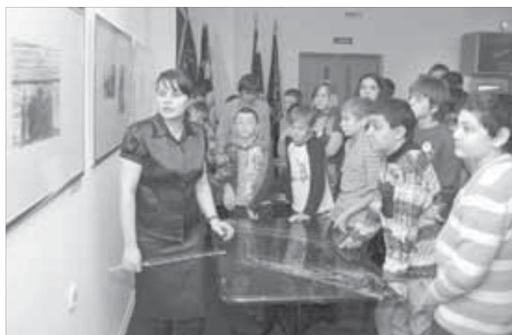
Урок компании в музейном формате