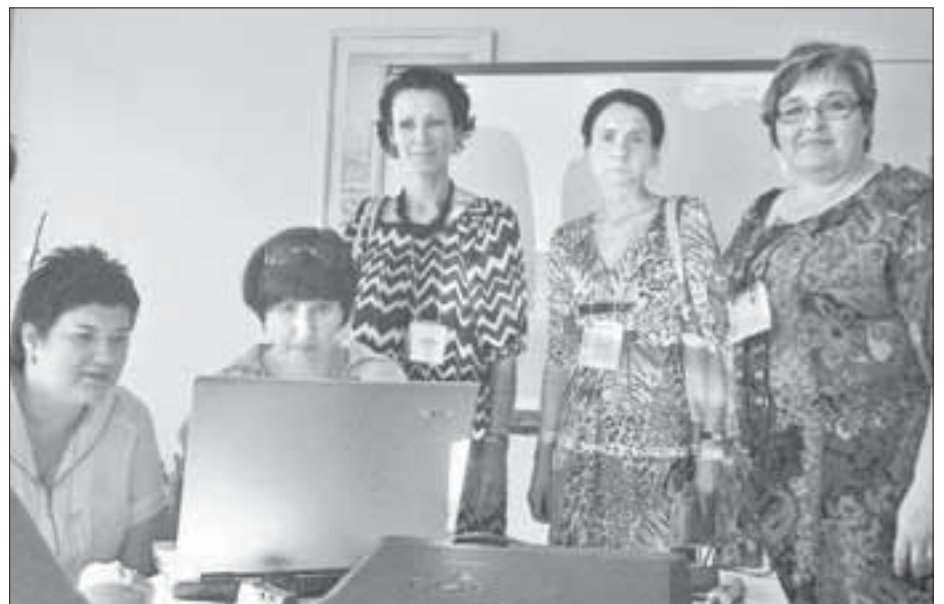
Педагоги охотно делятся друг с другом наработками и опытом

Резолюция Второго всероссийского педагогического форума, принятая участниками, являет собой обращение к профессиональному сообществу и руководству от-