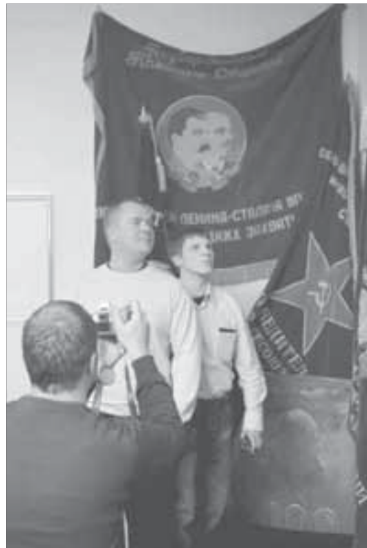
Веселые и знаменитые

Встречу не случайно назвали "Территория позитива": организаторы форума приложили максимум усилий для того, чтобы на время проведения встречи территория ННР действительно стала таковой. Это поможет укреплению дружеских отношений между молодежью компаний "Норильский никель".