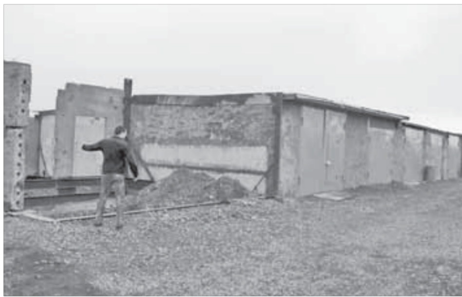
Стройка внесла раздор в товарищество "Звезда"

Вскоре из управления архитектуры и градостроительства участникам товарищества "Звезда" пришел ответ, что "сведения о предоставлении разрешения на условно разрешенный вид использования земельного участка для строительства объекта..." "Индивидуальный гараж" А.Ф.Ускову в управлении архитектуры отсутствуют" и "вам необходимо обратиться в управление имущества администрации города Норильска для проведения проверки". Если специалисты признают постройку самовольной, то