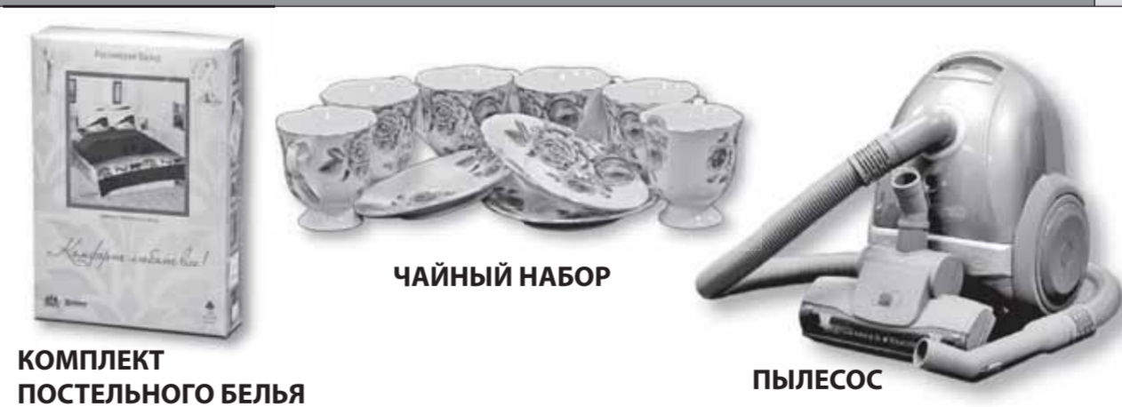
КОМПЛЕКТ ПОСТЕЛЬНОГО БЕЛЬЯ