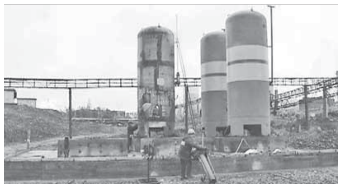
Полным ходом идет монтаж ресиверов