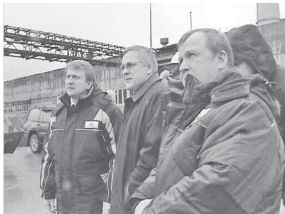
Работы будут завершены к 1 октября

В ликвидации последствий аварии на ТЭЦ-2 задействованы все профильные подразделения "Норникеля". Благодаря этому удается оперативно решать задачи, возникающие в ходе восстановительных работ. Последствия аварии не повлияли на срок начала отопительного сезона. Все запланированные подготавливающие мероприятия выполнены. По мнению энергетиков, проблем с подачей тепла и электроэнергии в жилой сектор и на предприятия в осенне-зимний период возникнуть не должно.