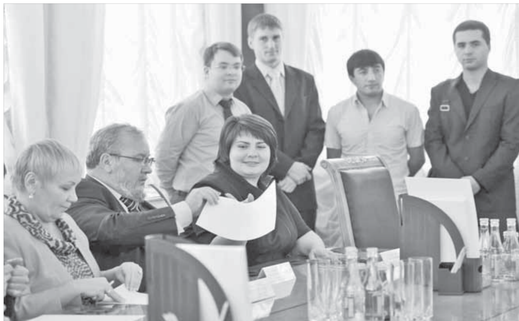
Координационный совет – идеальная площадка для диалога

В 2010 году национальное рейтинговое агентство присвоило фонду дистанционный рейтинг “АА” – очень высокая надежность, второй уровень. Что также было подтверждено в мае 2009 года.