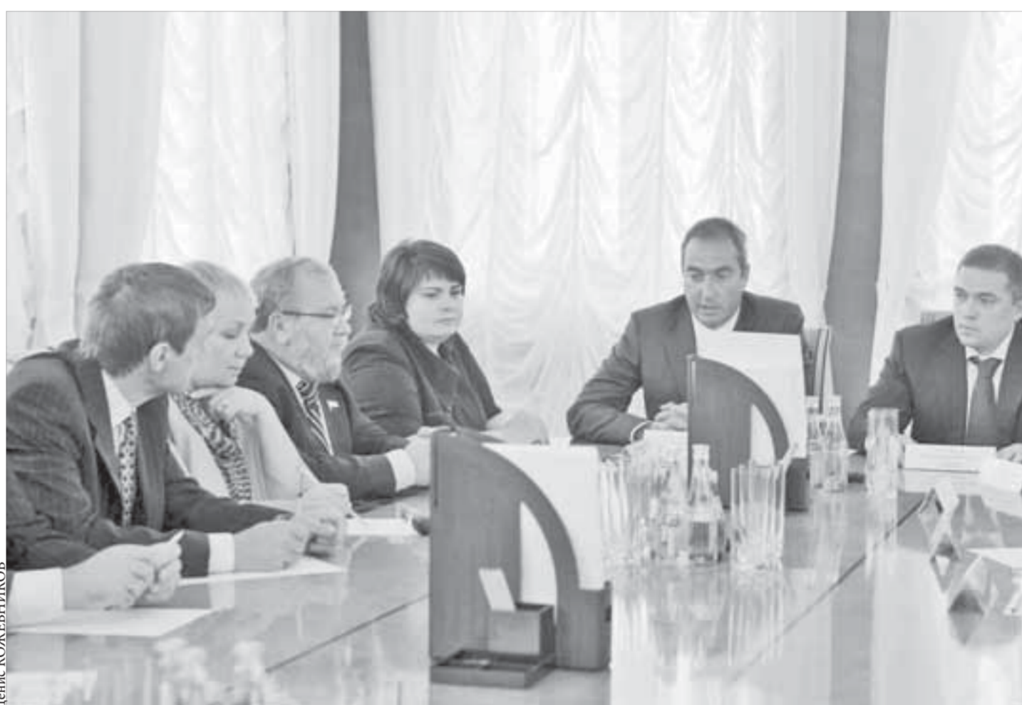
Вопросы обсуждались важные