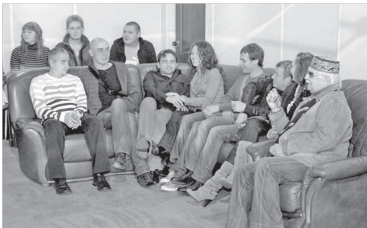
Никто не "выпал из гнезда"

К счастью, новый сезон начался без потерь в составе труппы. "Приобретения" прошлого года театр только радует. Впереди у Норильского Заполярного много интересной работы, в том числе и спектакль к юбилею. Празднование 70-летия театра намечено на ноябрь 2011 года.