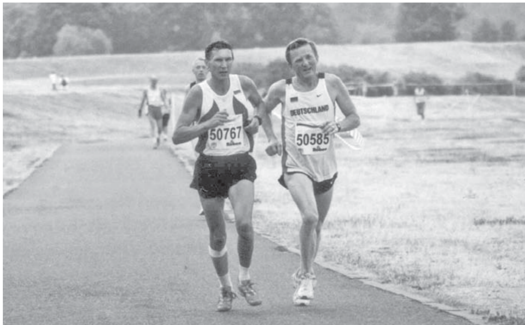
К победе по европейским дорогам