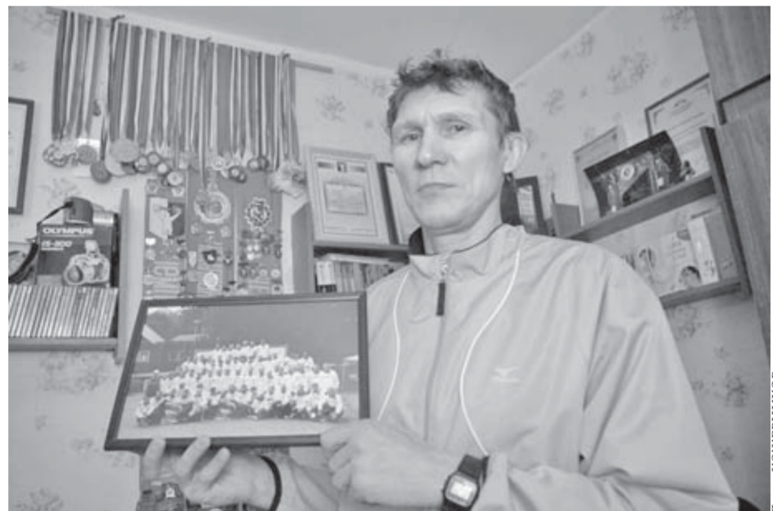
"Команда молодости нашей"