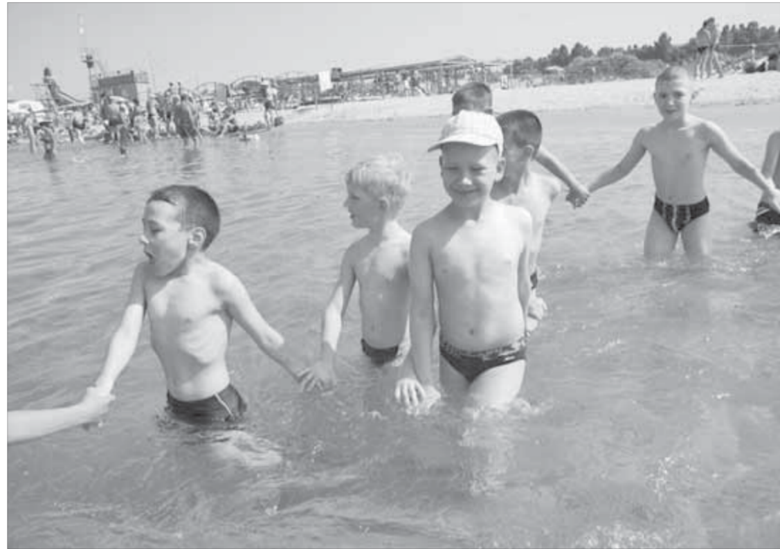
Норильские дети должны отдыхать на юге. И не только Красноярского края