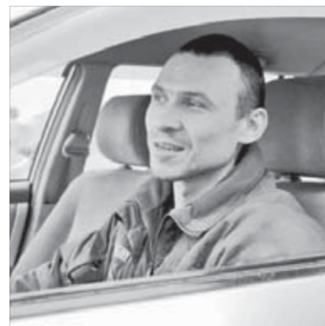
Водители довольны проезжей частью

В Норильске летом ямы и выбоины на дорогах за считанные часы превратились в ровное полотно. К удивлению таксистов, участок на улице Дзержинского, например, только что был открыт для проезда, а через полчаса пассажира приходилось везти уже объездным путем. Так же быстро знаки, запрещающие проезд, снимали, и водители ездил по гладкому, свежееуложенному асфальту.