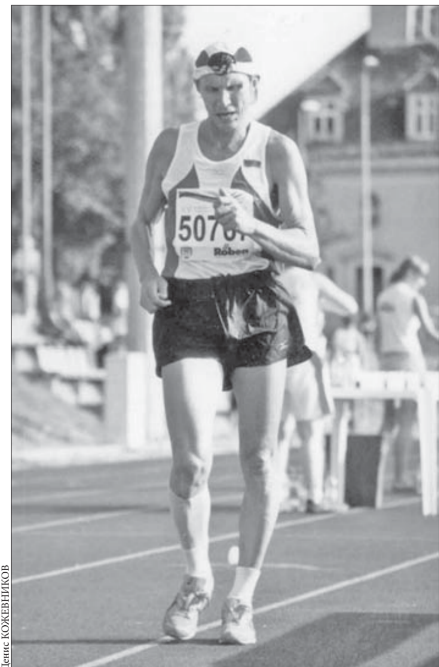
Дистанции – только марафонские