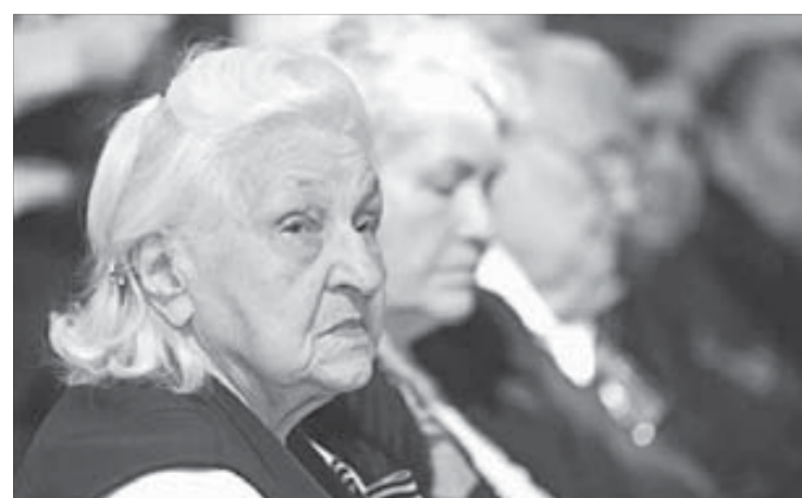
Вспоминать о войне трудно

В Городском центре культуры прошла встреча с ветеранами, посвященная окончанию Второй мировой войны. На ней вспоминали тех, кто бесстрашно защищал Родину в военное лихолетье. Ветераны делились воспоминаниями о том нелегком времени.