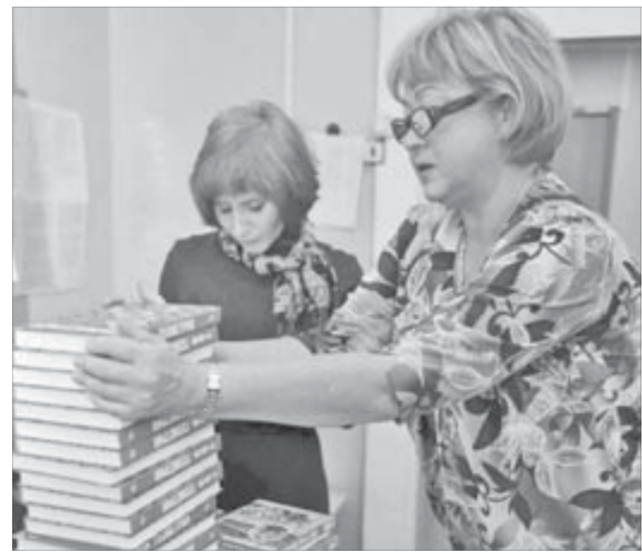
Обеспеченность учебниками – стопроцентная