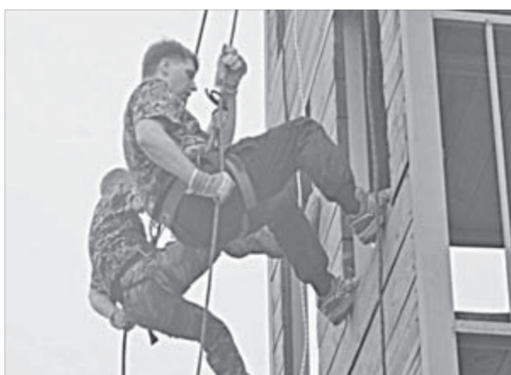
Норильские краверы на полосе препятствий

В первый же день при помощи армейского грима нам раскрасили лица и