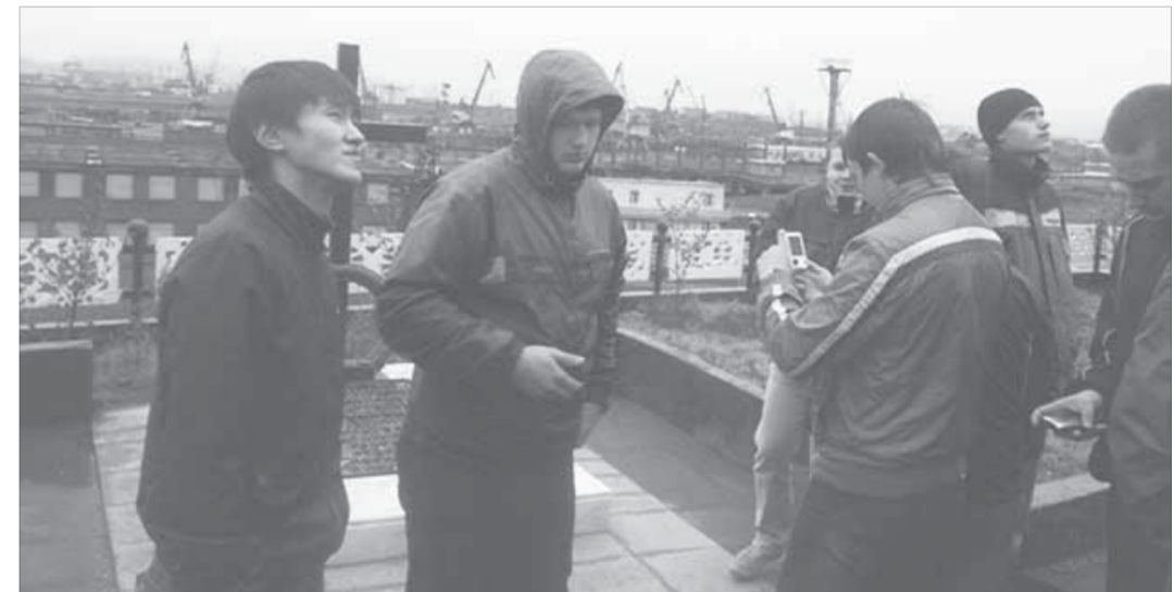
Стройотрядовцы и поработали, и отдохнули на славу

Лучшие из ребят были отмечены благодарственными письмами и корпоративными подарками.