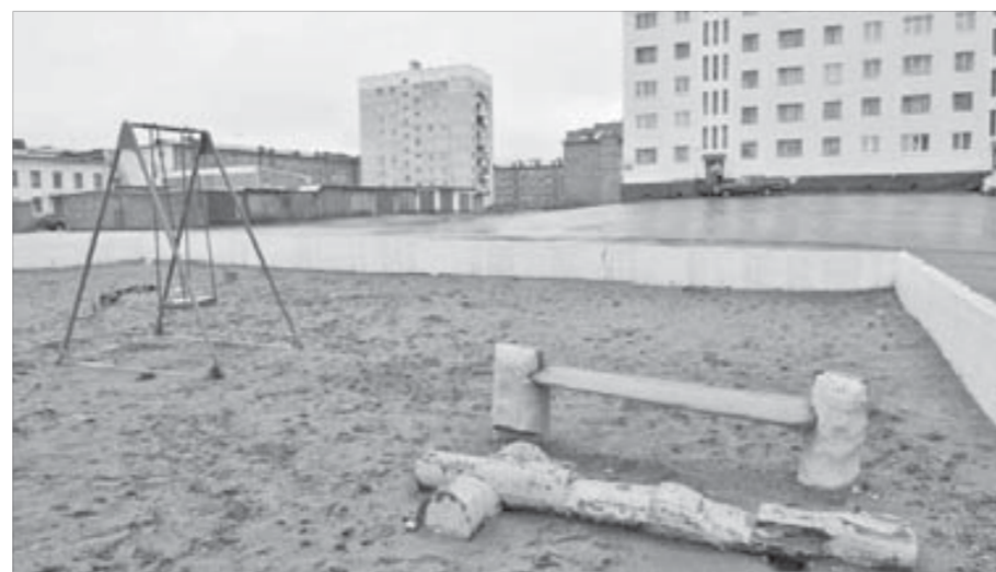
Скоро на детских площадках будет пусто

имчивые граждане вообще увозят на дачи. К сожалению, норильчане не задумываются: наступит следующее лето, и снова во дворах будут нужны скамейки. Что будем устанавливать?