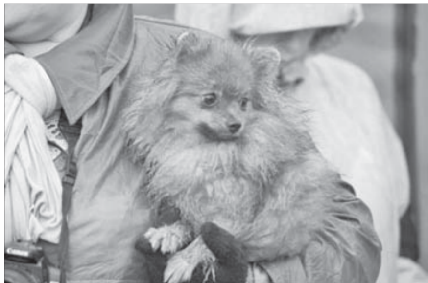
И зачем меня стригли и укладывали?

Прошедшее воскресенье погодой норильчан не баловало. Однако те любители пеших прогулок, которые все же отважились покинуть дома, могли стать свидетелями исключительного зрелища.