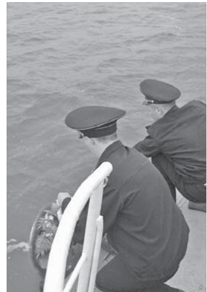
О подвигах надо помнить всегда