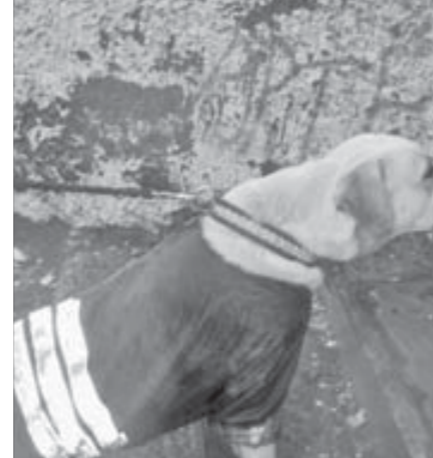
Где комбинезончик достал?

Организаторы сказали, что понимают трудности, с которыми сталкиваются врачи и собаководы, но помочь ничем не могут. Они сообщили, что следующая осенняя выставка тоже пройдет под открытым небом. Дело