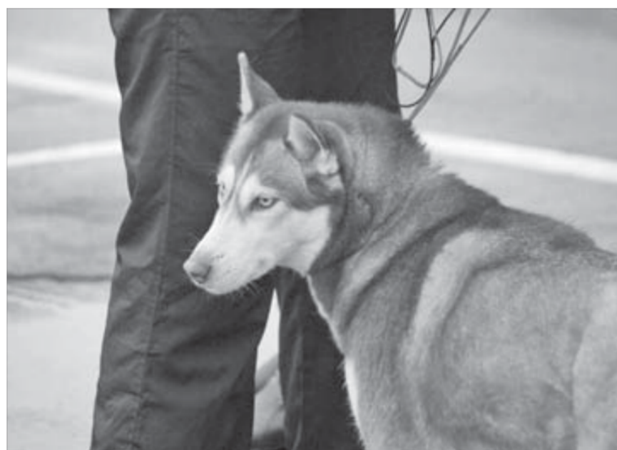
Голубоглазые хаски не боятся непогоды

в том, что норильчане не слишком охотно выставляют своих питомцев в сентябре. На осенние выставки регистрируется почти в два раза меньше участников, чем на весенние. Однако арендная плата, которую запрашивают владельцы подходящих помещений, одинаково высока в любое время года. Если выставка будет проходить в теплом зале, потребуются услуги гардеробщицы, а когда собаки покинут здание, за дело придется уборщице. Их труд тоже необходимо оплатить. Вот и получается, что проводить такое мероприятие осенью в закрытом помещении просто нерентабельно.