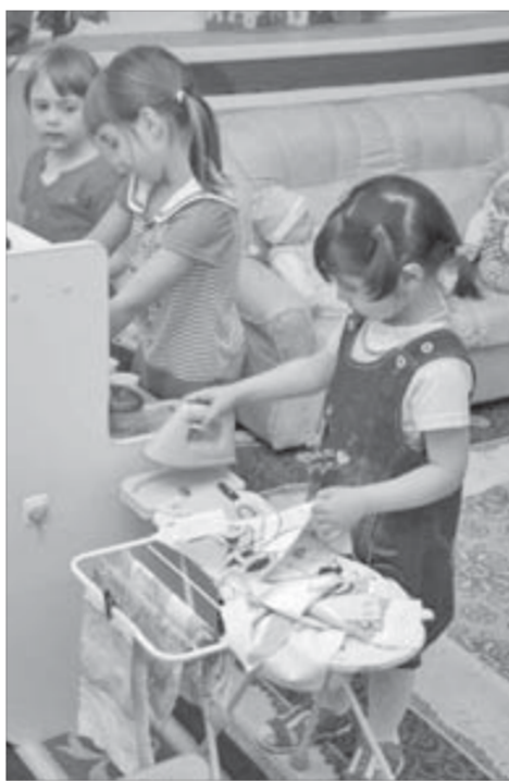
В коллективе играть интереснее

По многочисленным просьбам норильчан с 13.09.2010 изменен режим приема инспектора по вопросам устройства детей в дошкольные образовательные учреждения.