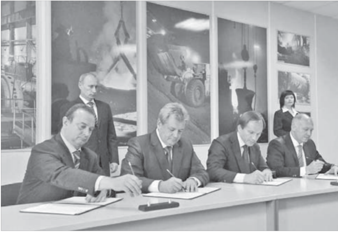
Соглашение устанавливает четкие правила игры