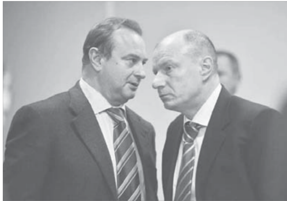
В центре внимания — развития Норильска и «Норникеля»

О том, что у норильчан должна присутствовать уверенность в стабильности и хороших перспективах «кормильца» — «Норильского никеля», заявил и глава «Интерроса» Владимир Потанин. Главное, что обсуждалось на масштабном совещании во вторник, отметил Потанин, — это вопросы развития Норильска и «Норильского никеля».