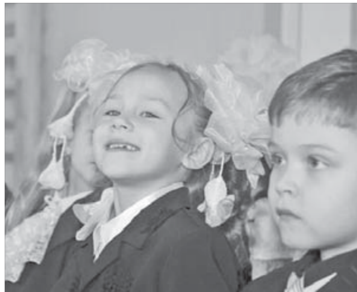
Старуху Шапокляк встречали смехом

Всем восьмидесяти девочкам и мальчишкам, впервые переступившим порог Страны знаний, вручили подарки от