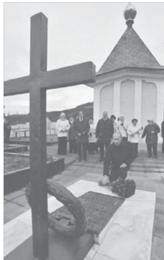
Владимир Путин возложил цветы на Голгофу