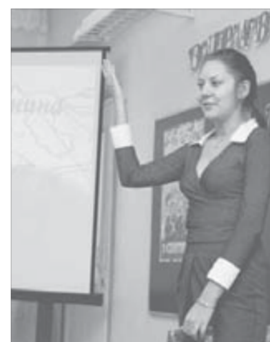
Теперь у них есть еще и шефы

...Артемам, Денисам, Алисам за школьные годы предстоит узнать очень многое, в том числе и об энергетике. Главное, чтобы все эти годы им было и тепло, и светло в стенах гимназии. В прямом и переносном смысле.