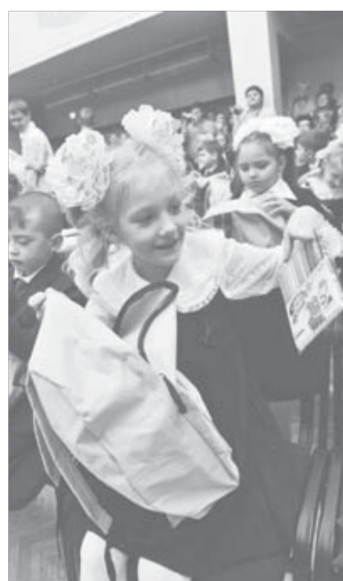
Подарки пришли по душе

1 сентября поздравить первоклассников школы №14 пришли шефы с никелевого завода.