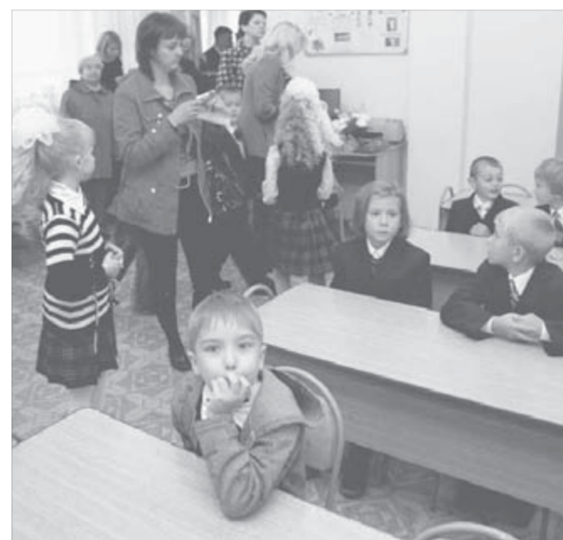
Перед первым уроком