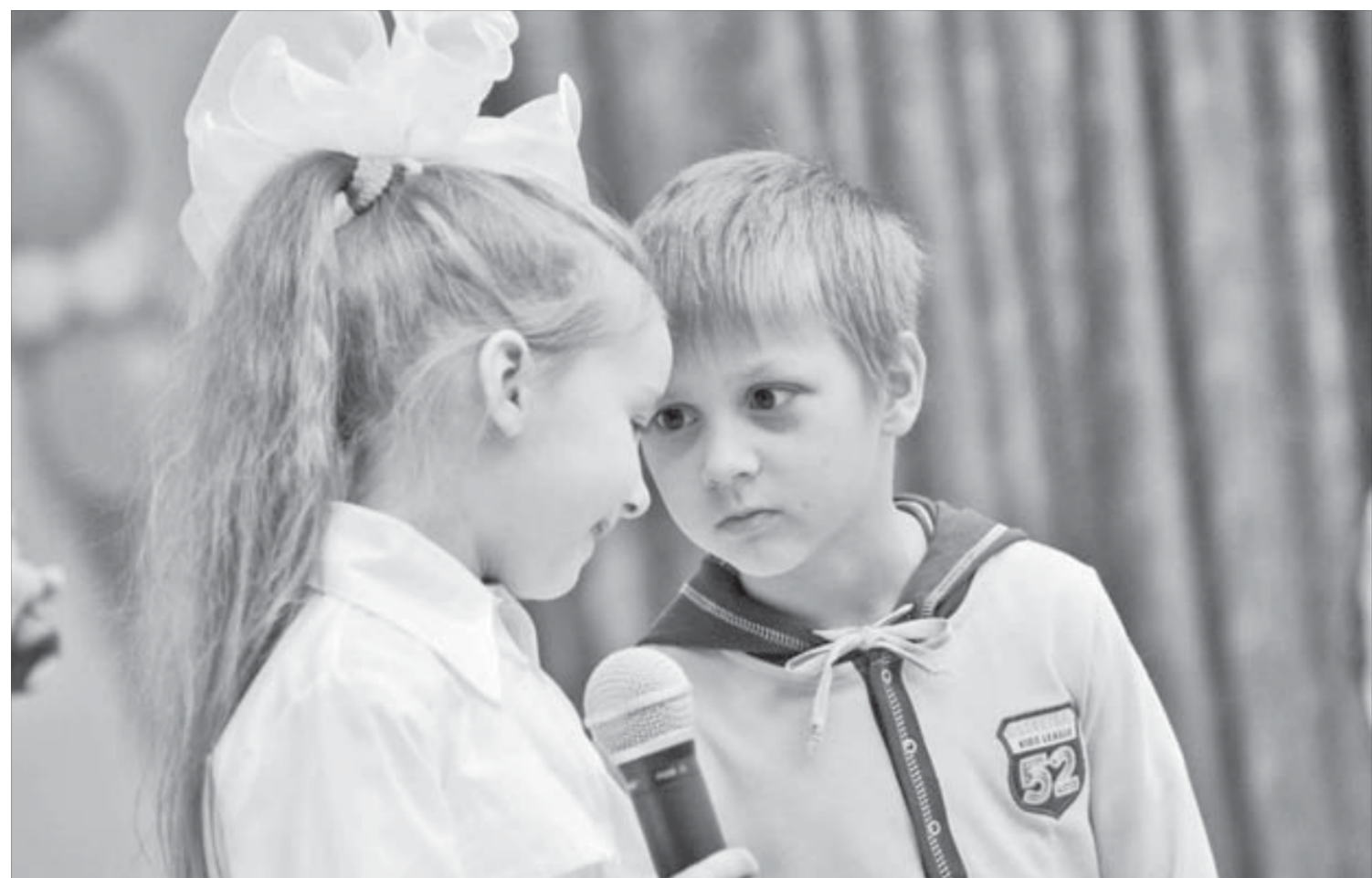
Забыл слова? Это не беда