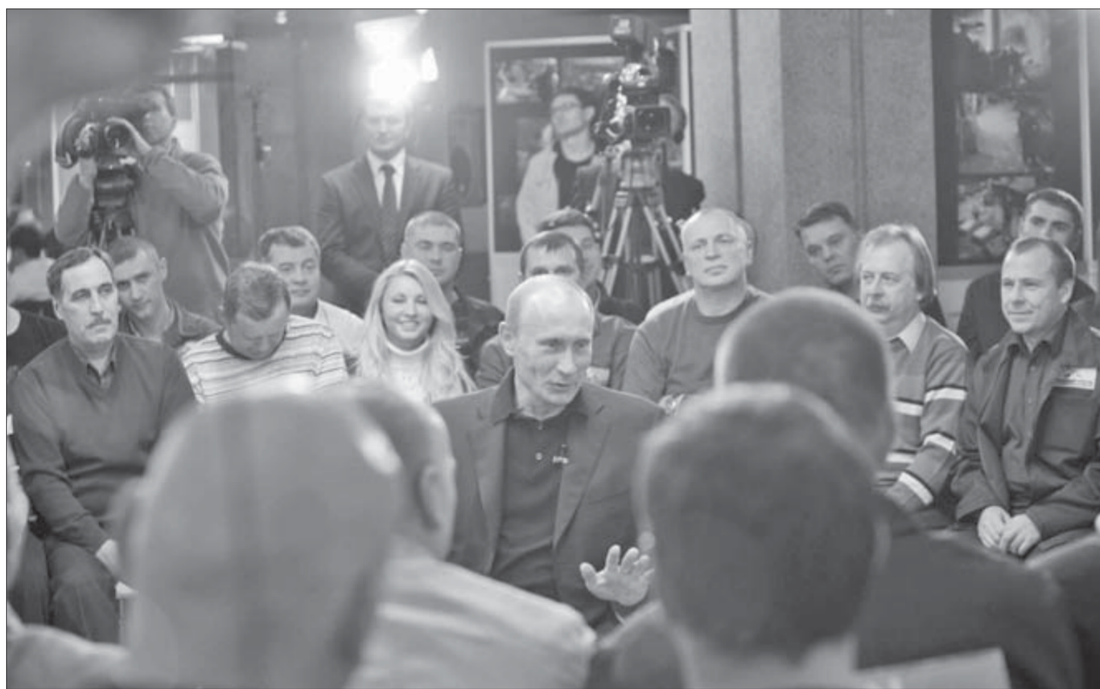
Премьер отвечал, спрашивал, дискутировал, шутил

Премьер-министр России Владимир Путин встретился с работниками Заполярного филиала "Норильского никеля" и ответил на вопросы, важные для норильчан.