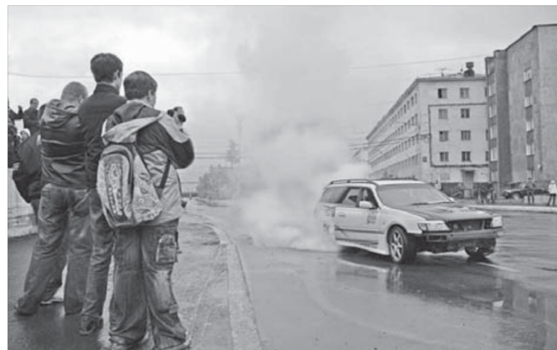
Дрифтинг на радость восхищенным мальчишкам

– Я очень много хорошего слышал о вашем городе. И мне очень приятно, что я сегодня здесь, с вами, приятно видеть ваши лица. Мне бы хотелось, чтобы ваша жизнь с каждым днем становилась все лучше, счастья вам и здоровья, – желает он собравшимся перед сценой талнахцам.