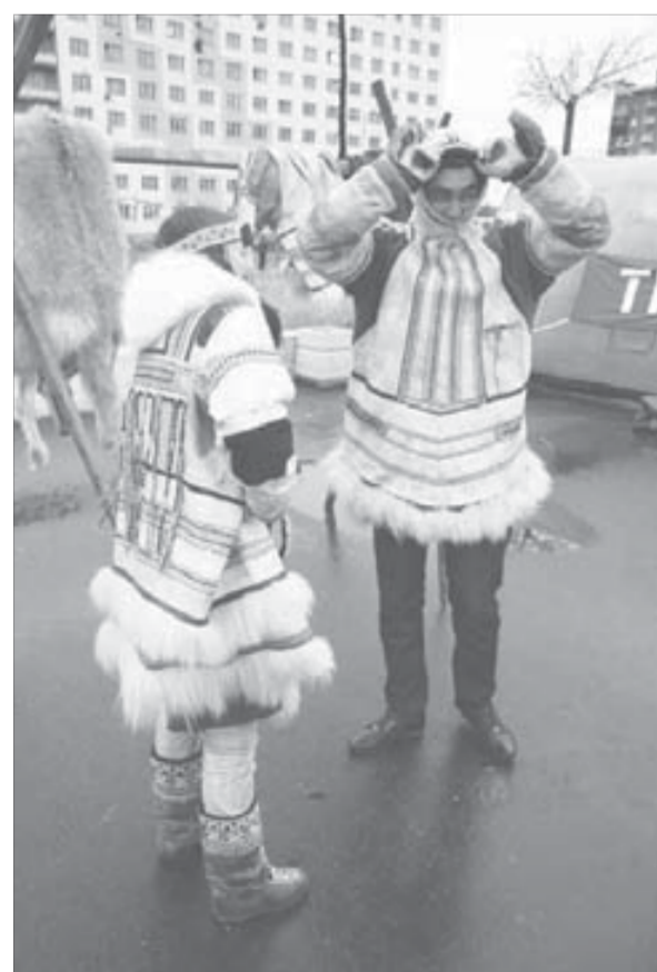
Цена фото в национальном костюме – 100 рублей

В минувшую субботу Талнах отметил День горняка. Несмотря на дождь и ветер, все прошло весело и интересно.