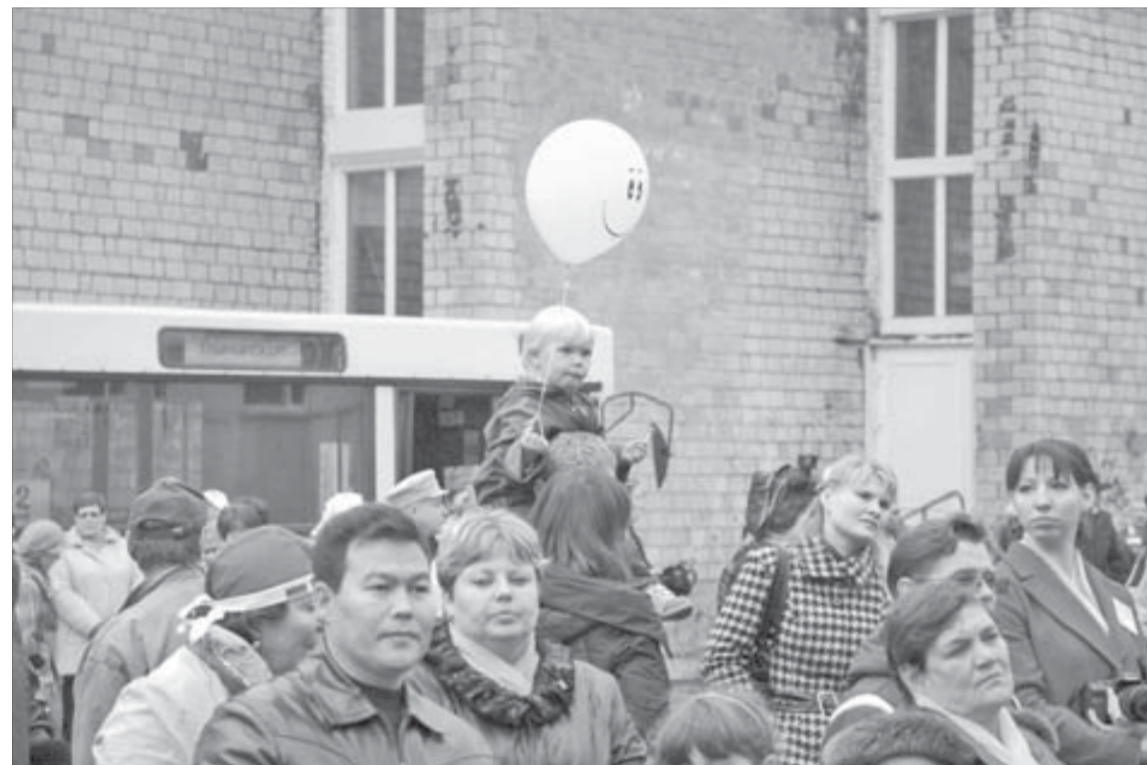
Все ждут главного подарка – выступления Александра Маршала

ГЦК в праздничный вечер традиционно становится местом встречи передовиков горного дела, работающих на различных рудниках – в Норильске, Талнахе, Кайеркане. Это не только заслуженный ударным трудом праздник, но и возможность поделиться своим опытом с коллегами, рассказать об успехах и проблемах. Что горняки с удовольствием и делали. Собравшихся здесь объединяет любовь к своему делу и то, что принято называть горняцким характером – открытость, прямота, надежность в мыслях и поступках. Крепкой кровли вам, горняки!