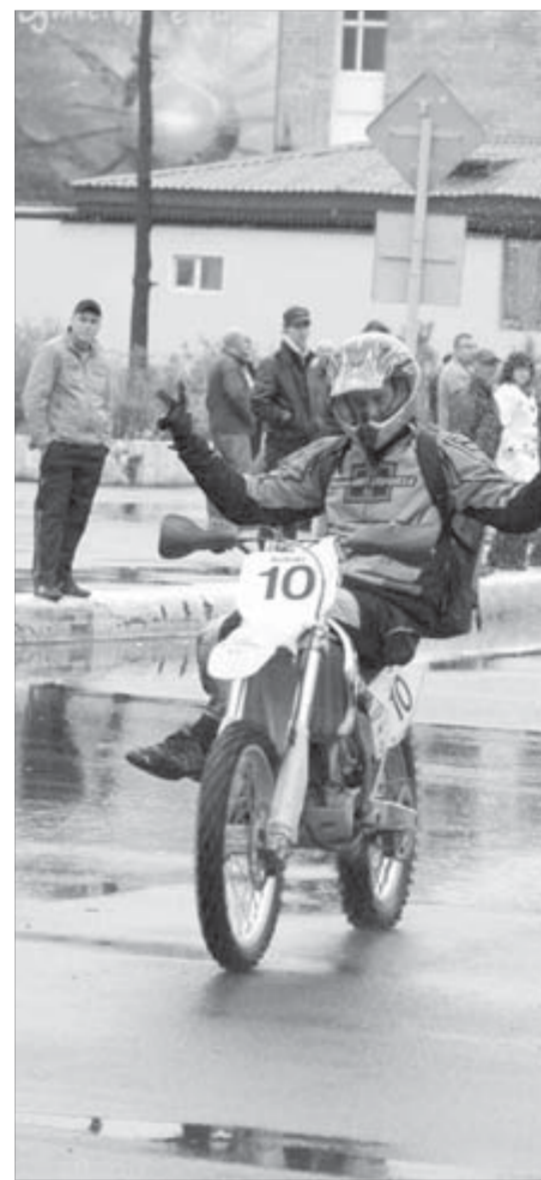
В честь праздника можно ездить и без рук

Народ счастлив и подпевает во весь голос, согреваясь не только песней, но и пивом. Впрочем, все ведут себя прилично, за полдня я не увидел ни одной пьяной драки, хотя без происшествий не обошлось. Но это уже другая история.