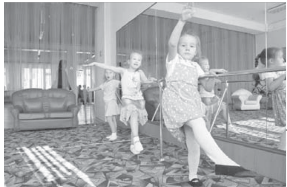
Первые па разучены в саду