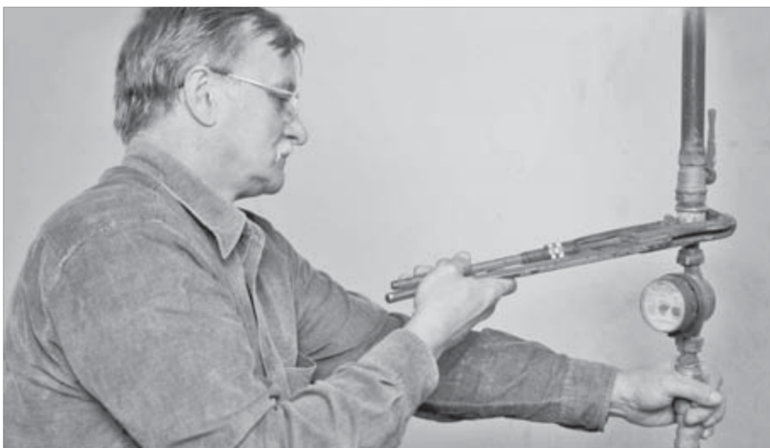
Установка счетчиков — мероприятие затратное, но необходимое