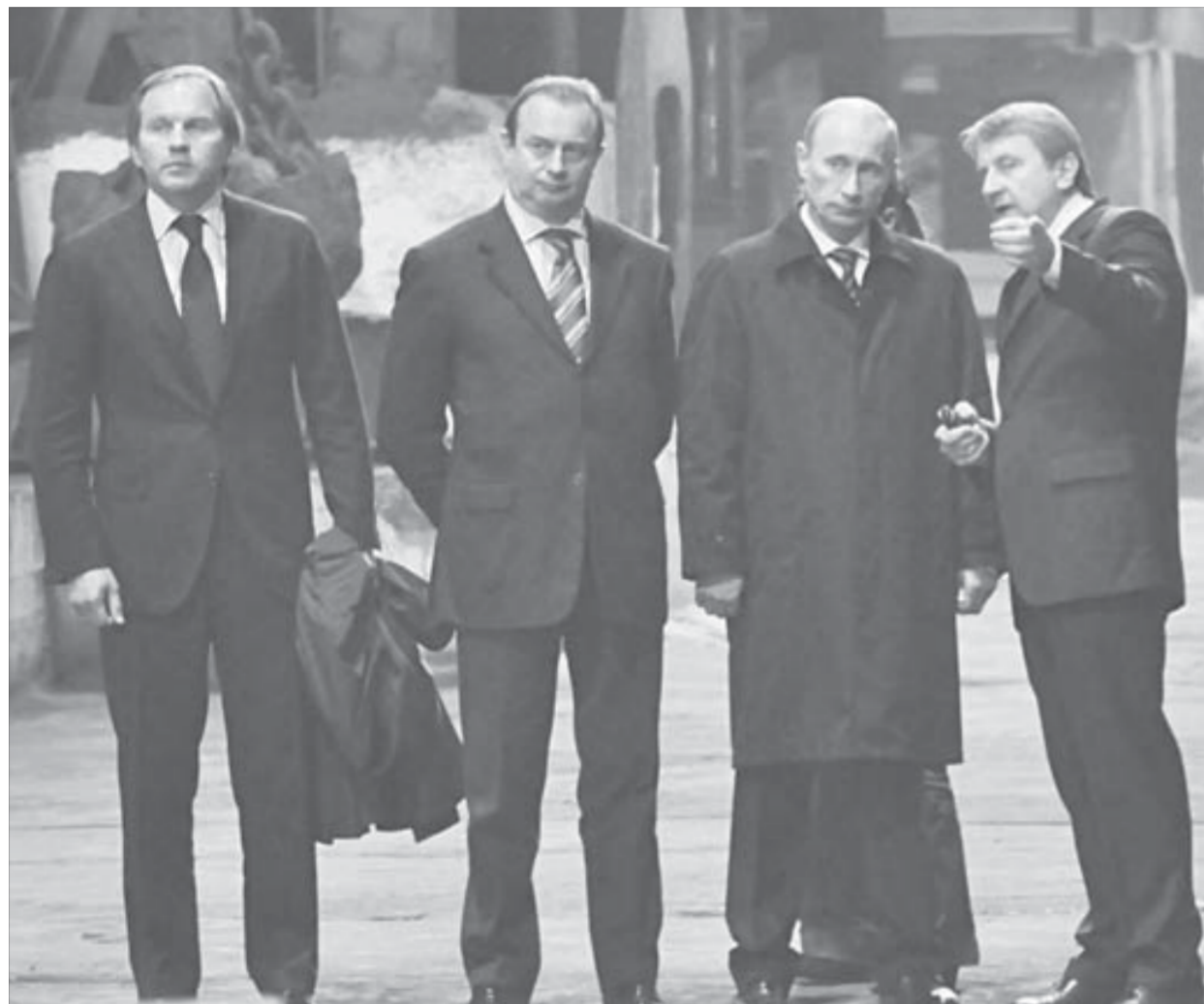
Проблемы у Норильска есть, но они решаемы, пришли к выводу участники встречи