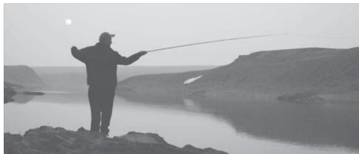
Экологический туризм на Таймыре будет развиваться