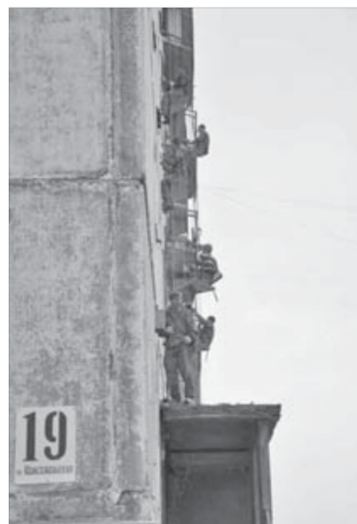
Альпинисты очищают стыки на Комсомольской, 19