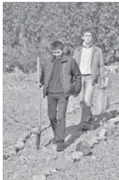
Тропинка к вышке выложена камнями