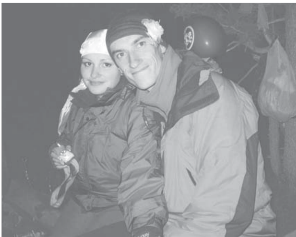
...и в тундру приехали мужем и женой

Свадьба на Ламе – событие невероятное. Прекрасный воздух, лишь однажды и ненадолго испорченный знаменитым норильским газом. Штиль, изредка нарушаемый ветром, приносящим заряды дождя. Постоянно меняющееся небо над озером. Праздник не испортили даже мошка и комары, которых было так много, что от них, казалось, шевелились кусты. Кстати, вероятно, в преддверии скорых холодов комары готовы были пить кровь прямо на лету. Нетронутая человеком природа, разве что на берегу кое-где виднелись бутылки изпод водки, оставленные рыбаками. А сколько грибов! И каких! У девушек на то, чтобы собрать небольшое пластиковое ведерко даров природы, уходило 10–15 минут. А уха и грибной суп! А голец, пойманный только что!..