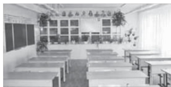
Как теперь физику не полюбить?!

Их подсвечивают специальными лампами. Со временем здесь разместятся и другие кубки. Благодаря витрине почета у ребят появится новый стимул к победам.