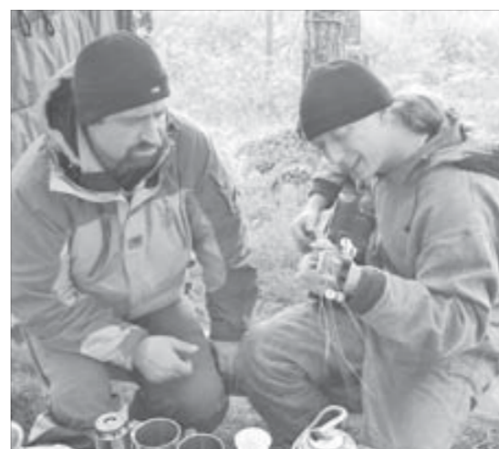
И задушевные любимые песни!