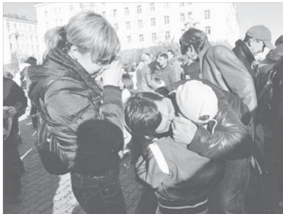
Вчера были только слезы радости