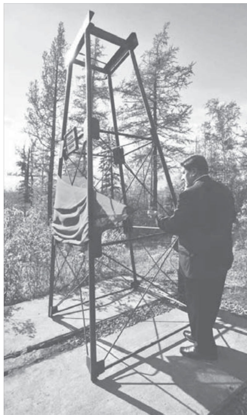
С этого места пошли талнахские рудники