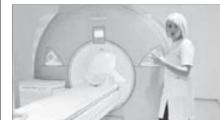
Нужное оборудование стоит миллионы