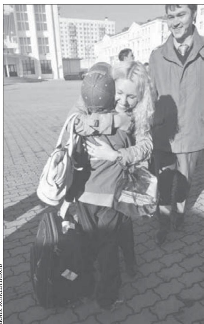
Как наши дети повзрослели!

Вчера в Норильск из Анапы вернулись дети, отдохнувшие в санаторно-оздоровительном лагере "Вита" 42 дня.