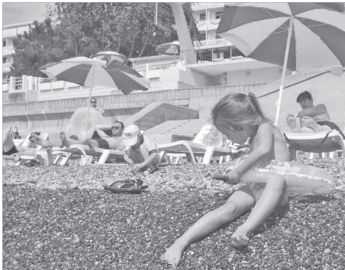
Летом работники компании отдыхают шикарно – и в «Заполярье», и за границей