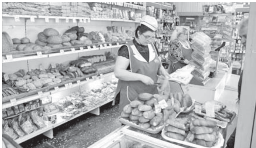
Цены в "Горячем хлебе" самые низкие

"Станичного" здесь такая же, как и в большинстве других магазинов города: 46 и 50 рублей соответственно. Зато пшеничный "кирпичик" можно купить за 35 рублей, а на ценнике молочного батона вообще значится 28 рублей. Возможность повышения стоимости хлебобулочных изделий, а также муки в ближайшее время в "Раздолье" категорически отвергают.