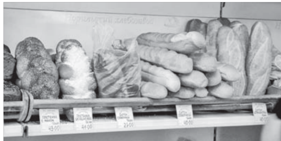
Цены не изменились