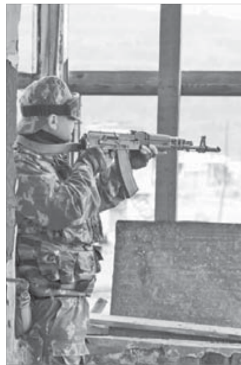
База без охраны – повод для захвата