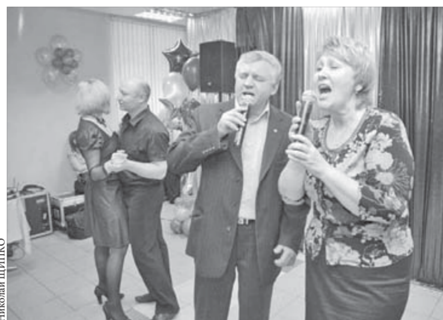
Такое исполнение тронет даже искусственную публику