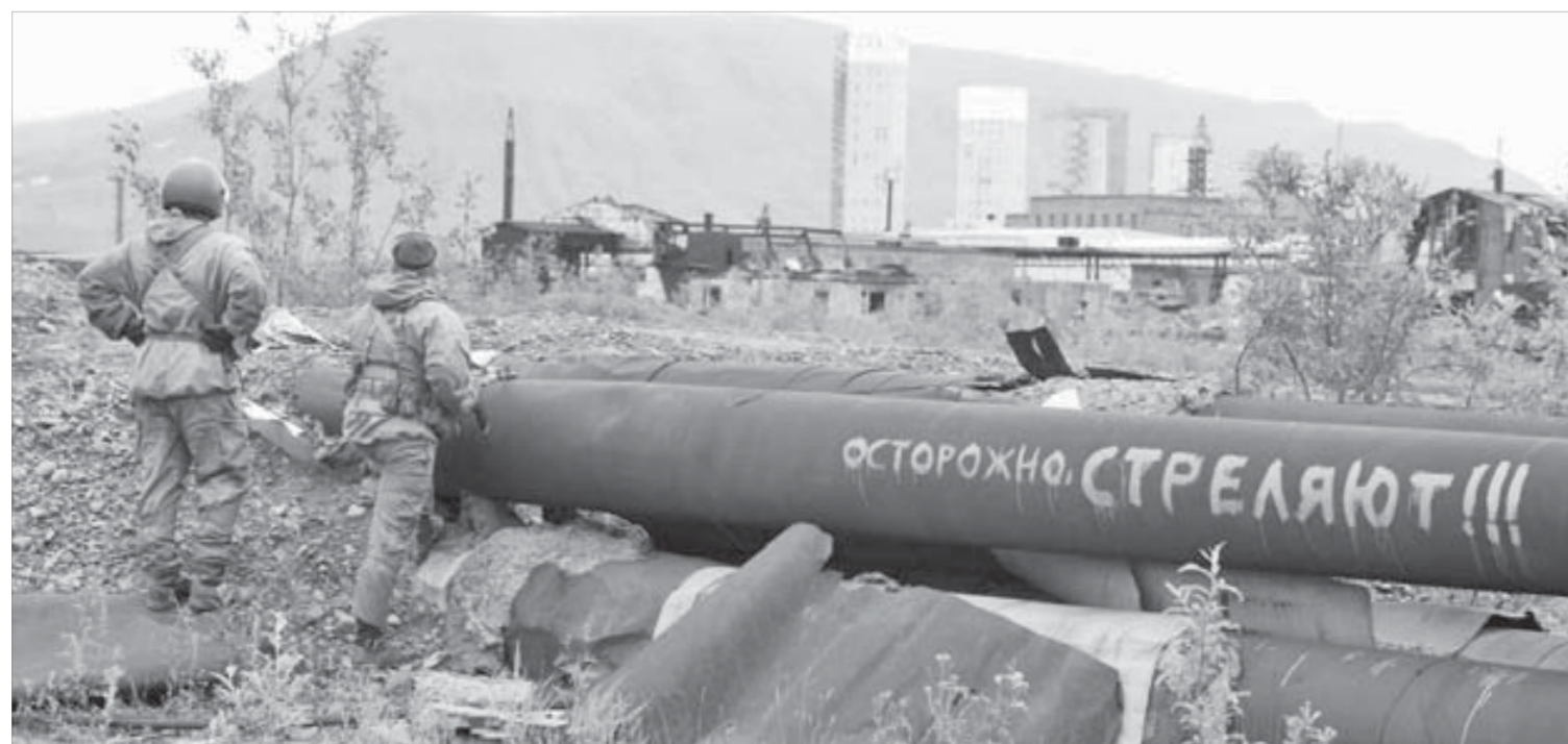
Что-то враг там замышляет...