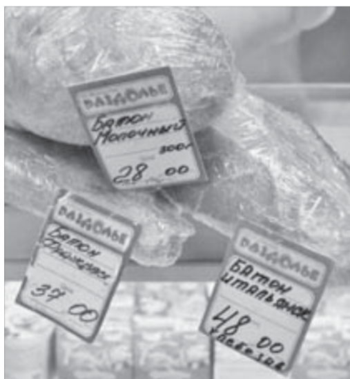
Разброс цен большой

Цены на изделия хлебозавода в других торговых точках заметно выше. В магазине "Юбилейный" пшеничный хлеб продается за 36 рублей, "Заполярный" можно купить за 46 рублей, а "Станичный" стоит полсотни. Люби-