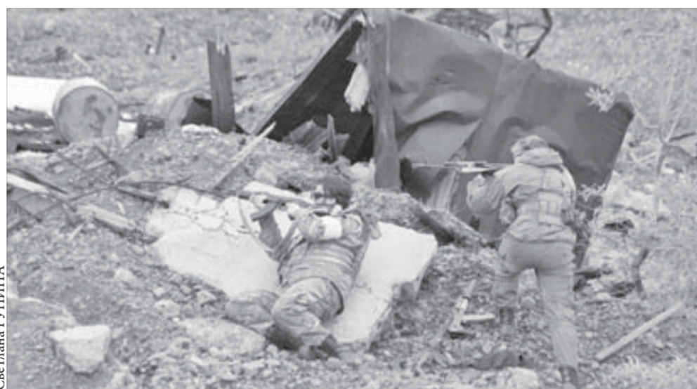
Эти и пленных могут взять

Описывать игру – не хватит и газеты. Плотная борьба, непрерывная стрельба и