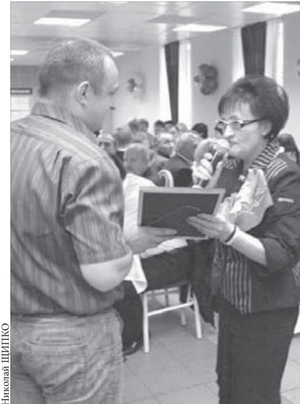
На "Заполярном" много людей, достойных наград

Курс акций ОАО "ГМК "Норильский никель" – 5083,5 рубля. ОАО "Полюс Золото" – 1380,3 рубля.