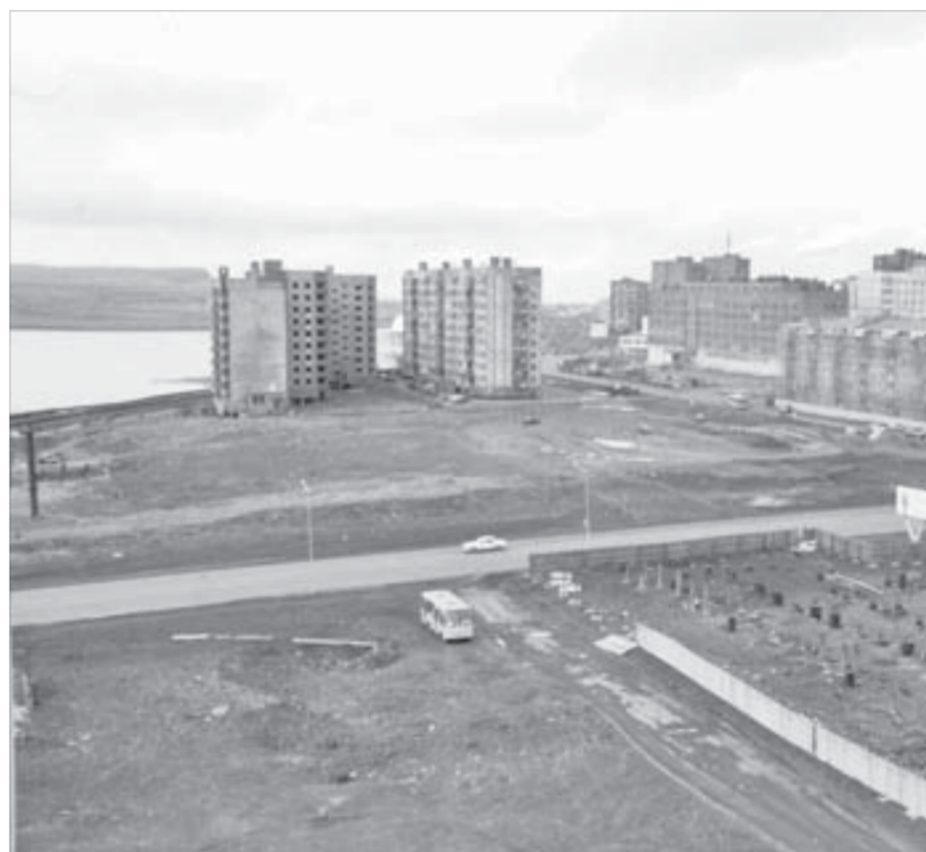
Место воплощения лучшей идеи