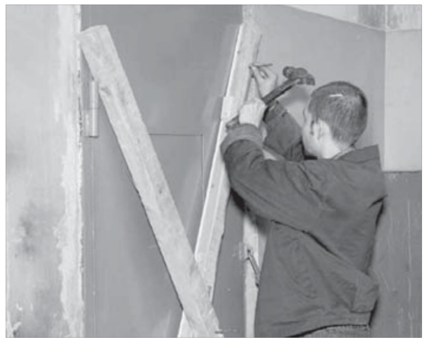
Если закон примут, должники могут лишиться своего жилья

Кроме того, не платят за квартиру, как мы уже говорили, обычно одни и те же люди. У многих из них есть для этого вполне уважительные причины. Прежде всего — непомерный рост тарифов на услуги ЖКХ, который по темпу давно опередил рост заработной платы. И в этом смысле против законопроекта выступают даже коммунальщики.