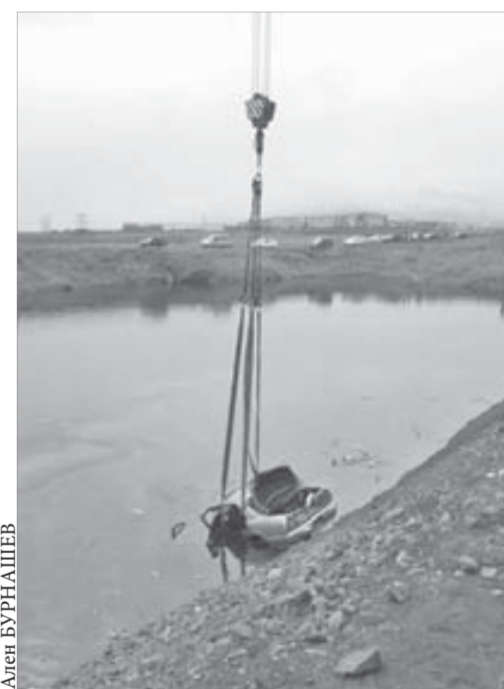
Подлодкой автомобиль был поднят

В воскресенье автомобиль достали из водоема. Для этого спасатели в водолазных костюмах завели стропы под машину, и автокран поднял со дна иномарку, которая вряд ли подлежит восстановлению. Эта операция привлекла множество зрителей – автокран установили поперек трассы, и за 30–40 минут в обоих направлениях образовались пробки.