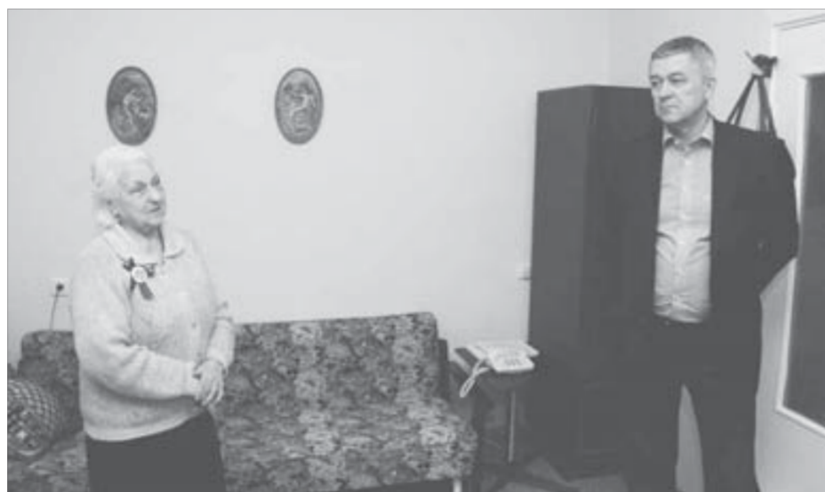
Все детали представители “Энерготеха” обсудили с ветераном

монт. Шесть – в стадии выполнения. К слову, одну квартиру ООО “Энерготех”, так же как и две другие управляющие компании Норильска – ООО “Жилищная компания” и ООО “Нордсервис”,