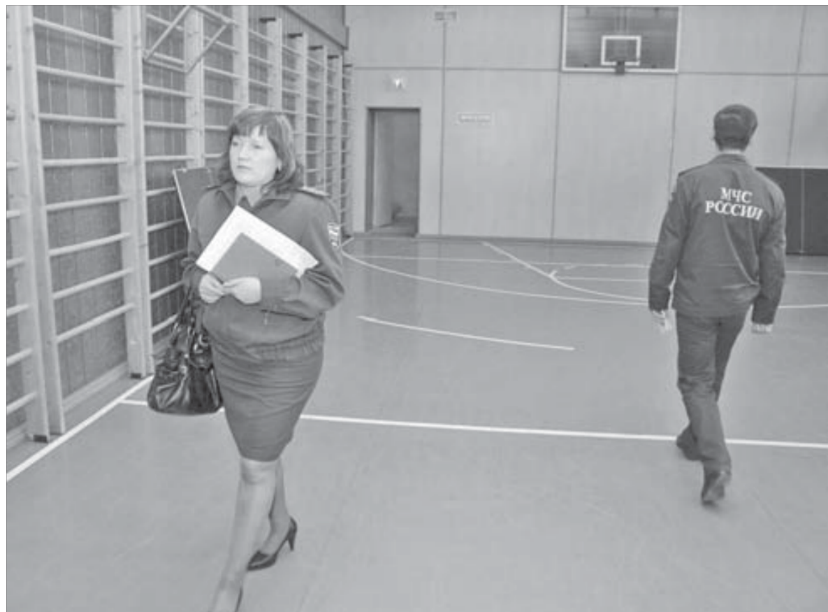
Главное — безопасность