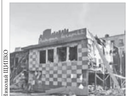
Заведение сгорело дотла

Вчера на месте случившегося работали дознаватели отдела Госпотребнадзора. Причины пожара, виновные и размер ущерба устанавливаются.