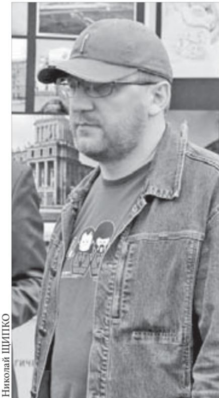
Жизнь художника Бычкова насыщена

Десять лет назад, когда началась перестройка в управлении и мы стали