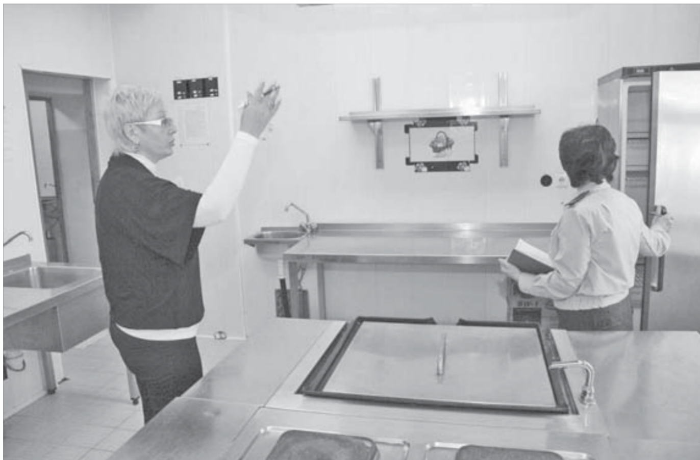
Хороший пищеблок – непременное условие для приемки школы