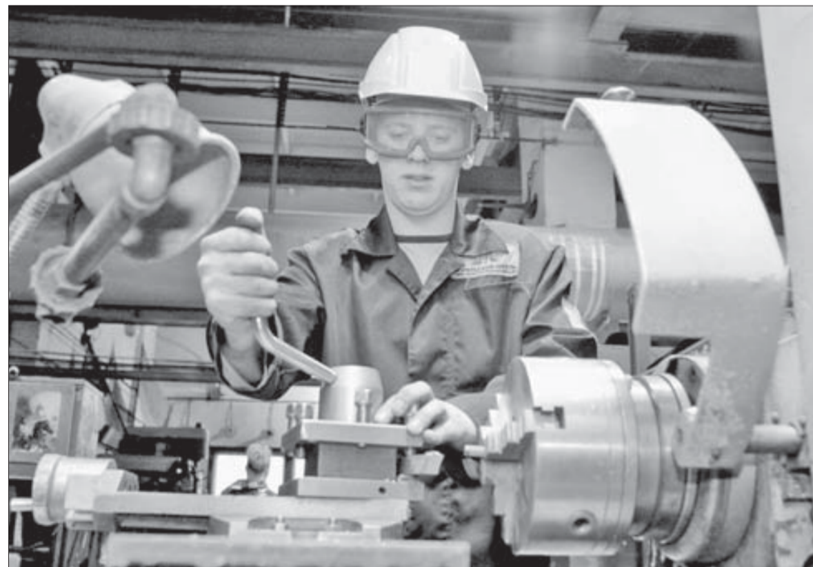
В России таких предприятий немного

Совокупный объем инвестиций в Nkomati со стороны "Норникеля" превышает 200 млн долларов. Данный проект предполагает добычу не только никеля, но и других побочных металлов – меди, кобальта, хрома и металлов платиновой группы. Планируемые объемы производства на проекте Nkomati в 2010 году: никель в концентрате – 8,1 тыс. тонн, медь в концентрате – 3,9 тыс. тонн.