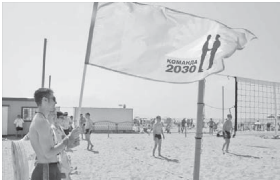
Молодые специалисты все как на подбор

Сейчас в Норильске около 2,5 тысячи доноров. За первое полугодие 2010-го на станции переливания заготовили 2 тонны цельной крови, не считая ее компонентов — плазмы, тромбоцитарной массы и других. Все это ежедневно требуется больницам и поликлиникам города. С начала года наши доноры сдали кровь 4500 раз.