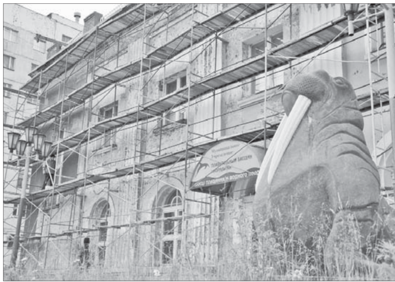
Любители плавания зорко следят за объектом

Позданный ремонт бассейна – плановое мероприятие, начатое еще в 2008 году в рамках программы город-