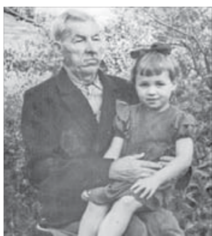
Нынешняя владелица ложки на коленях у прадеда

добавило ложке биографии. Заслуженная ложка. По сути – символ оптимизма и памятник всем жителям "изменников" Родины. Всем ГУЛАГу.