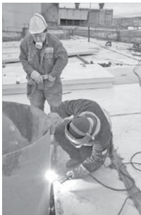
Пока нет дождя, можно заняться сваркой

Идти не близко. Запах газа усиливается. В плавильном цеху, через который ведет нас старший прораб, мы судорожно прижимаем к лицу респираторы, вызывая недоуменные взгляды работающих здесь людей. Наконец останавливаемся у пожарной лестницы УПЭС. Сколько, интересно, метров здание в высоту? Впрочем, сколько бы ни было, а подняться на самый верх я не решаюсь. Фотокар, бросив на меня укоризненный взгляд, бодро топает по железным ступенькам за нашим провожатым.