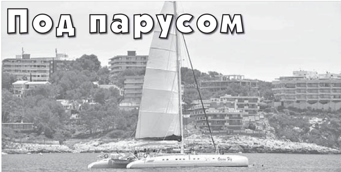
Норильчане, будет и на вашей улице праздник

Даже на отдыхе журналист не изменяет своей профессии и использует любую возможность, чтобы получить новые впечатления. Да и вообще, какой норильчанин откажется выйти в море под парусом? Особенно когда погода располагает, а побережье Costa Dorado так и манит разнообразить шикарный пляжный отдых.