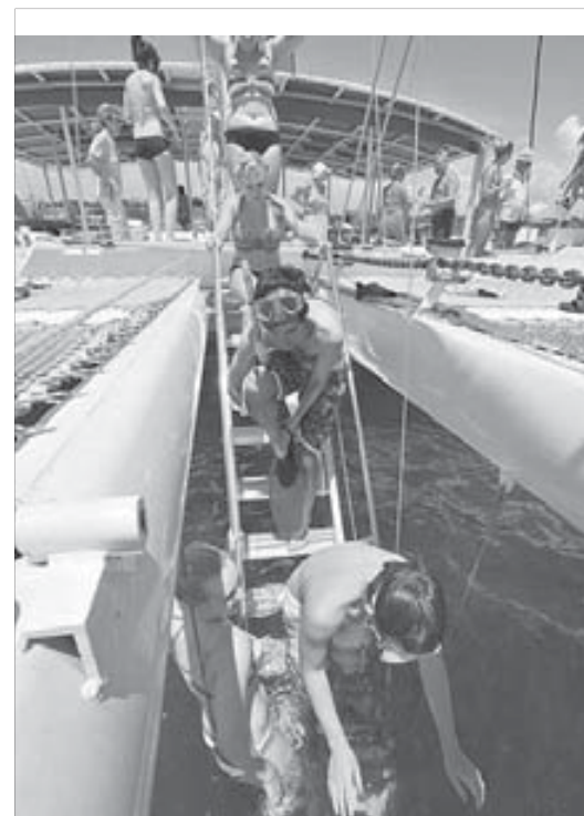
Не покидает мысль: мало ли кто там на дне голодный...