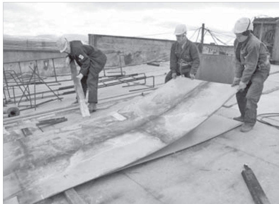
Кровлю нужно успеть заменить в срок

– Крепкого здоровья. Хорошей заработной платы. Семейного спокойствия и благополучия. Когда дома хорошо – и на работе все будет хорошо. Это самое главное.