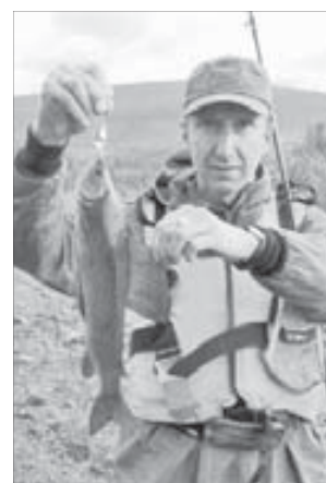
По-настоящему щедрая рыбалка

Дальнейшие планы грандиозные. Если будет возможность, то в следующем году участники сплава хотели бы посетить множество других красивых мест на Таймыре. И если удастся, они с удовольствием пройдут с озера Аян через реки в Хатангу. Это будет уже совсем другой водораздел, и путь займет недели три, а то и месяц. Хотелось бы пройти и по реке Кутарамакан, которая впадает в Хантайский водораздел и Енисей. В общем, есть планы, есть надежды, есть силы и поддержка. Все у них получится.