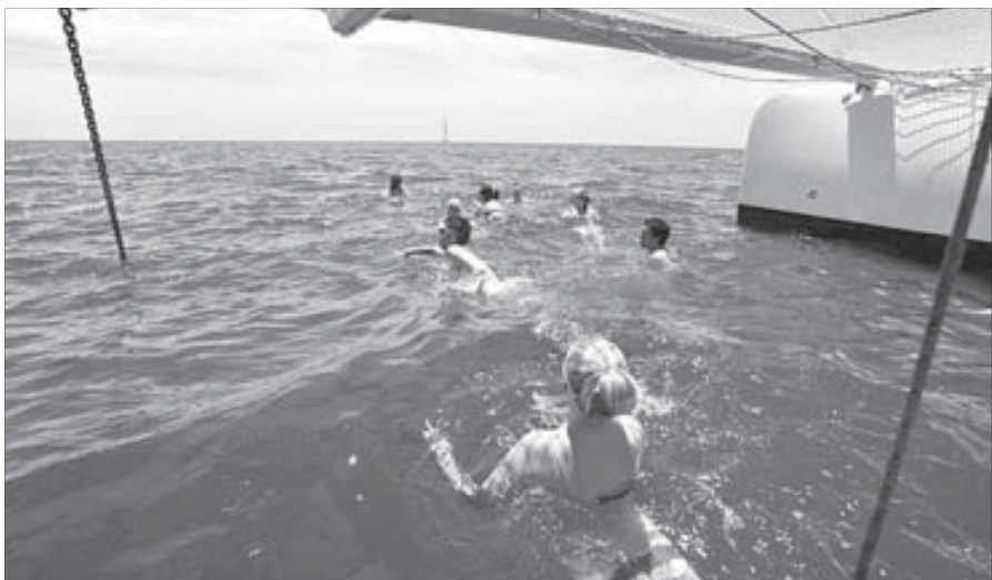
Купание в открытом море изрядно заряжает

Кто не знает, катамаран – это судно из двух корпусов, соединенных между собой палубой. В центре мачта, ходовой мостик или что-нибудь еще на выбор и вкус судовладельца. В нашем случае между двумя лодками находилась стойка бара. Тоже неплохо. Пассажиры могли расположиться в какой угодно части палубы под навесом. А для особо впечатлительных натянули сетку между носами двух корпусов катамарана прямо над средиземноморской волной. Здесь разместились веселая компания подростков, безостановочно тархтящих на английском, две русскоговорящие молодые пары и семья с двумя детьми. Остальные участники экспедиции предпочли остаться в разумном удалении от прямых солнечных лучей, поближе к барной стойке.