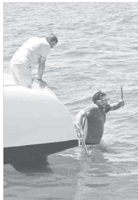
Есть подозрение, что весь спектакль разыграли для туристов