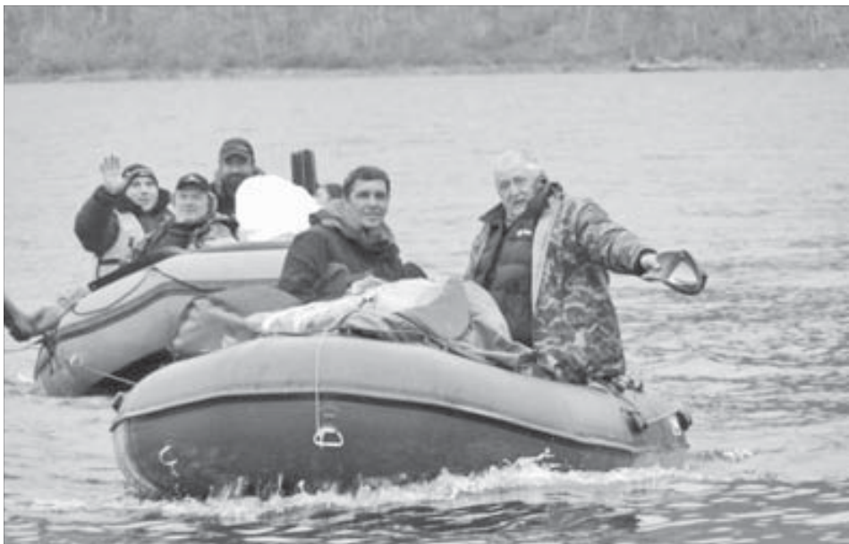
“Это нам по силам, это мы можем, это мы сделаем!”