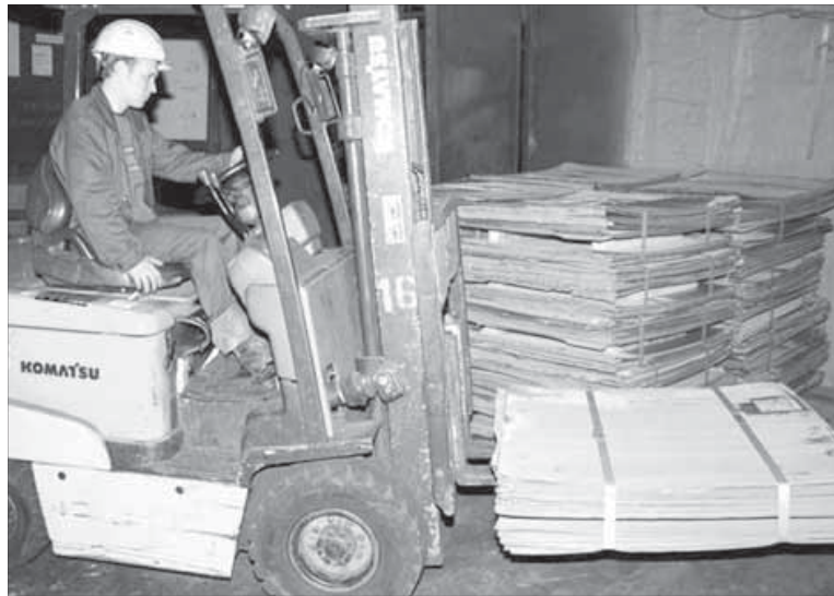
В металлургическом цехе КГМК

В пищевом производстве вдвое вырос выпуск водки, на 21,4% – майонезной продукции, на 16% – цельномолочной продукции, на 8,6% – колбасных изделий, примерно так же – кондитерской продукции, на 7,5% – рыбы и рыбных переработанных и консервированных продуктов. Производство электроэнергии увеличилось на 13,6%, теплоэнергии – на 6,5%.