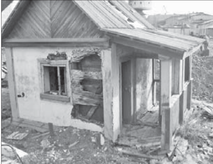
Вахта в рабочую зону