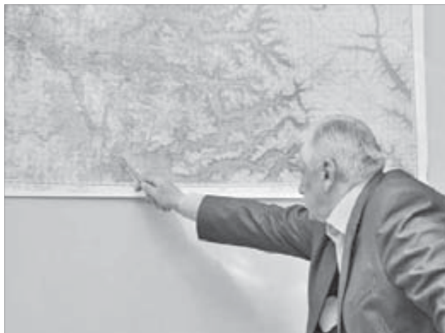
Они прошли уже более трех тысяч километров

Участники шли по озеру Кета около 19 часов, дважды уходили от шторма. Был момент, когда тучи разошлись, выглянуло солнце и стало так тепло, что даже полу-