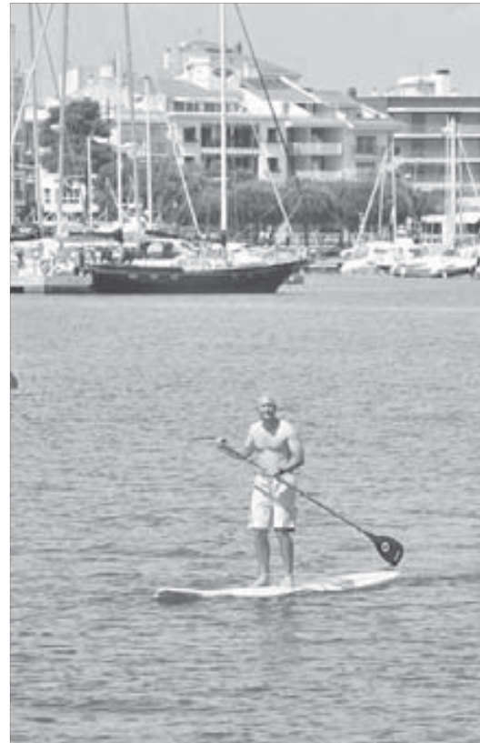
Далеко такие не уходят

...Только один турист трудился практически наравне с испанскими мореходами – я. Что поделаешь, профессиональный долг превыше всего – других не берут в журналисты. Правда, пока снимал эту занимательную эпопею, совсем забыл про необходимость беречь свое изнеженное Заполярье тело от испанского солнца. Зато теперь можно смело говорить, что я сгорел на работе. Коллеги подтвердят.