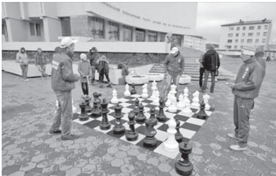
«Этот Шифер ни за что не сможет угадать, чем буду я ходить»

Главной «фишкой» мероприятия на Театральной площади должны были стать уличные шахматы, доставкой которых озаботились представители одной из молодежных организаций. Впрочем, необычные шахматы