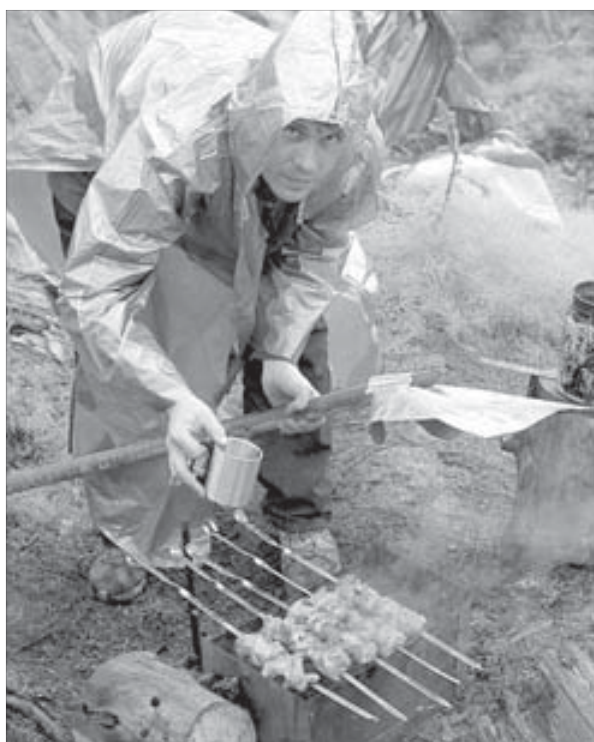
Шашлык, смоченный дождем