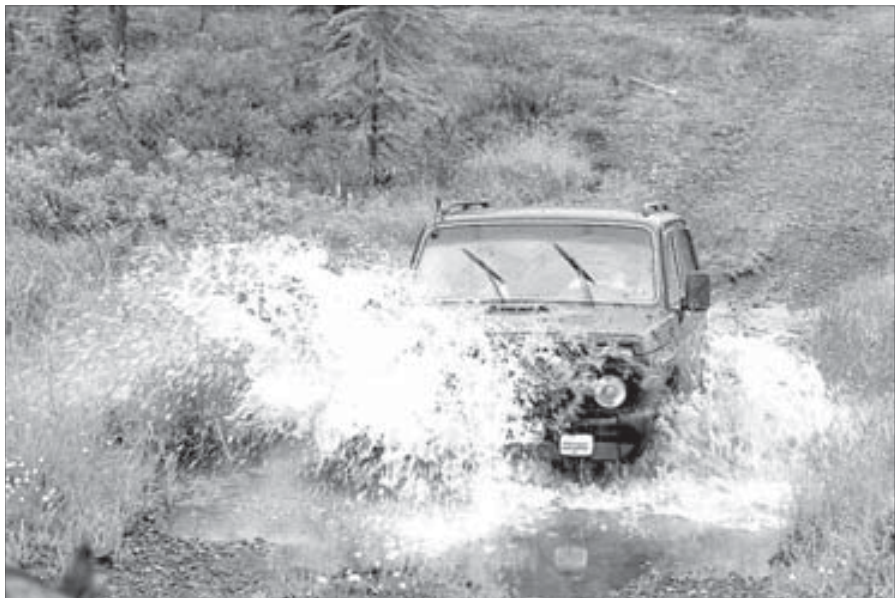
Тундровые дороги июля