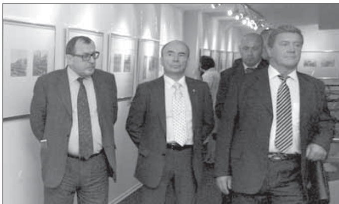
На юбилейных торжествах

Но все-таки ура газете! Особенно “Заполяренному вестнику”!