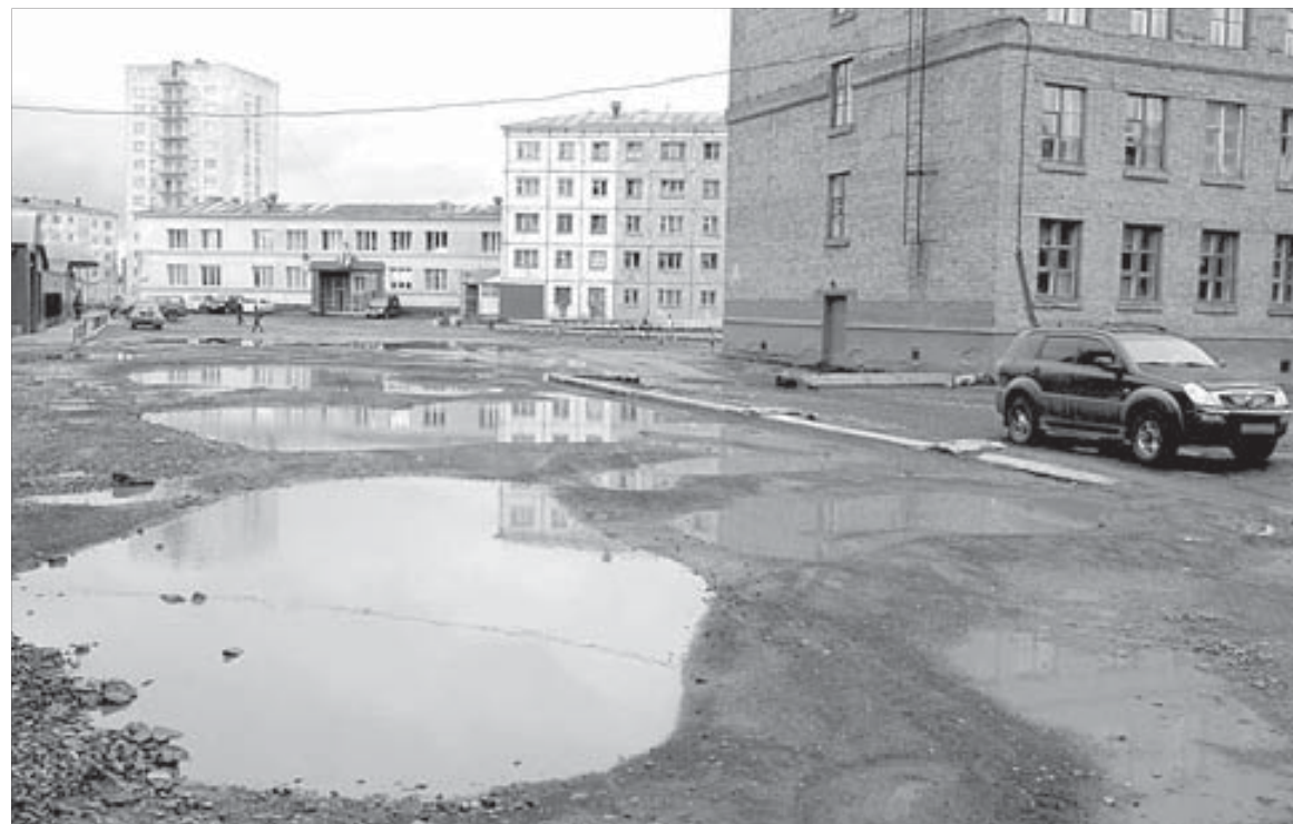
Без сноровки на Металлургов не обойтись