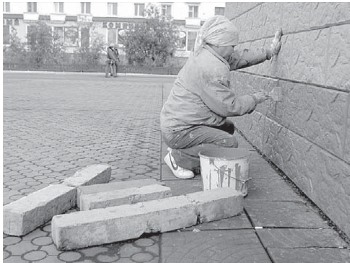
Будет как новенький