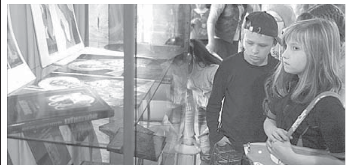
Подрастающее поколение готовилось к празднику с огромным интересом