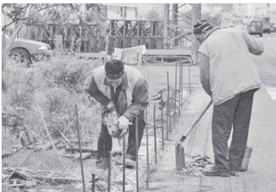
Работа на Ленинском кипит