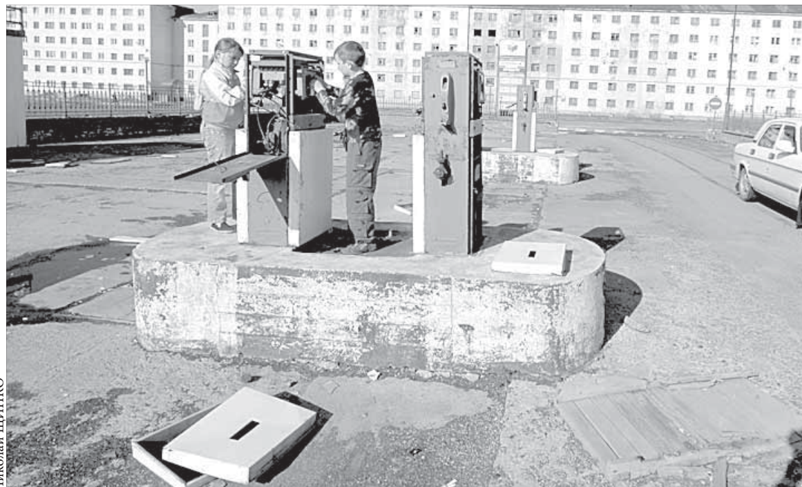
Брошенная заправка безобразна и опасна

— Через эти лужи может проехать разве что внедорожник, — говорит водитель. — Владелец другого автомобиля рискует повредить днище машины. Но даже я лишний раз стараюсь не ездить по этой дороге.