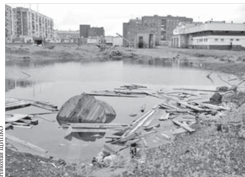
Там, где когда-то был парк, теперь жуткое болото

Работы по благоустройству города в самом разгаре. Стараясь успеть привести в порядок улицы и дома к окончанию лета, народ не жалеет сил. Спешит покрасить и отремонтировать различные объекты. Но не все районы города могут похвастаться чистой и порядком.