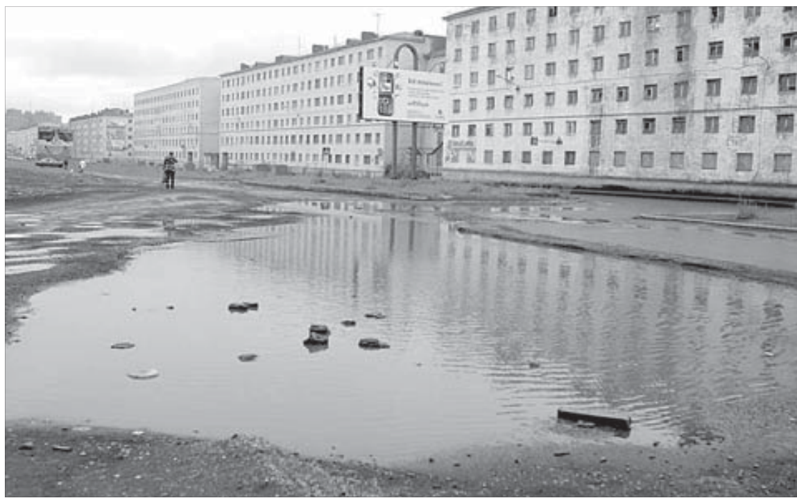
Въезд к Главпочтамту уже снится нам в кошмарах

здесь передвигаться осенью и весной. К остановке подойти практически невозможно! Заброшенная автозаправка напротив почты не радует глаз. А на другие участки в городе я не жалуюсь.