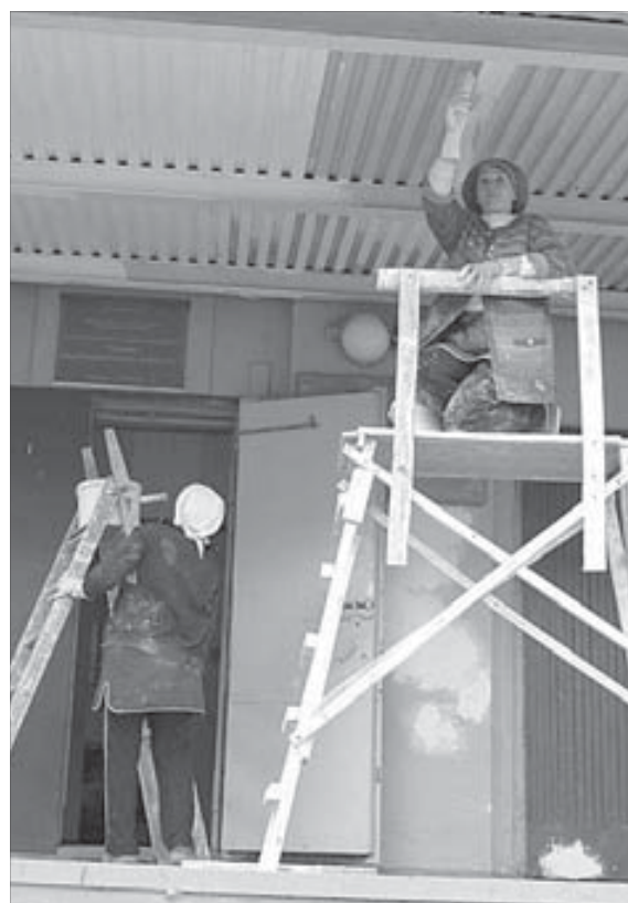
К 1 сентября школа заметно посвежеет