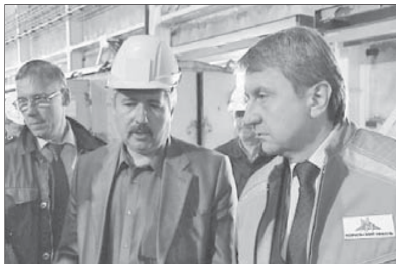
Объект должен быть сдан точно в срок

дых частиц. Вода будет подвергаться механической, химической и биологической степеням очистки. Директор Заполярного филиала поручил уточнить графики строительства и распорядился сдать объект в эксплуатацию точно к запланированному сроку.