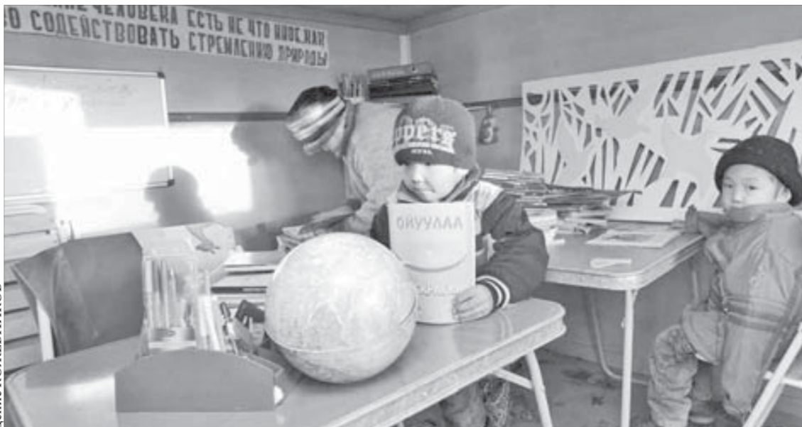
В кочевой школе нет каникул

Результатом работы финских и таймырских специалистов стало несколько проектов. Во-первых, финны намерены пригласить двух специалистов и студента Таймырского колледжа в Центр образования саамского региона для проведения мастер-классов по декоративно-прикладным видам искусства народов Таймыра и обработке шкур оленей. Кроме того, они могут обучить финских студентов традициям оленеводства.