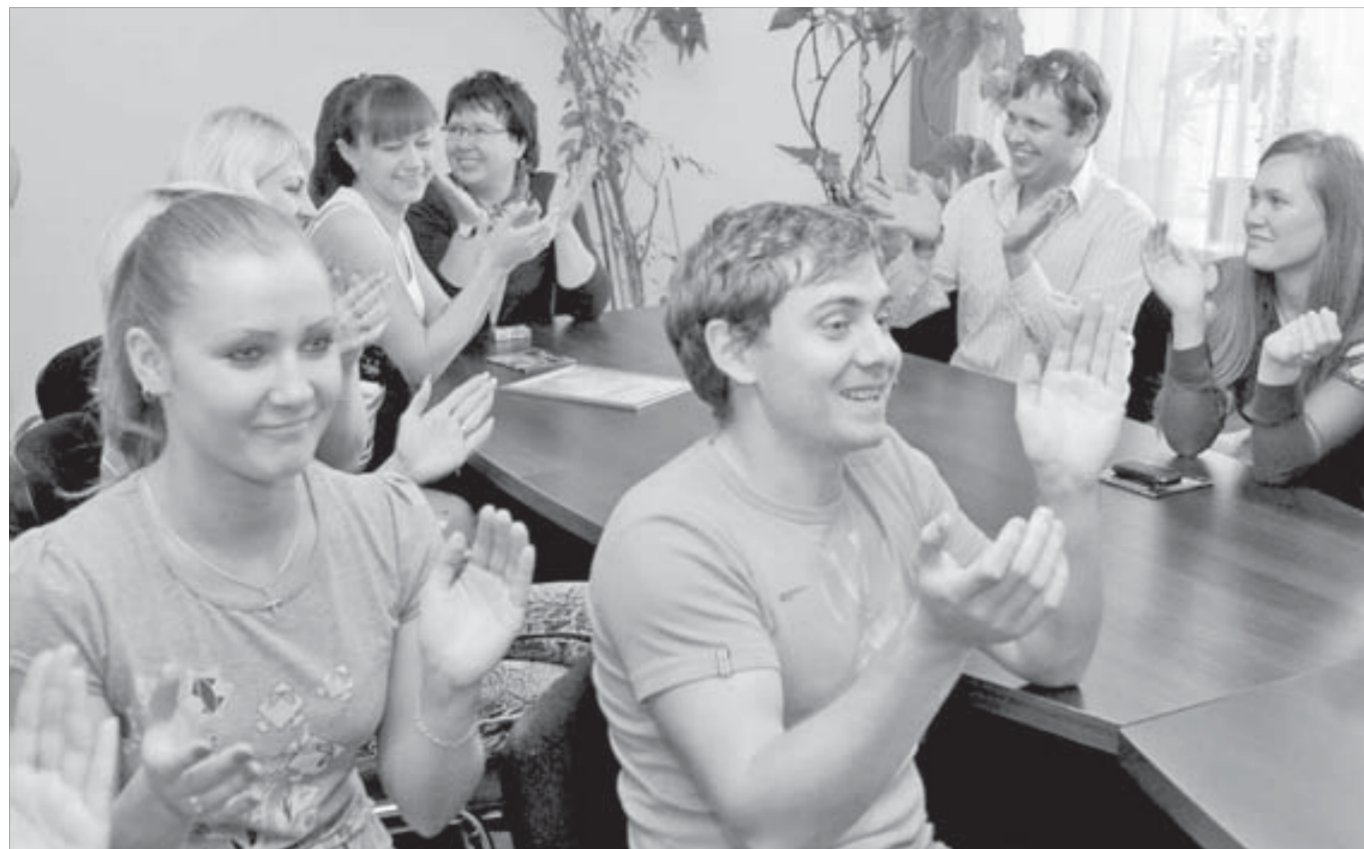
Все достойны аплодисментов

мероприятия будут проходить в городе и нужна ли помощь. Так я оказался в составе актеров постановки "Вам, покори́вшим Север".