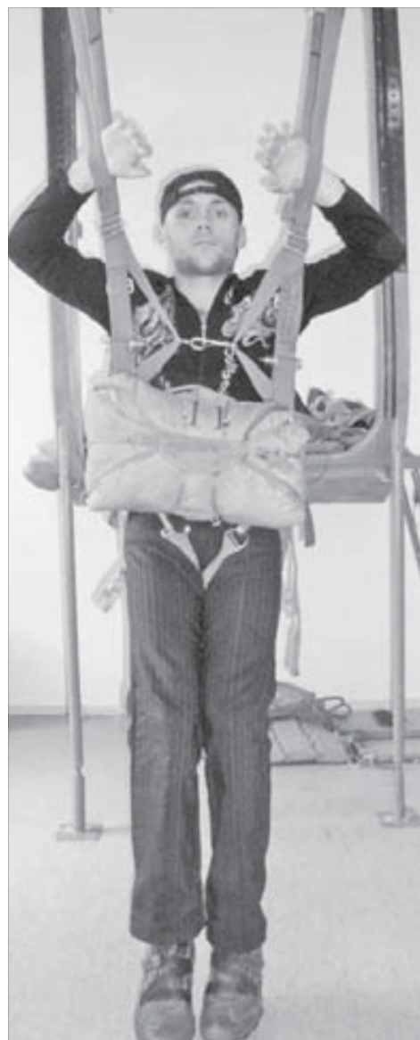
Стропы управления на себя – земля под ногами