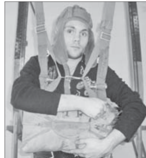
У запасного парашюта своя специфика

Меня слегка удивило, когда помощник инструктора парашютного клуба «Императоры небес», где я заявил о своем желании,