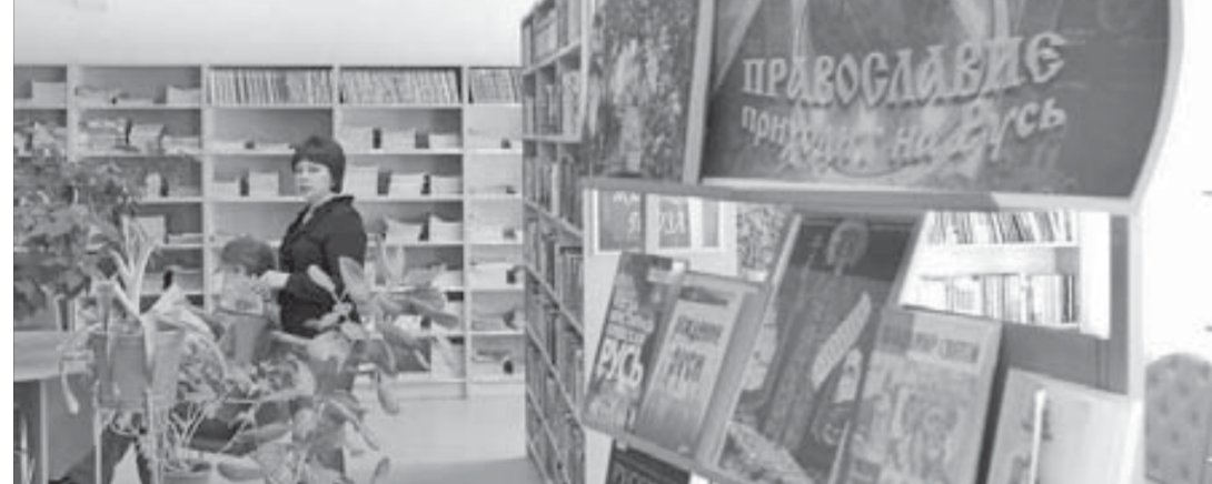
Книжки для тех, кому интересна история

В Публичной библиотеке открылась выставка, посвященная новому российскому празднику – Дню Крещения Руси.