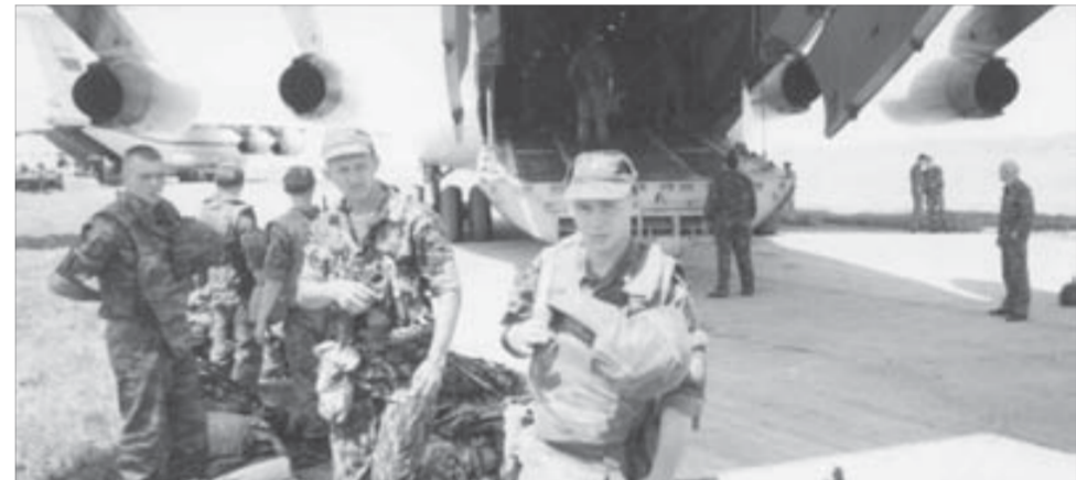
В «Ил-76» посадка производится через рампу. Через нее же выходит «боевой поток»