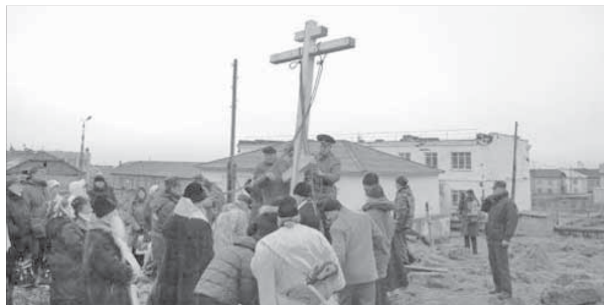
Установка поклонного креста на месте будущего храма

Самый северный в мире православный храм будет возведен на Диксоне.