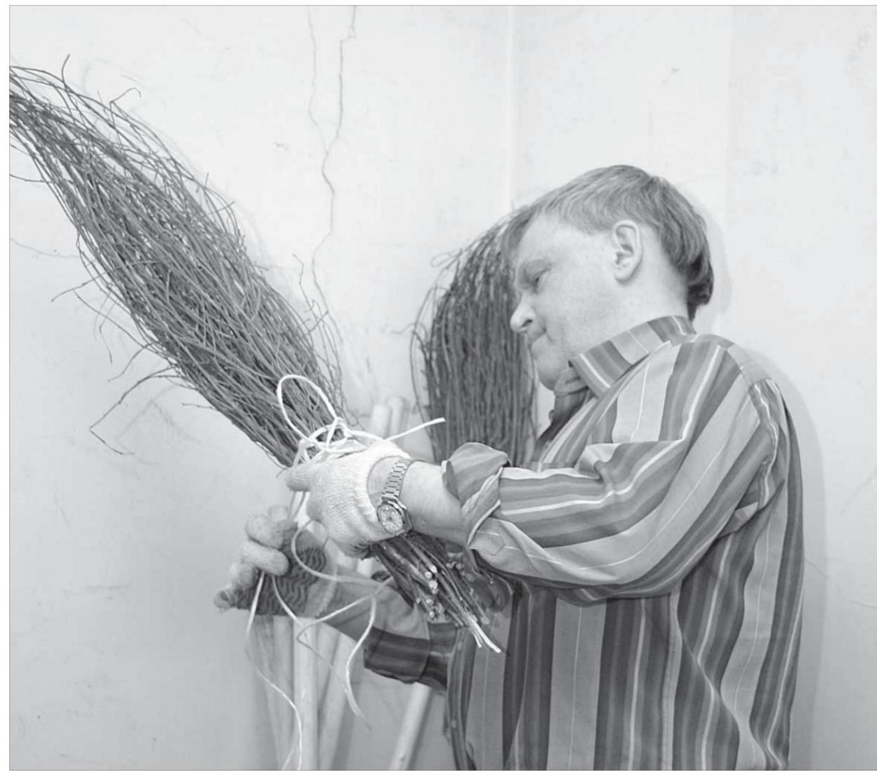
Готовь метлу заранее!

Кайерканский филиал музея в этот день будет открыт для посетителей с 13.00 до 16.00. В Талнахе для всех желающих состоятся обзорные автобусные экскурсии по району. Отправление автобусов в 15.00, 16.00 и 17.00 от здания районной администрации (ул. Диксона, 10).