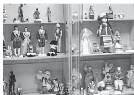
Куклы народов мира к парадку готовы

В День России в конференц-зале городской Публичной библиотеки пройдет парад дружбы.