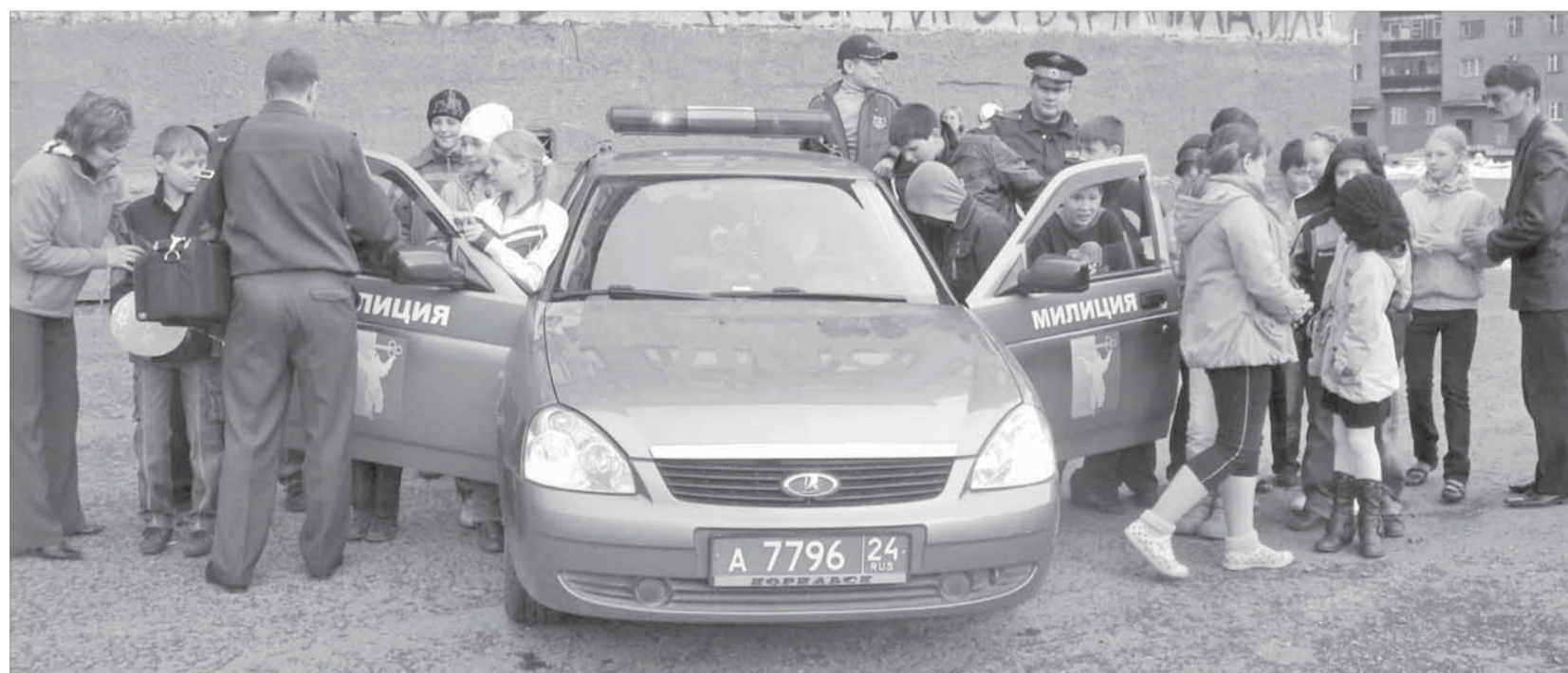
Посидеть в патрульной машине дети посчитали за удовольствие

После короткой беседы ребятам дают ознакомиться с оборудованием патрульной машины. Наибольший интерес у школьников вызывают средства видеонаблюдения.